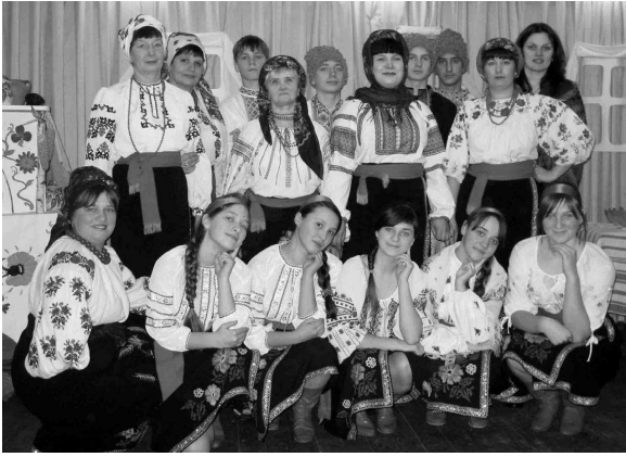
Цікаві, веселі Андріївські вечорниці відтворили на сцені учасники Фасівського клубу.

Глядачі були у захваті і разом з учасниками свята поринули в атмосферу минулого. Колоритне дійство розгорнулося на сцені. Милозвучні пісні лунали у виконанні учасниць ансамблю «Джерело» (керівник Г. Ушатенко). Дівчата і хлопці весело жартували, солодку калиту кусали, проводили конкурси між собою, ворожили, а також веселих пісень співали.