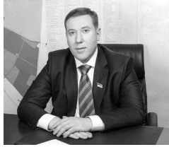
Ваш Руслан СОЛЬВАР, народний депутат України.

День Святого Миколая, який ми відзначили 19 грудня, - одне з найбільш світлих і радісних свят. Цей день нагадує нам про добрі справи, милосердні вчинки та любов до ближнього. Дітлахів ще звечора переповнює нестримне очікування якогось дива та бажання отримати подаруночок від чудотворця. Але не тільки діти радіють цьому святу - кожен із нас вірить у здійснення заповітної мрії, котра під силу лише Святому Миколаю. Даруймо одне одному лише щастя і любов. Нехай у кожного з нас щоденно і повсякчас очі світяться радістю та щастям, а великий чудотворець вселяє в наші душі віру, надію та любов!