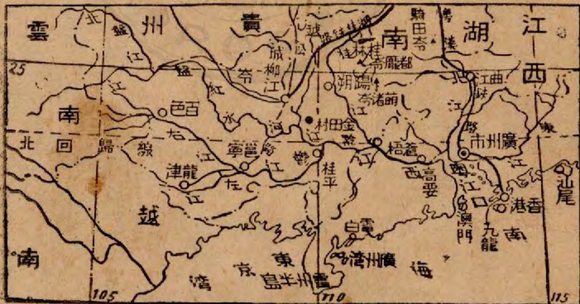
粵江流域及西江流域圖

『從高要坐船溯西江而上，沿江山明水秀，風景美麗。一到廣西境，就是蒼梧，在桂江入西江之口，是廣西省東面的門戶。江中船隻銜接，多載米、木材、牛皮之類，商業很盛。東北有大雲山，市區依山而築，房屋密，人口多。沿江有一種房屋，是我們所沒有見過的。那種房屋，下面以三木船橫排，上架木板，築成樓閣，外圍鐵