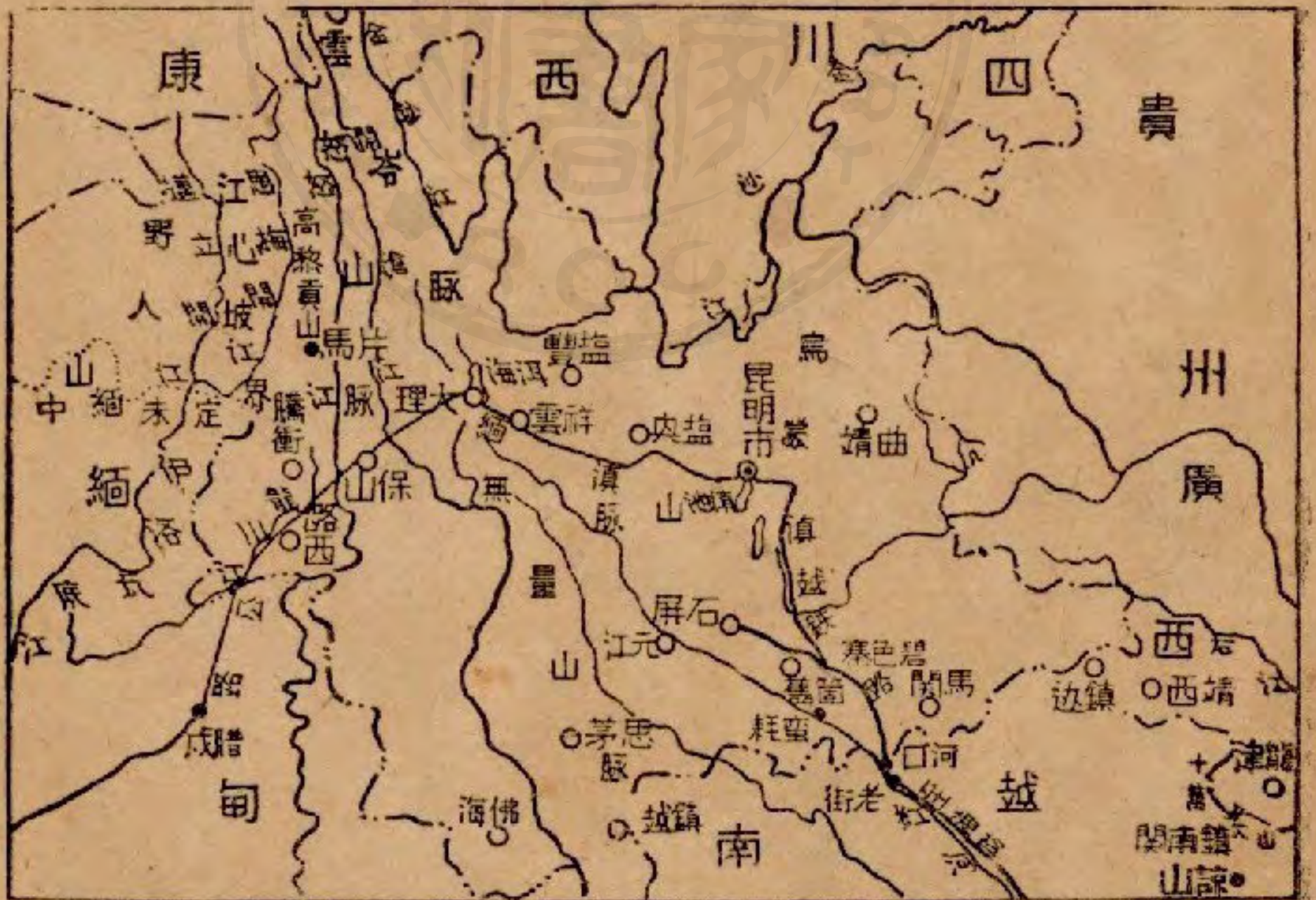
片馬江心坡及橫斷山系地圖

『先飛向北方邊地、經片馬，在騰衝之北，是川、滇、康交通要道。再西北，便是江心坡，在恩梅開江和邁立開江的中間，和片馬是唇齒相依；產樹膠、鹿茸、麝香、金礦等，很有名的。再西是野人山，爲江心坡的外圍，中緬未定界卽在此。以軍事來講，要保片馬，須保江心坡；要保江心坡，必須在野人山一帶靠天險建設要塞，鞏固國防。在那裏上空盤旋了一周，便回飛經騰衝，據周少將告