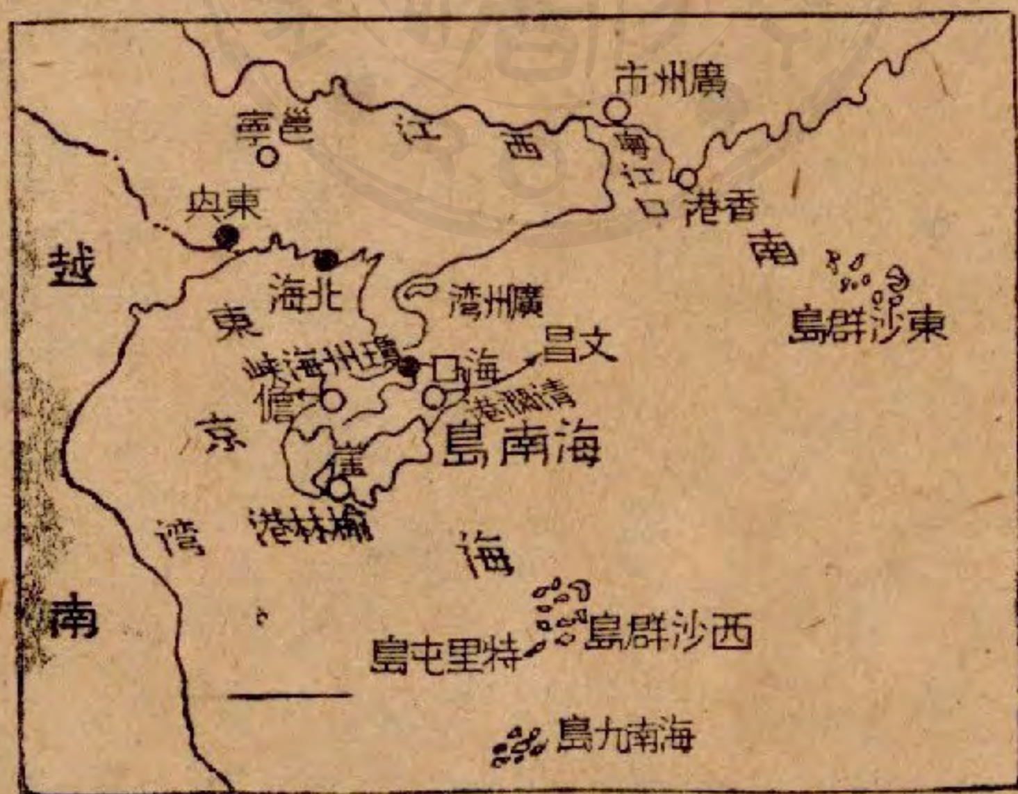
圖 島 南 海

『這次遊歷所經，都是廣東海岸，多港灣和島嶼，交通便利，又富魚鹽之利，可稱爲全國最良的海岸。但是認爲缺憾的，有下列幾處因路遠沒有去，不過從僑胞的談話中略爲知道一些。一是東沙羣島，在香港東南海中，海產很盛，閩、粵漁戶多往捕魚，且多磷礦。二是西沙羣島，在海南島東南，最南的叫特里屯島，一共有三、四十個島，富有鳥糞肥料。特里屯島的南面，約六百多公里遠，還有海南九島。這些島嶼，我們聞、