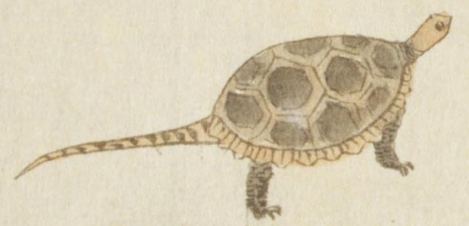
亀ノ兒 錢カメト呼

按ニ鼈ハ湖中池淵ニ多シ形亀ニ似テ甲ハ四邊ニ肉 縁アリテ纏フ此レヲ肉裙ト云味ヒ佳ナリ邵武府志ニハ裙ト云 甲及裙共ニ灰色ニシテ首ニ近キ邊ニ黒星ノ點ヲ置甲ノ中直 ニ一條ノ縫目アリ左右ヨリ核斑文敷連ラヒキ四足共ニ灰色 一足四爪ヲ有シ甚凄也首ハ亀ニ似タリトヘ氏又凄 ニシテ甲ト同色黒星點ヲ在シ首裡灰色ニ色陰ニ 一ノ字ノ黒斑望ニ並ヒ其下ニ灰色ノ星點正ク並ヒ 眼中ニ黄ニシテ黒瞳鮮明勢甚蛇ニ似タリ又眼上ニ 八字形ノ黒點アリ眼ヨリ先ノ方細ク尖リニ至テハ 一分許ニシテ及張ス其尖ニ二穴アリ此鼻穴ナリ口ハ鼻下ニ アリ口中朱色奈大ノ如ク上下ノ齒左右ヨリ前共ニ一枚 ヲ引廻シ薄ク刺刀ノ如ク尾ハ十クニテ腹面ハ灰色 アリ白色アリ黒色アリ湖中ノモノハ黄色ノモノ多シ卵ハ金 橋ノ如ク陸ニ上リ産シ土中ニ埋々候ハ其色雜卵ニ似タリ腹甲 ニ五字ノ形アルモノ稀ニアリ其母アリテ人ヲ害ス白鼈朱鼈皆毒 アリ凡鼈湖中ニ四尺許ノモノアリト云漁者好シ見ル又二尺 許ノモノハ時々浮遊ス予モ此レヲ見タリ