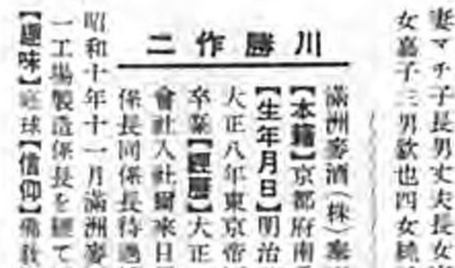
川 勝 二 作

滿鐵職員、教化工務段勤務 【本籍】群馬縣多野郡吉井町小柳【生年月日】明治廿七年一月廿日【學歴】房吉ノ二男【經歷】大正十三年