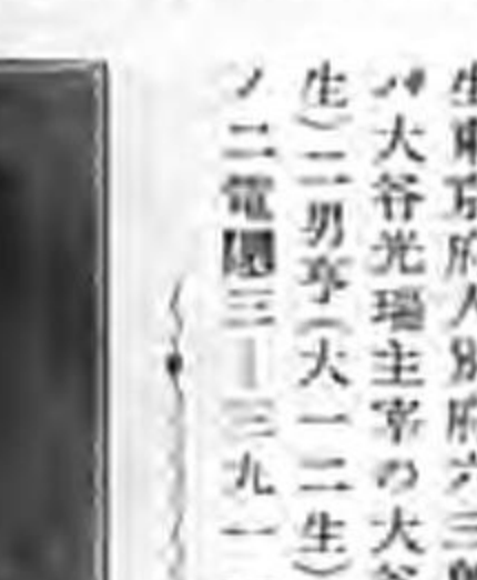
古 賀 康 八 郎

滿鐵職員、卓坊屯鐵道工場木工科主任 【本籍】山口縣厚狹郡小野田町北中川町八〇六番屋敷【生年月日】明治四十一年一月一日【學歴】大正九年大阪帝國大學工學部機械科卒業【經歷】昭和九年四月滿鐵に入り鐵道工場に勤務爾來卓坊屯工場監理科木工科臺車廠副主任等に歴勤昭和十一年九月鐵道工場と改稱後も引續き今日に及ぶ【趣味】柔道釣魚圍碁【信託】淨土宗【家族】妻安江（山口縣野村兼介二女山口厚狹高女卒）長男智恵子（昭一〇生）【住所】奉天白菊町二二三ノ二