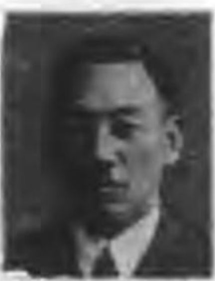
原 政 治