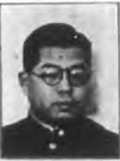
山 爲 田 二

三五生京都府上原縣長女兵庫縣立梅原高女卒)長男智夫(大八生大連二中在)長女小夜子(大一一〇生錦丘女學校在)二男規夫(大一一二生新京中在)【住所】公主嶺地取街二ノ一四