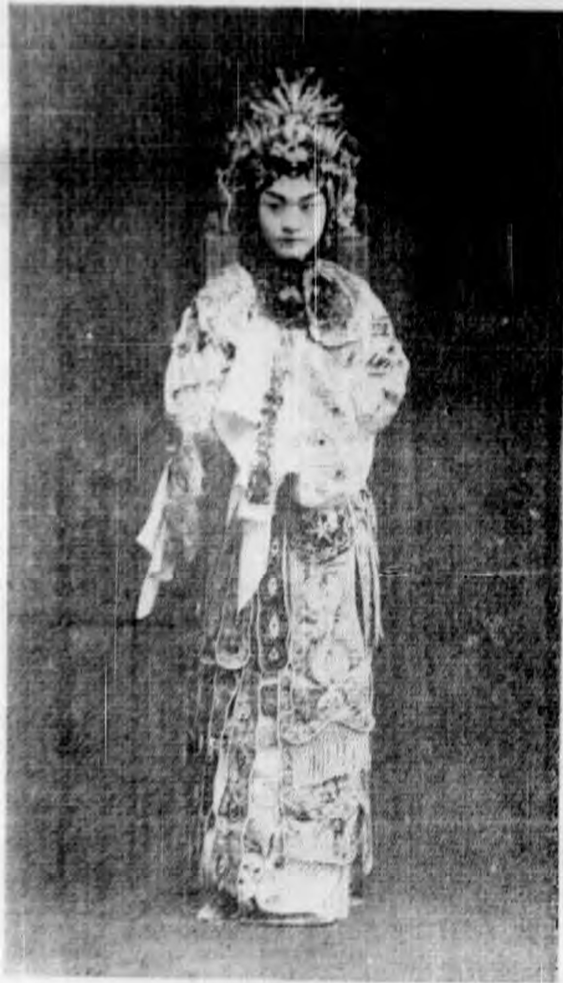
程 硯 秋 (江 采 蘋) 梅 妃