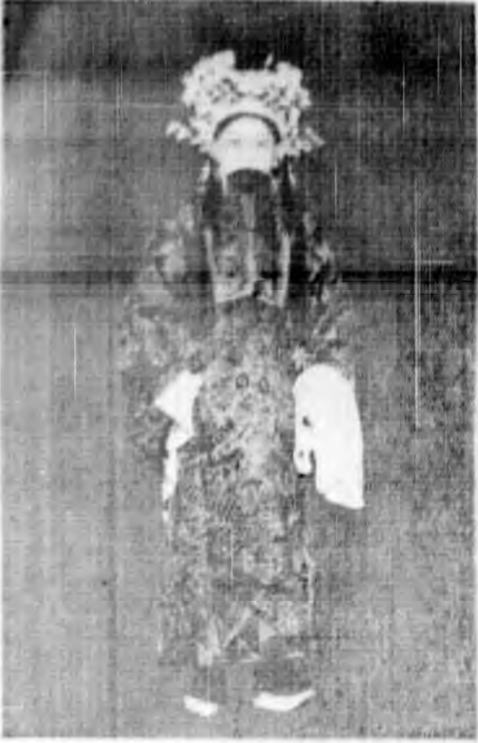
王 世 績 (劉 備)