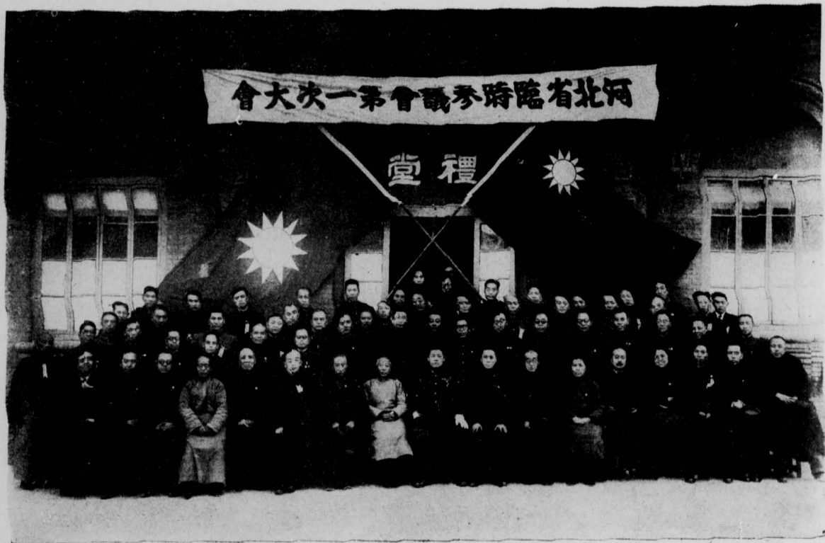
月三年六十三國民 影合禮典幕開會大次一第會議參時臨省北河