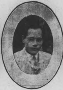
理經司公通和 生先裘紹林