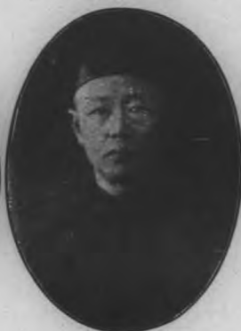
理經副行銀門廈 生先松雲劉