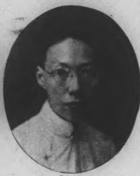
事董駐常司公燈電 生先鏡耀陳