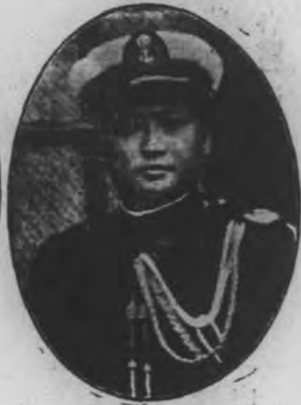
長隊大安保山禾 生先洲滄葉