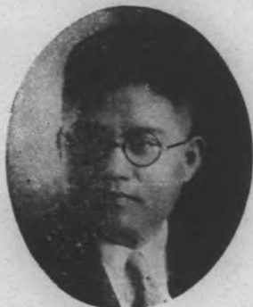
理經隆匯金 生先津京紀