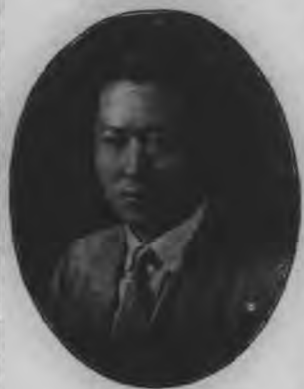
思明市政警備處處長