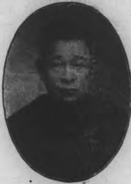
問願署公靖綏建福 生先情友黃