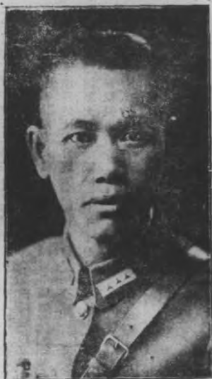
第十路軍總指揮蔡廷