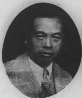
任主庫國行銀央中門廈 生先齋啟李