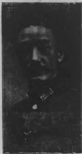
福建省政府主席蔣光