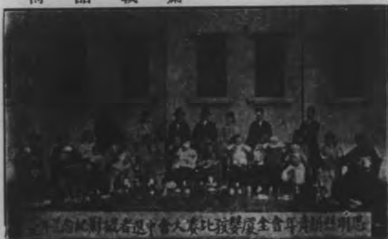
新明青年會暨全慶比大會中選者記者於此