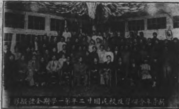
刊報體全期學一第年二廿國民校及習會年會新