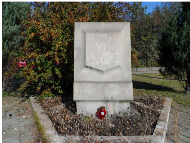
ul. Markietanki (Rembertów)