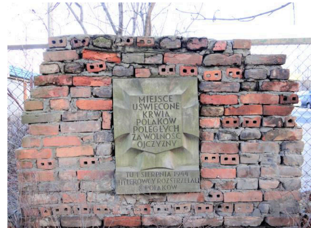
ul. Sowińskiego (Wola)