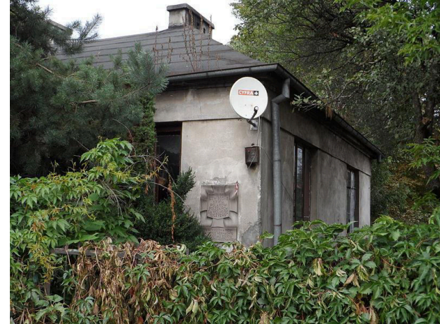
ul. Pułkowa (Młociny)