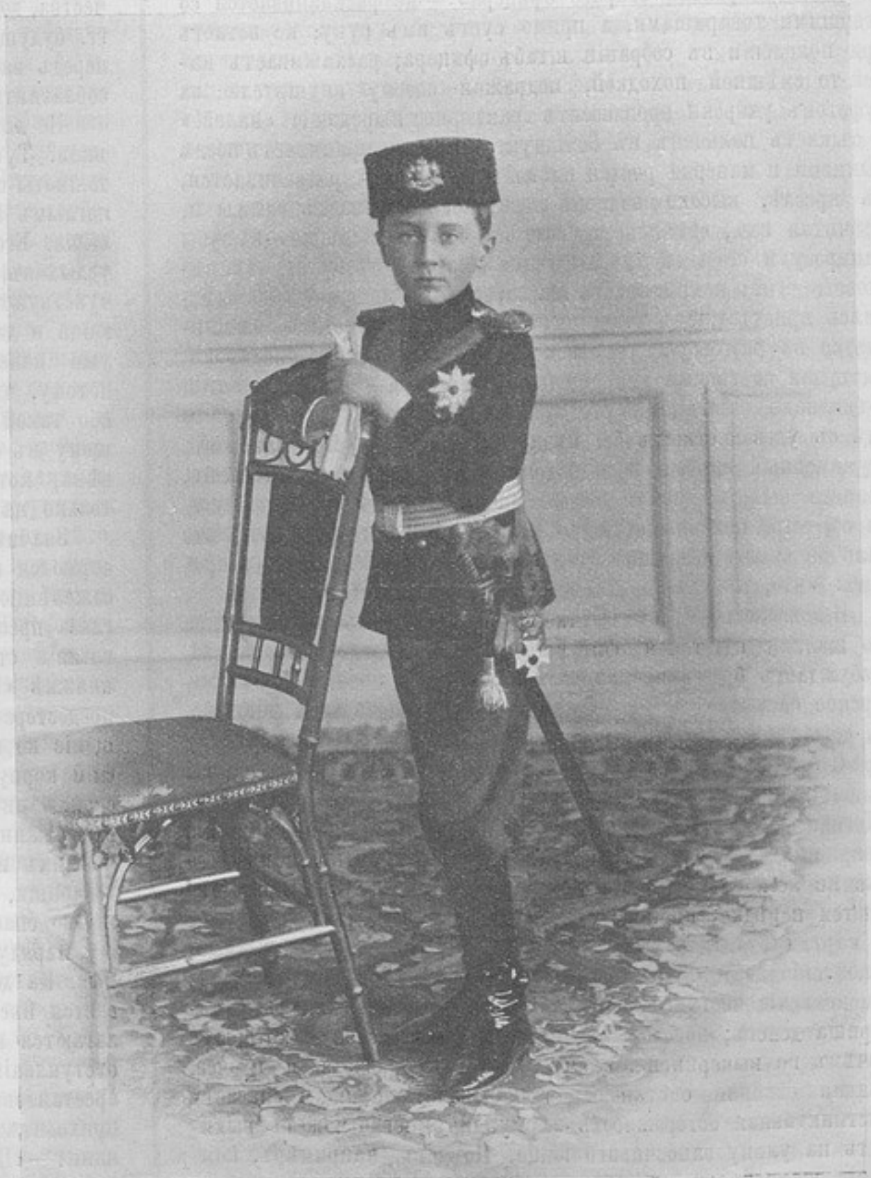
Княжичъ Болгарскій Кирилль. (Изъ книги «Изъ прошлаго»).

Конечно, манеры офицера, въ смыслѣ ловкости, мягкости, изящества, всегда разнятся отъ манеръ солдатскихъ, но это не значитъ, что офицеръ распускается, напротивъ,—это свидѣтельствуется о хорошемъ навыкѣ, о непринужденности въ исполненіи, а гдѣ непринужденность, тамъ и красота, т. е. красота воинскаго приличія. Нужна ли выработка хорошихъ военныхъ манеръ? спроситъ читатель, неумѣющій вдумываться въ самые простые педагогическіе акты. Надо развивать въ офицерѣ и солдатѣ внутреннее сознаніе своего долга, внушать имъ любовь къ наукѣ и прочее, а приличные манеры — это вздоръ. Разсуждая такимъ образомъ, вы попадаете пальцемъ въ небо, ибо и долгъ, и наука, и все внутреннее развитіе война