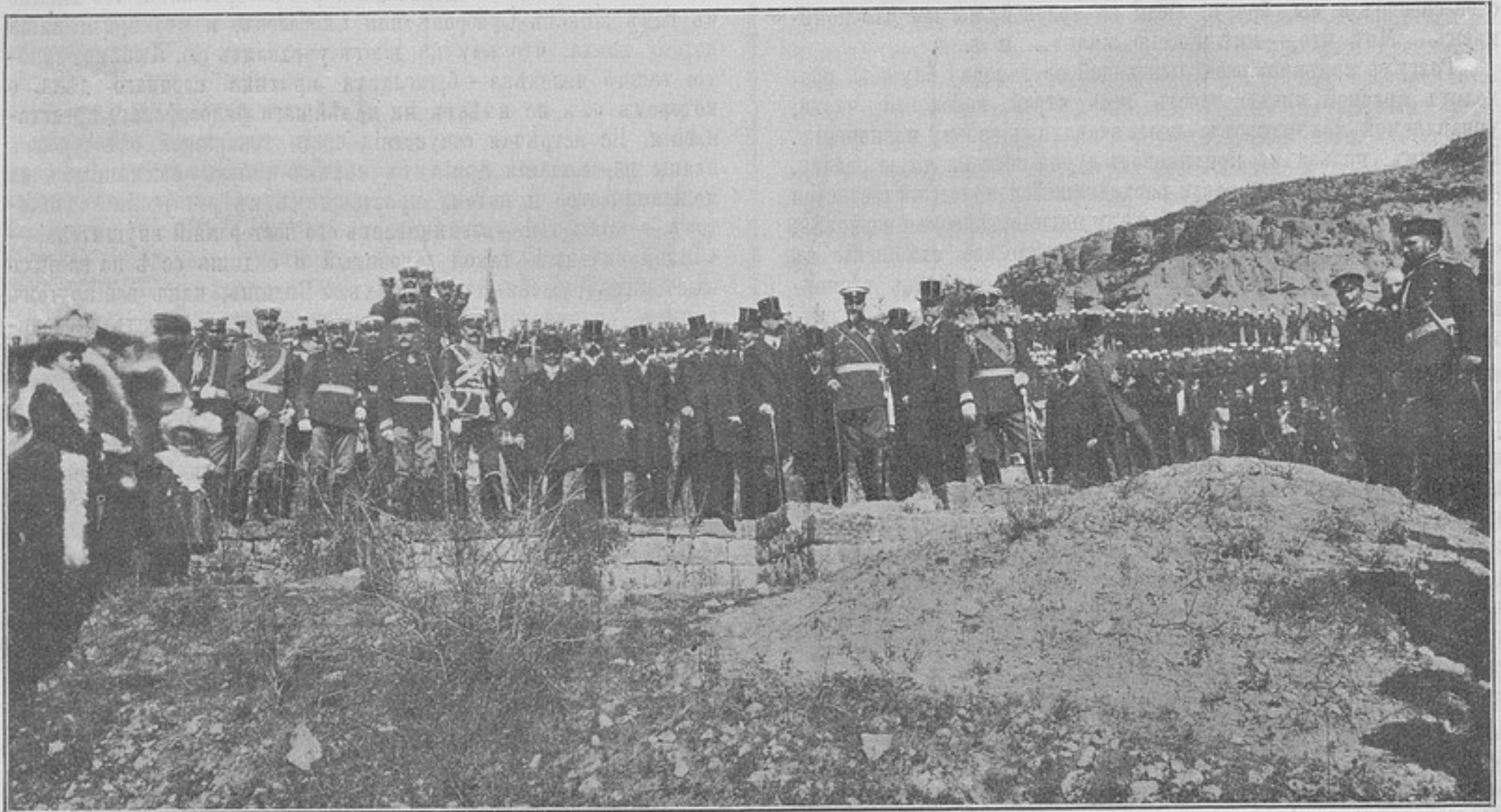
Фердинандъ I, король Болгаріи, съ министрами, въ день провозглашенія независимости государства, 22-го сентября сего года.

Дѣйствительно работы въ штабѣ округа конечно гораздо больше, чѣмъ въ штабѣ корпуса или дивизіи; преимуществъ такая служба не даетъ, такъ какъ все движеніе основано на