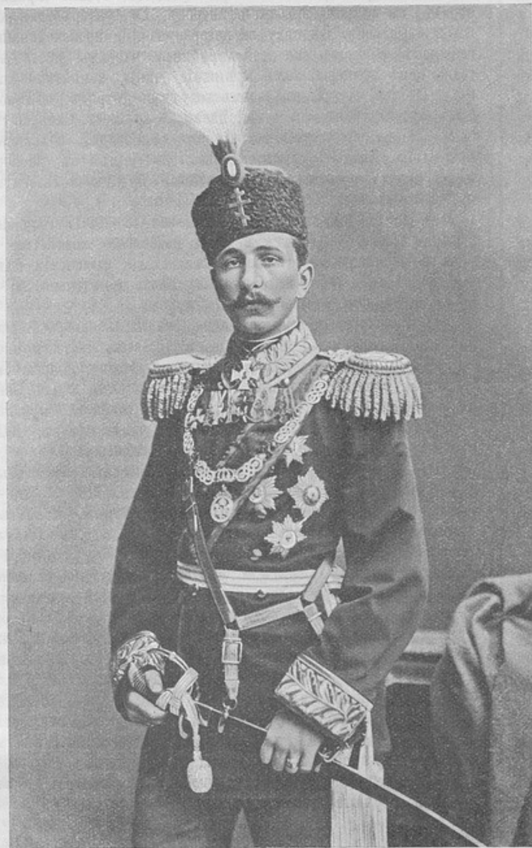
Первый князь Болгаріи Александръ (Принцъ Батенбергъ). (Изъ книги «Изъ прошлаго»).

◆ По разъясненію Правительствующаго сената, юнкерскія училища не могутъ быть признаны принадлежащими къ числу составныхъ частей арміи, поэтому они не могутъ быть отнесены къ числу тѣхъ учреждений, въ пользу коихъ уста-