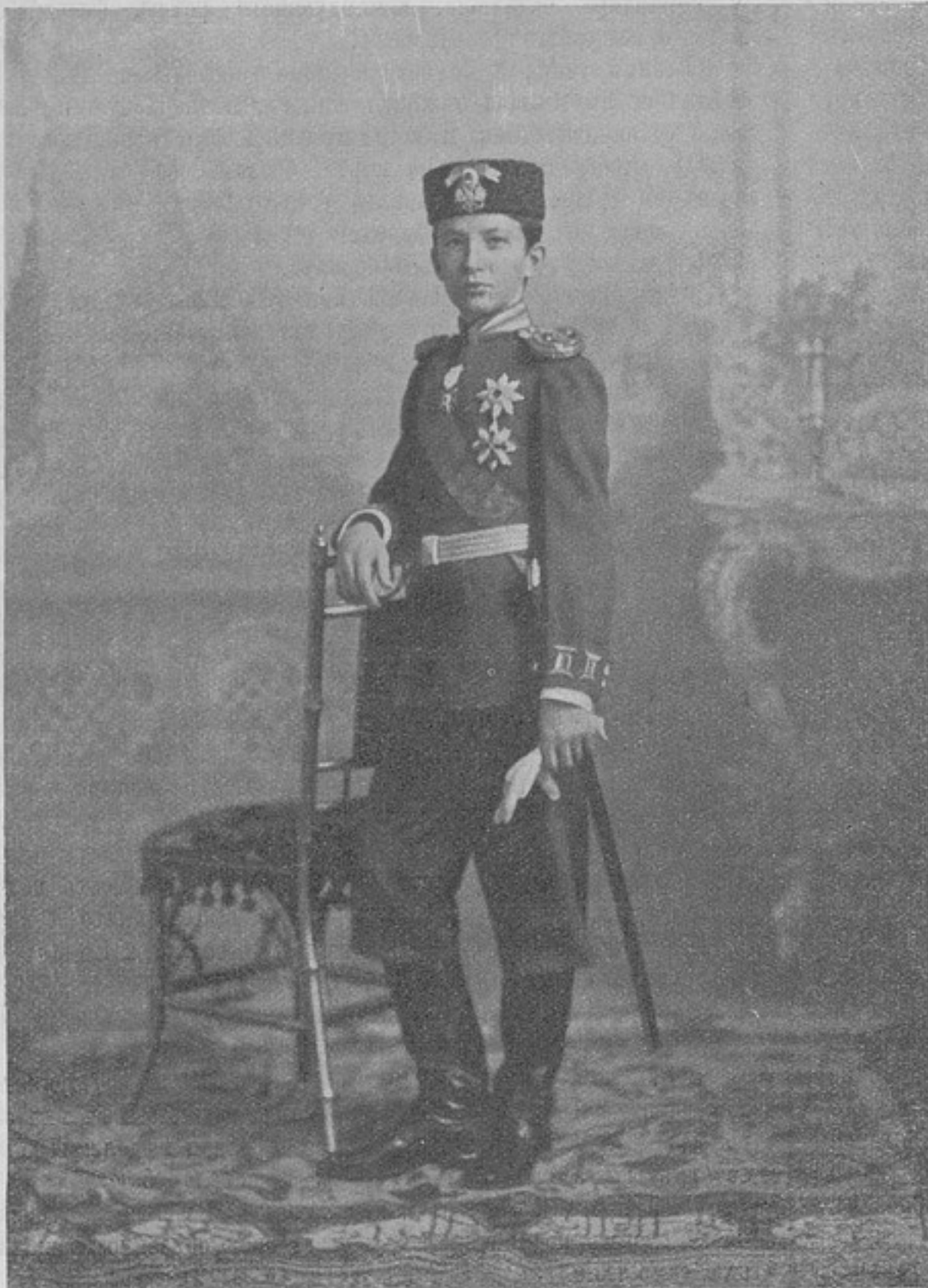
Княжичъ Борисъ. Наслѣдникъ Болгарскаго престола. (Изъ книги «Изъ прошлаго»).

щихъ лицъ къ мелочамъ и къ подлаживанію подъ вкусъ власть имущихъ, одновременно съ этимъ отвлекается ихъ вниманіе отъ дѣйствительно важныхъ дѣлъ, упущенія по которымъ отзываются катастрофами, но за то не бросаются такъ рѣзко въ глаза и не дѣйствуютъ такъ раздражительно на высокихъ начальниковъ.