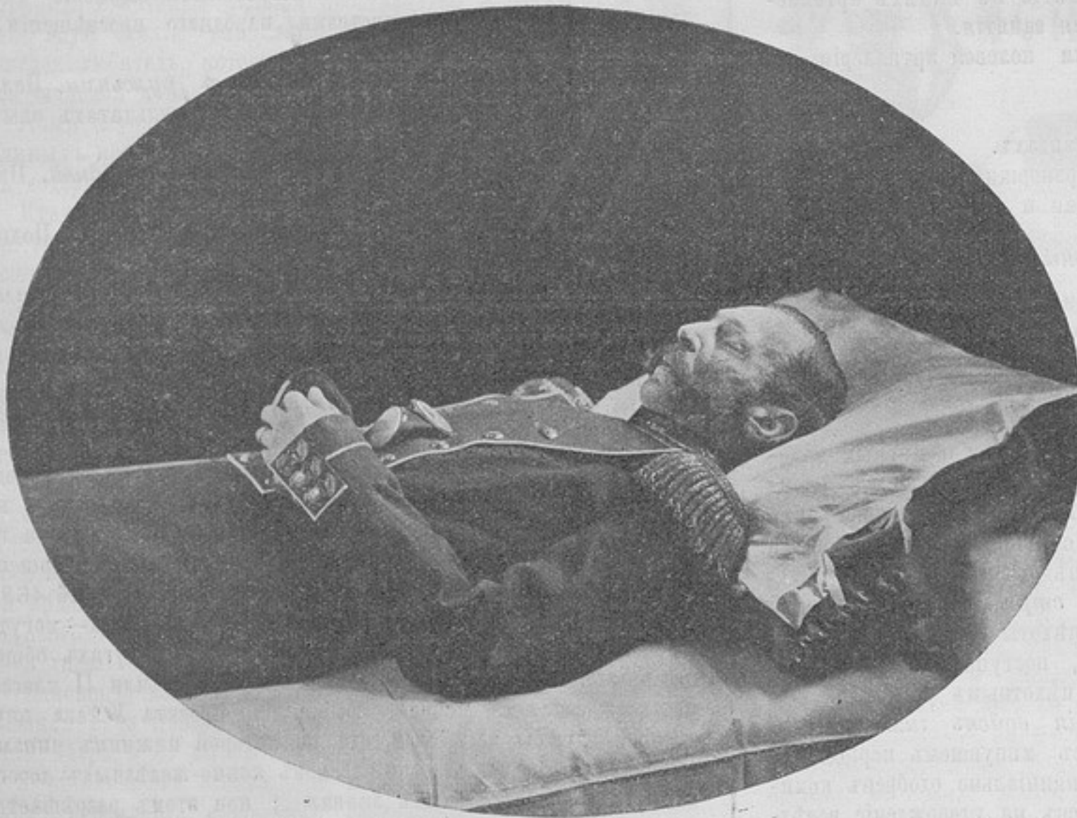
Императоръ Александръ II-й, 2-го марта 1881 г. (Изъ книги «Изъ прошлаго»).

◆ Главное военно-медицинское управленіе разъяснило, что врачи, командируемые въ присутствіи по воинской повинности, должны быть удовлетворяемы на проѣздъ и за время пути путевымъ и суточнымъ довольствіемъ, согласно временнаго положенія, объявленнаго при приказѣ по воен.