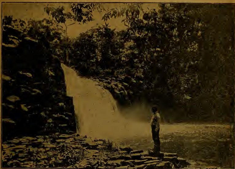
Salto del río Caimito cerca de La Chorrera.

Hasta 1821 la provincia de Panamá estuvo formada de la Gobernación del mismo nombre y de las Alcaldías Mayores de Portobelo,