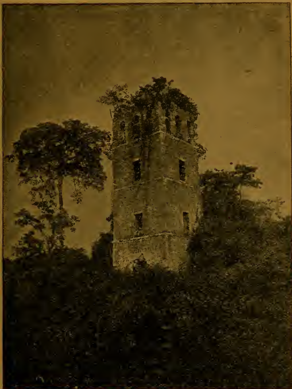
Torre derruída, en la antigua Panamá.

En enero de 1671 el pirata inglés Juan Morgan, partiendo de Chagres con 1500 bucaneros y filibusteros, atravesó el Istmo y llegó á Panamá. En un bosque pantanoso, cerca de la ciudad, los piratas derrotaron la caballería española que salió á atacarlos, y dispersaron