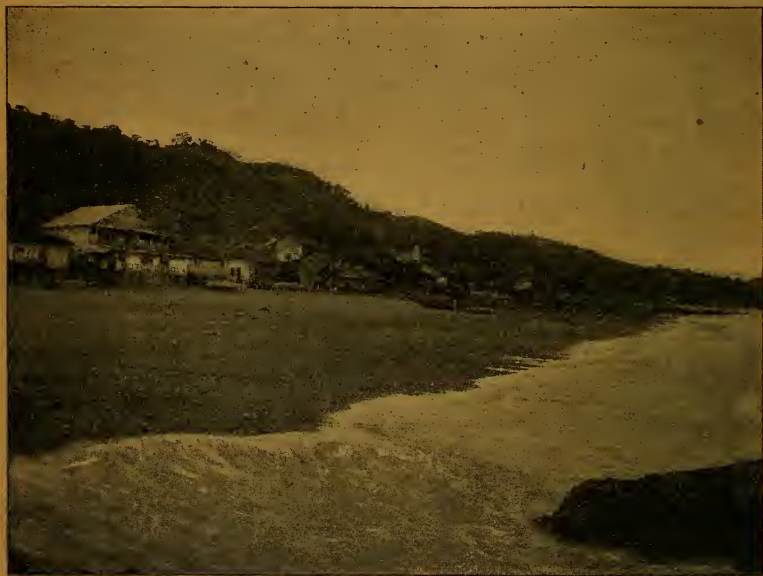
Pueblo de Taboga.

En 1828 el Comandante de la Pichincha , fragata de guerra peruana, surta en el puerto de Taboga, dió á bordo un suntuoso baile,