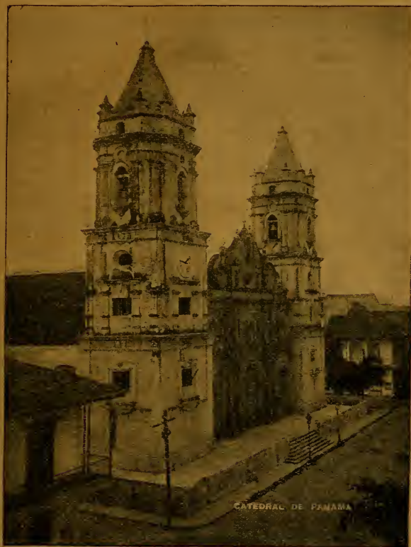
Catedral de Panamá.