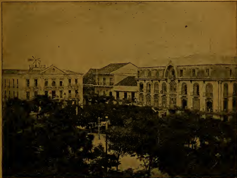
Obispado y otros edificios frente al parque de La Catedral.

El estado sanitario de la ciudad ha mejorado notablemente; su temperatura media es de 27° del termómetro centígrado, pero las mañanas y las noches son frescas y agradables.