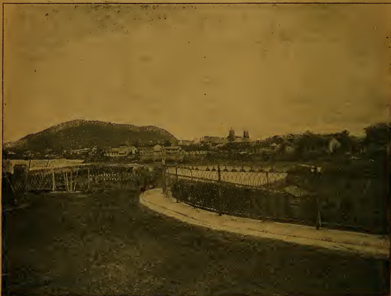
Vista de Panamá desde el paseo de Las Bóvedas .

Dos años antes de estos sucesos, el Gobernador de Panamá había intimado á Morgan que evacuase la ciudad de Portobelo, de la cual se había apoderado; el pirata devolvió el mensajero enviando al Gobernador una pistola y diciéndole que con esa arma había tomado á Portobelo, y que pronto iría á recuperarla en el mismo Panamá.