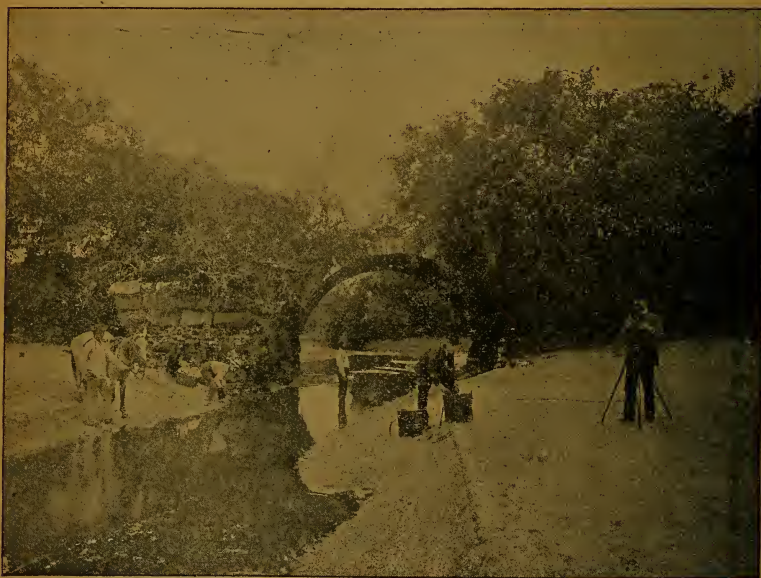
Viaducto que conducía á la antigua Panamá.

Guzmán, que formaban parte de una expedición enviada á las costas del mar del Sur, fueron los primeros que en 1515 llegaron á un pobre caserío de pescadores en el lugar que los naturales llamaban Panamá por su abundancia en peces y mariscos, y en el cual Pedro Arias Dávila fundó en 1519 la población del mismo nombre. En 1521, de orden del Emperador Carlos V, se erigió en ciudad la nueva funda-