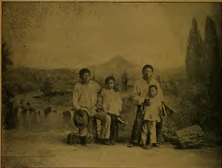
Indios cunas civilizados.

Yaviza. —Caserío situado en la extremidad de una península formada por el río Chucunaque, enfrente de la desembocadura del río Chico ó Yaviza; antiguamente era una de las principales poblaciones del Darién y en ella construyeron los españoles un fuerte con pedreros, para defenderlo contra los ataques de los indios y de los piratas. No tiene producción alguna notable. En sus bosques se encuentra el árbol de sangre , llamado así porque detiene la sangre