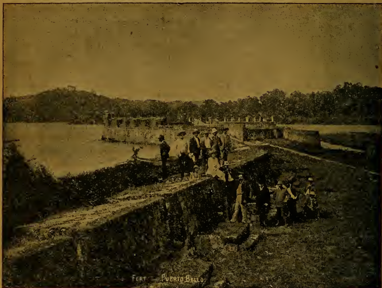
Castillo de San Jerónimo en Portobelo.

por creerla bien defendida por los cuatro castillos. Esta ciudad era, en tiempo de los Galeones, una de las más populosas del mundo, porque su posición entre ambos mares, la comodidad de su puerto y su inmediación á Panamá, le dieron la preferencia sobre todos los demás pueblos de la América, para celebrar la feria más rica, que