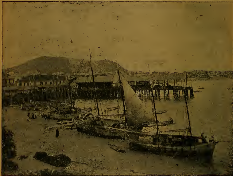
Bahía de Panamá.—Embarcadero de Playa Prieta en la bajamar.

La Palma. —Está situada frente á la desembocadura del río Sabana, en la punta más oriental de la península que forma el río