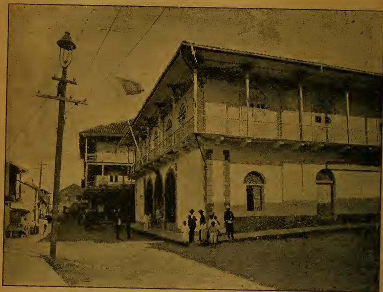
Gobernación de Panamá.

Arraiján. —Pueblo cabecera del distrito, está situado en un pequeño cerro á 118 metros sobre el nivel del mar. Su nombre primitivo era Arrayán . Es de temperamento sano y agradable. Sus gana-