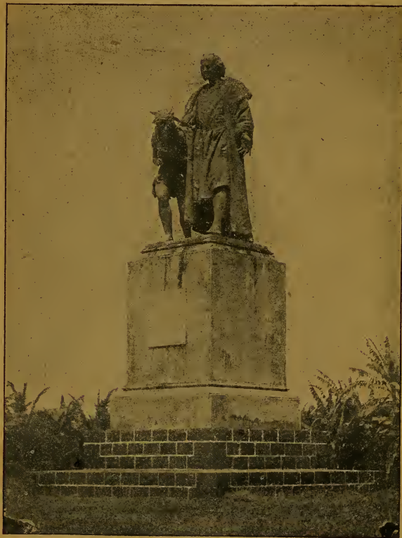
Estatua de Cristóbal Colón.

La Compañía del Ferrocarril, usufructuaria de la isla de Manzanillo, adoptó para la población el mismo plano de la ciudad de Fila-