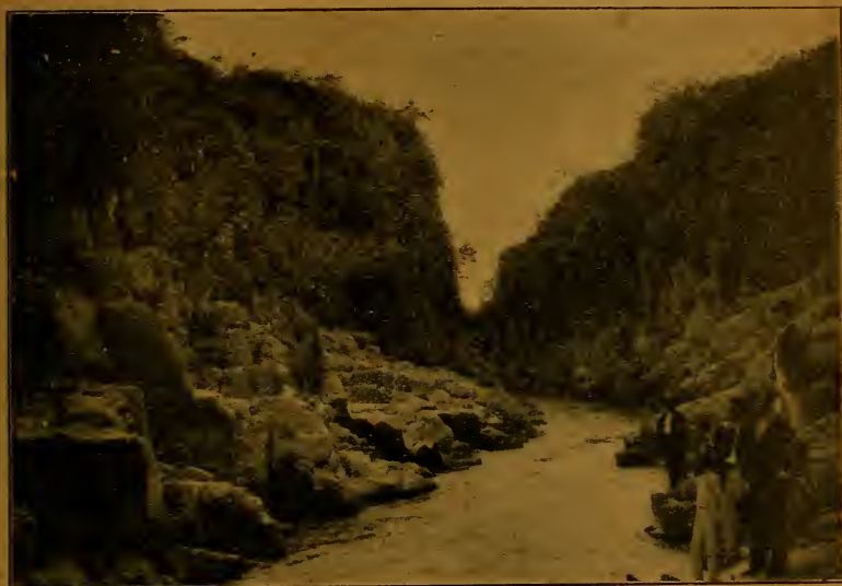
El río Saratí en la garganta de La Angostura , cerca de Penonomé.

Valles. —Hay en la provincia un gran número de valles abundantemente regados por las aguas de los ríos y riachuelos, y cubiertos de una vegetación vigorosa. El más notable de estos valles es el