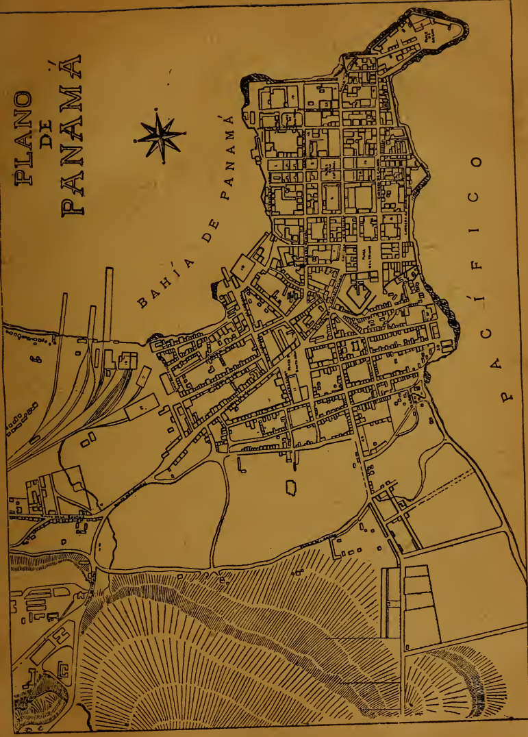
Plano moderno de la ciudad de Panamá.