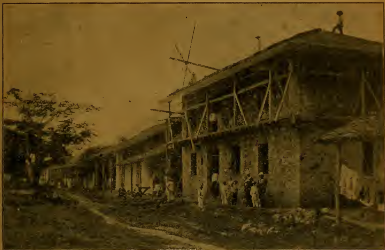
Escuela pública de varones de Penonomé, en construcción el año de 1900.

Gobierno y división política. —La provincia está regida por un Gobernador, que ejerce el poder como Agente del Presidente de la República, y que tiene bajo su dependencia, para guardar el orden, un pequeño número de agentes de policía. En lo judicial se rige la