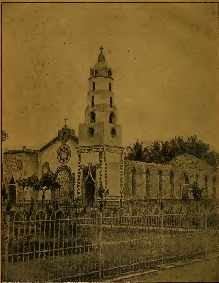
Iglesia de la Sagrada Familia, en la Plaza del Carmen de David. (En construcción.)

David (San José de).—Ciudad cabecera del distrito del mismo nombre y de la provincia de Chiriquí. Está situada en una llanura fértil y deliciosa, cerca del río de su nombre, en el mismo sitio en