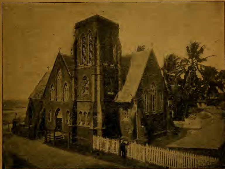
Iglesia protestante de Colón.