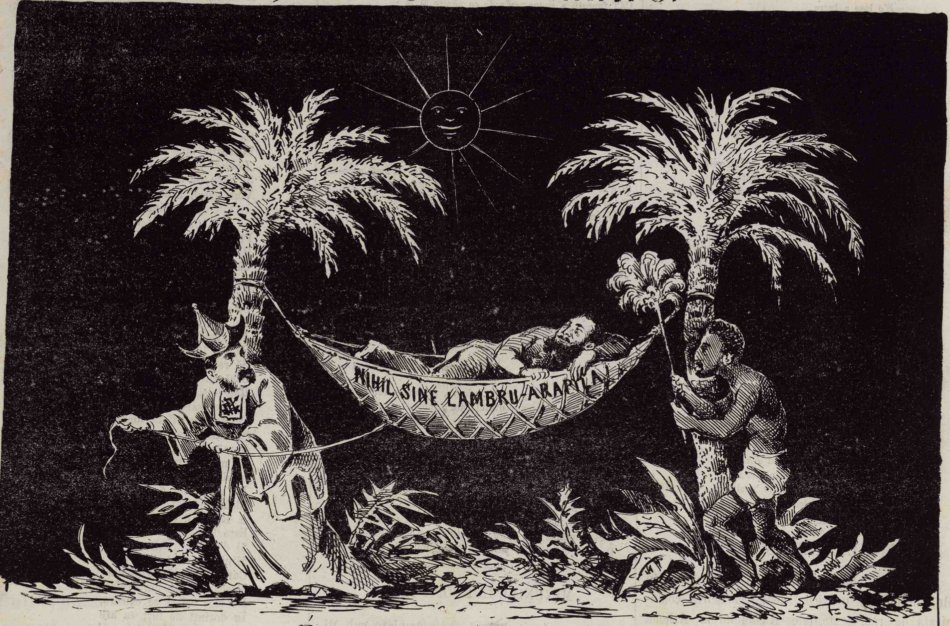
Erū puterea stă culcată Si cu pene apărată D'unū Chinezū si d'unū Arapū.