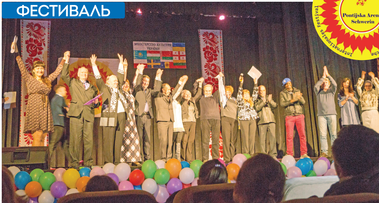
«Понтійська арена»-2017 в Києві