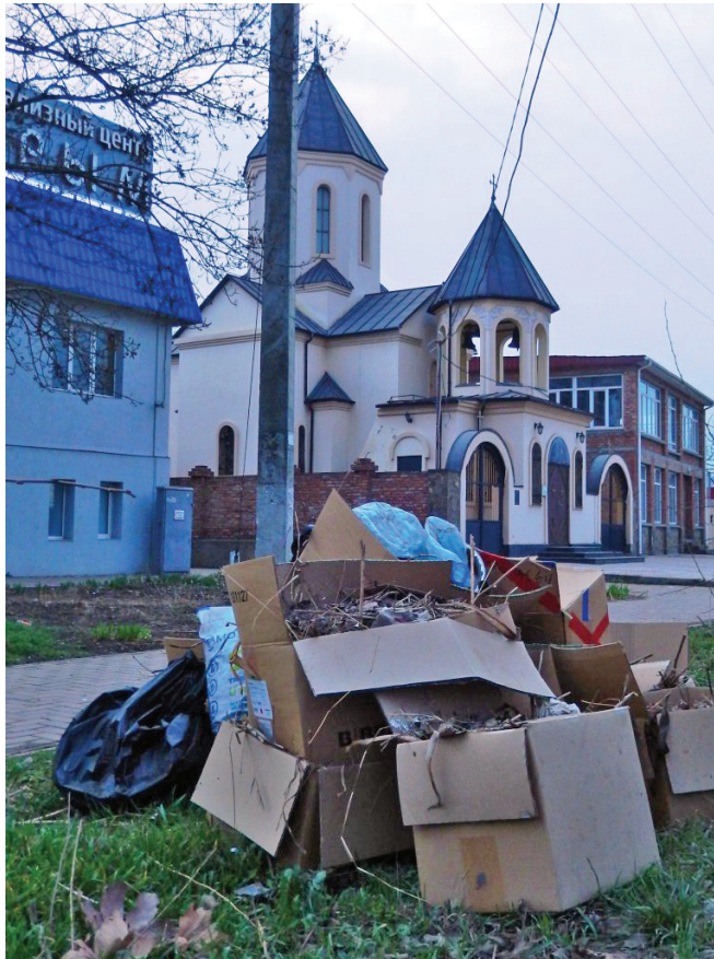
Церква святої Ніно у Керчі в окупації