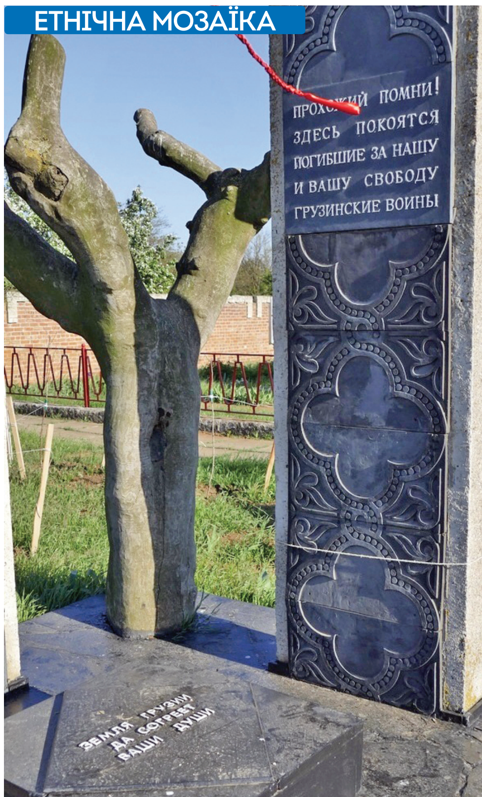
Меморіал у Глазівці під Керчу

Керченський меморіал за кілька років до російської окупації Криму відвідав відомий грузинський артист Вахтанг Кікабідзе. Саме в