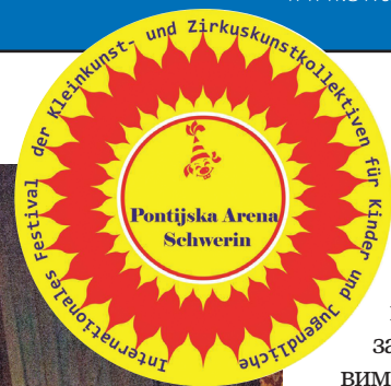
Емблема фестивалю у Шверині, Німеччина