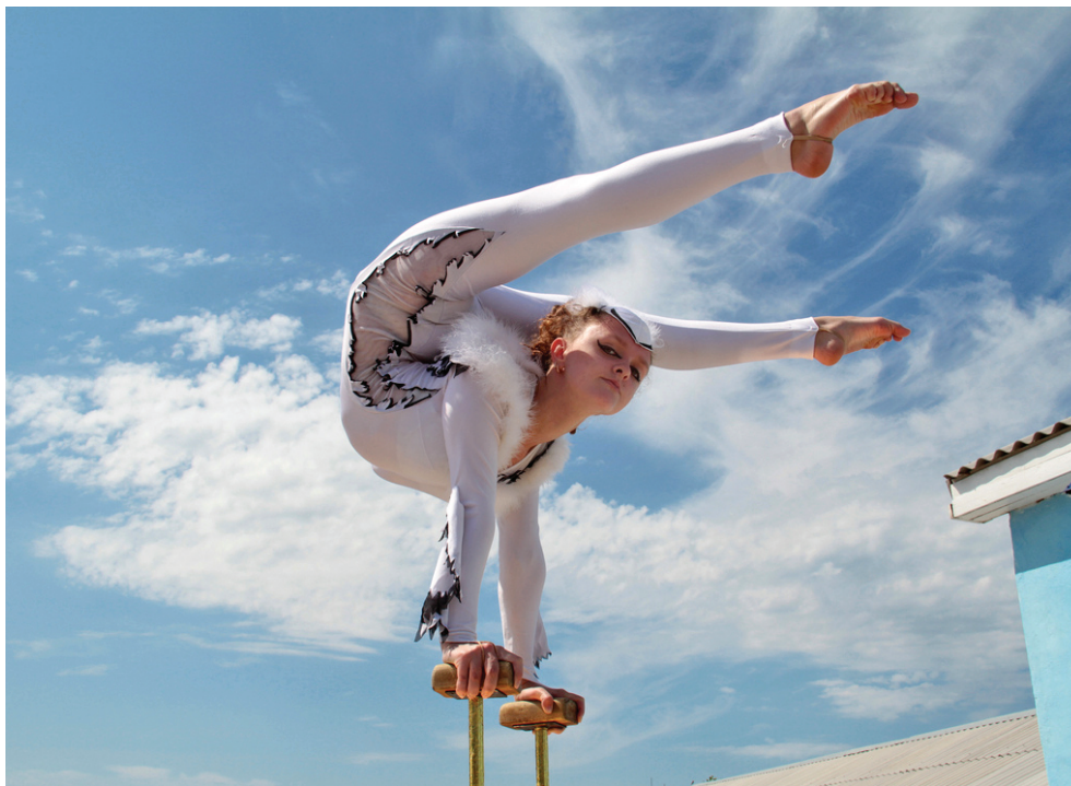
Фестиваль у Севастополі, 2012 рік

У підприємництві було обрано сферу, до якої тягнуло з дитинства, для якої були і музична школа, і балетна студія, й університетська самодіяльність студентських літ... аж до кримської ліги КВК. Практику шоу-бізнесу опанувувала адміністратором кочових естрадних колективів, а вже за рік – директором власного «Цирку на сцені». Зі своїм колективом об'їздила за 8 років усю Україну. І не тільки її міста та райцентри, а й далекі села. Пригадує, бувало, четверта вистава за добу, восьма година вечора, сільський клуб, а в залі – ледве три десятки глядачів. На очікувальні погляди артистів відповідає: «Граймо, бо діти чекали!!».