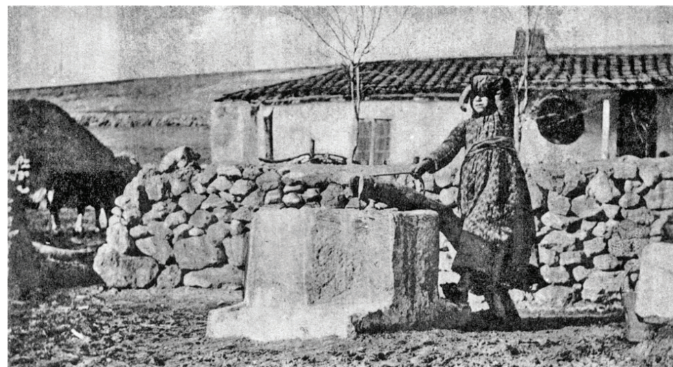
Дівчинка-татарка біля колодязя

Друга світова війна 1941–1945 рр. Для Криму вона розпочалася у 1941-му і закінчилася наприкінці 1943 року.