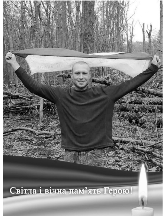
Світла і вічна пам'ять Герою!