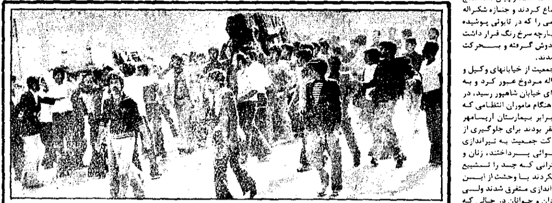
دو جوان در تظاهرات دیروز یزد کشته شدند. عکس صحنای از تشییع جنازه این دو جوان را نشان میدهد.

سندج - خبرنگار کیهان - مراسم تشییع جنازه دانش آموز ۱۳ ساله سندجی به صحنه تظاهرات خرابی تبدیل شد که طی آن ۷ نفر دیگر دراتر شندج در بازلیس کشته شدند و تعداد فریبان حوادث در روز گذشته این شهر به ۶ نفر رسید. دیروز در حدود دو هزار نفر در بر اثر مسجد شیخ محمد باقر در محله قطارچیان سندج اجتماع کردند و جنازه کشته را که در تابلوی پوشیده بود پاره پاره گشته و فرار دولت سردوش گرفته و مسحرکت درآمدند.