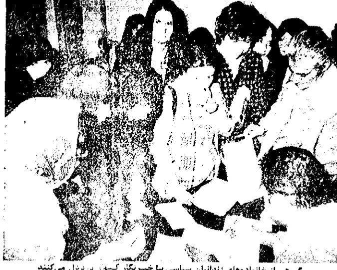
گروهی از خانواده‌های زندانیان سیاسی با خبرنگار گینز در ترمینال می‌کنند

مأموران شکنجه زندانیان را محاکمه کنید. این گروه از خانواده‌های زندانیان سیاسی با خبرنگار گینز در ترمینال می‌کنند. این گروه از خانواده‌های زندانیان سیاسی با خبرنگار گینز در ترمینال می‌کنند. این گروه از خانواده‌های زندانیان سیاسی با خبرنگار گینز در ترمینال می‌کنند.