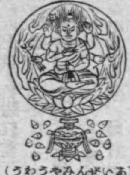
(うわうやみんせいは)

「くま」一限名役者の顔の隈取の一。愛染明王に扮する時に用ひるより此の名あり。 「ごくわろ」一後光名佛愛染明王に付くる後光。形圓く地赤く周圍に火焰あり。 「はうたふ」一寶塔名佛愛染明王を奉祀せる塔。