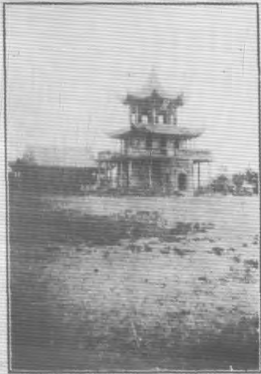
（二） 陝西西 安革命 公園之 革命亭