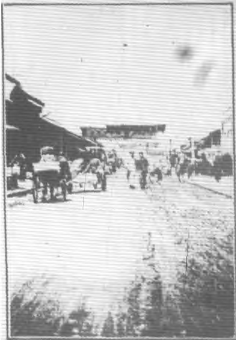
（三） 陝西西 安南大 街新修 貨棧之 一瞥