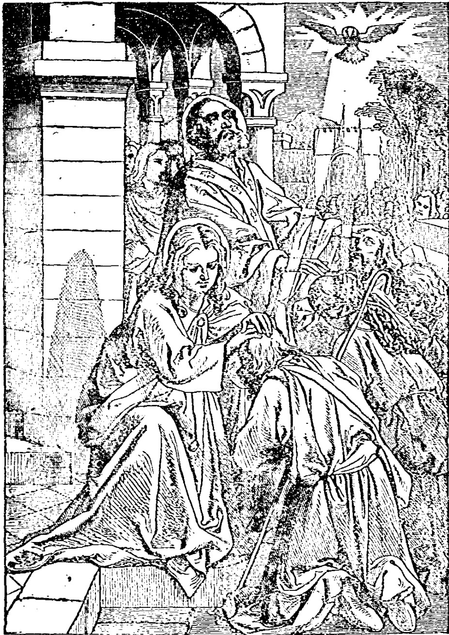
『。神聖受領們他叫，禱祈們他為就』 二一像（節五一章八宗）

他偉大 光輝的 工作。 不斷的 教訓啓 發公教 會，使 之忠誠 的宣傳 耶穌的 道理，