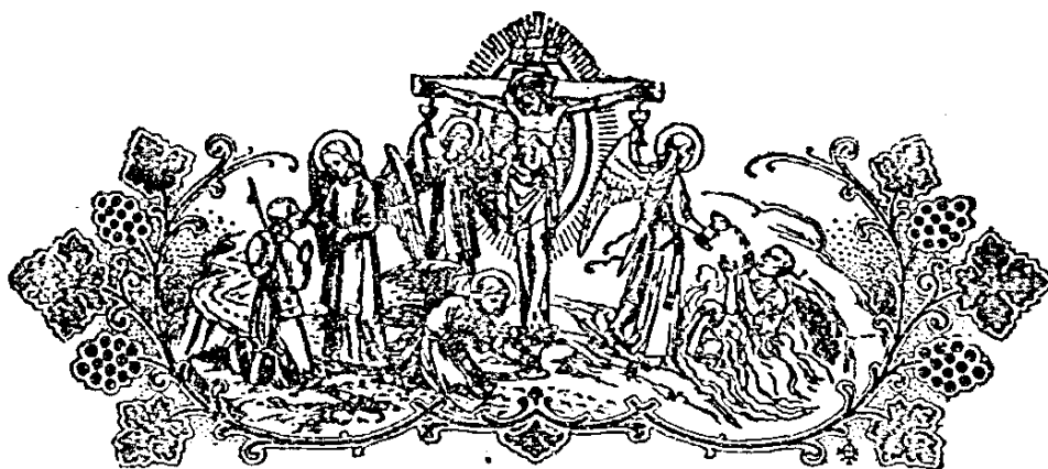
『天主這樣愛了人世，至於把他惟一子捨給他們。』