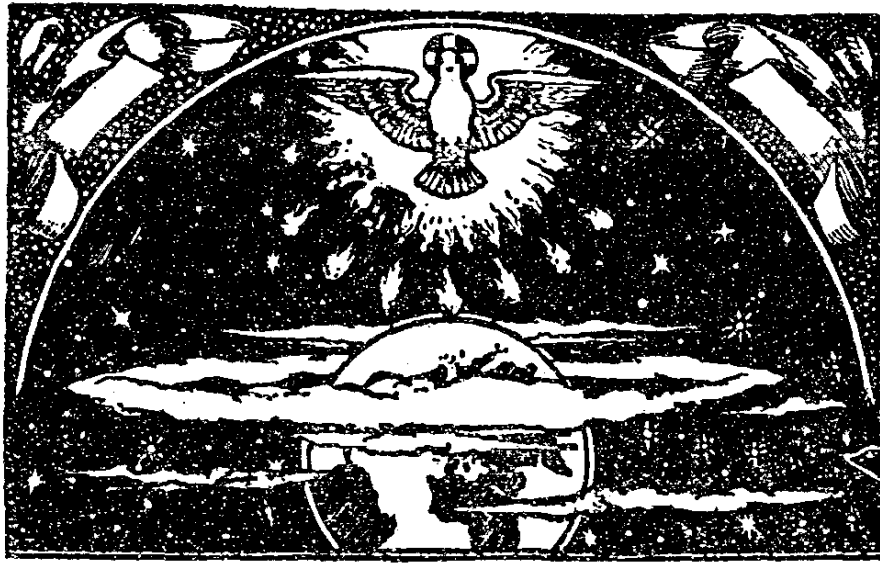
『起初天主創造天地，地是虛空混沌，淵面 黑，天主聖神在水面上運行。』 （創一章一至三節） 四像

。以人的眼光來看，地球原來已是很大，但若和太陽比較，不知還小多少倍呢。在無數的星辰中間，又有幾萬和太陽同樣大或更大的。從此可知由無中造出許多偉大物件的天主，應是怎樣的偉大了！（像四）