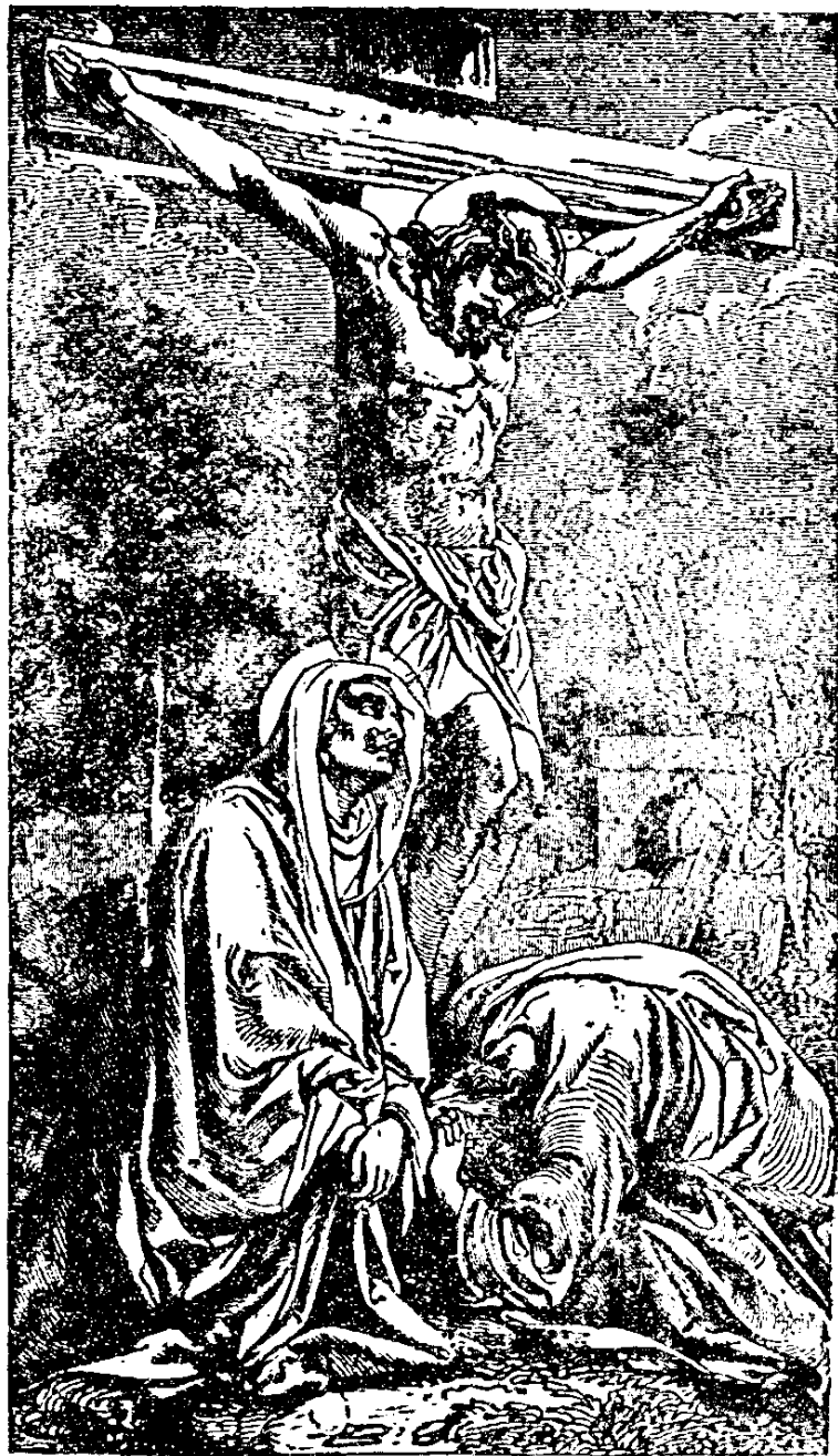
『。魂靈了付交，頭下低遂蘇耶』 ○一像 (節○三章九一若)

崩逝。 中懸掛了好幾小時。(像一○) 但是他的仇人還來譏笑他，直到他垂首 崩逝。 瓦略山上，耶穌被釘了！十字架豎立起來，於是耶穌在極疼痛的苦楚 中懸掛了好幾小時。(像一○) 但是他的仇人還來譏笑他，直到他垂首 崩逝。