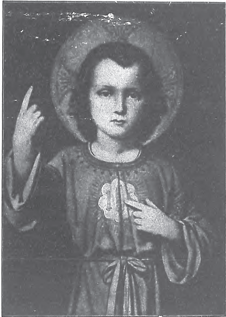
我 們 的 模 範 像 一