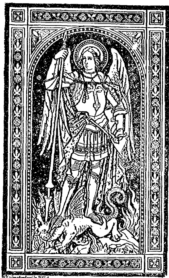
『誰敢與天主相比！』像五

二、但天主在未賞給天神預定的一種更大的說不出的永遠真福之前，就試探他們是否能始終謙遜，聽他的聖命。當試探的時候，果有許多天神和他們的領袖撒殫（就是魔鬼）背叛說：「我們將我們的寶座置於星辰上吧！我們要與至高無比的天主同尊共榮。」其餘的天神和他們的領袖聖彌額爾，就