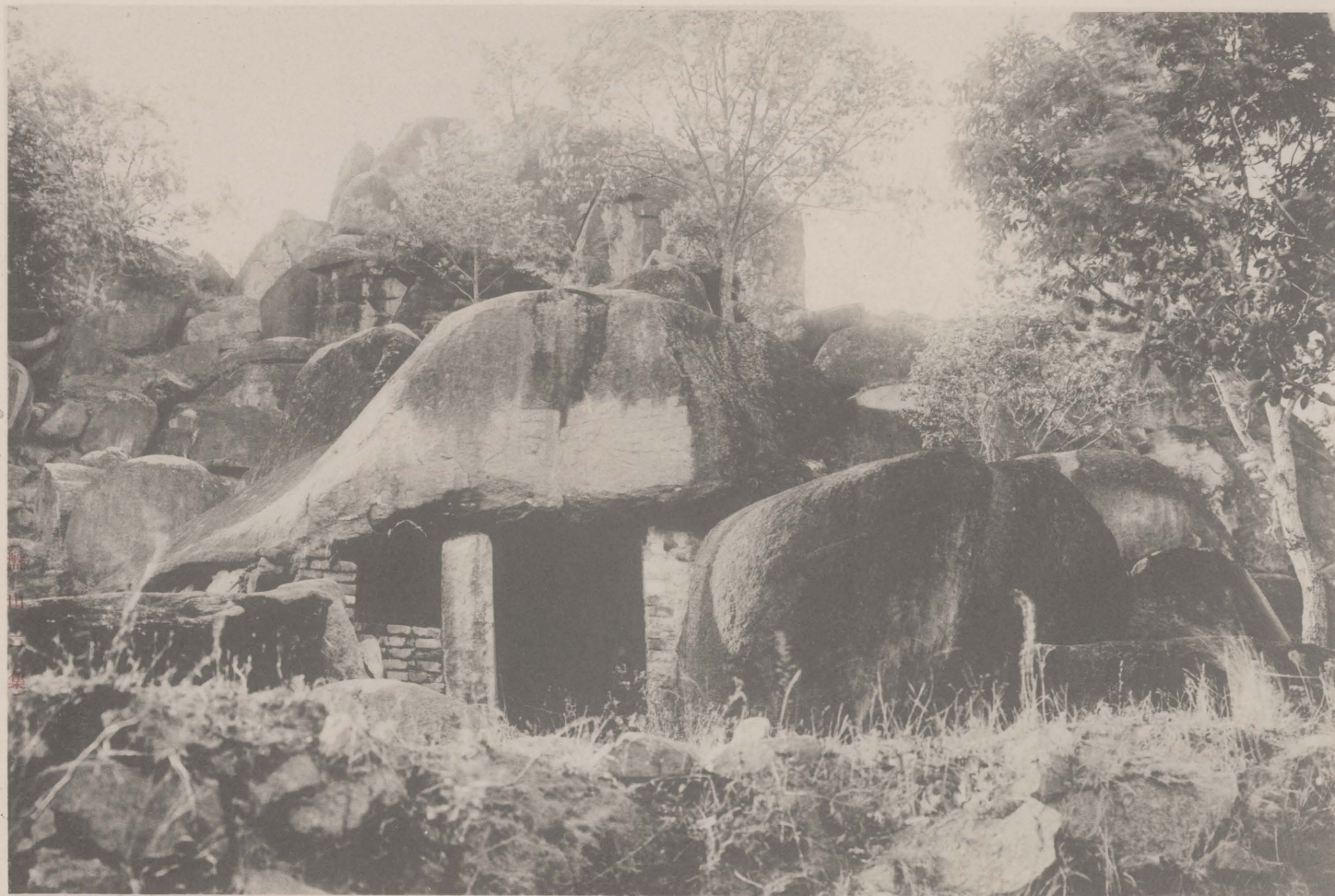
字三洞巖華鑄上門 成而架相 塊三石巨 洞巖華有 許里山登 上西林少自