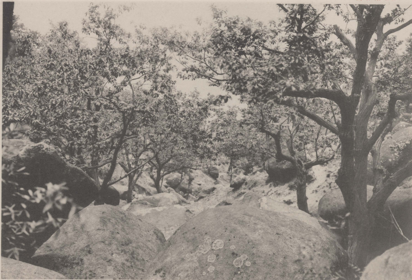
澗甘東爲者東在 澗甘西爲者西在 之隔山小一有 溝青於源發同 澗甘西與澗甘東