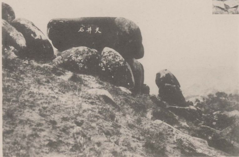
7. T'ien Ching Stone