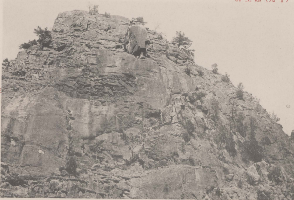
石空懸名 中空於懸如 傍依無四 立特石大有 處高壁右開門天