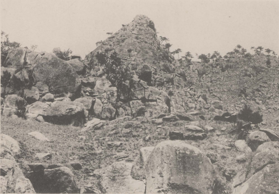
從南 天門 望掛 月峯 其 南有 一山 頭 酷似 彌勒 佛 俗名 大肚 彌勒 佛峯 腹部 一小 松 恰似 臍眼