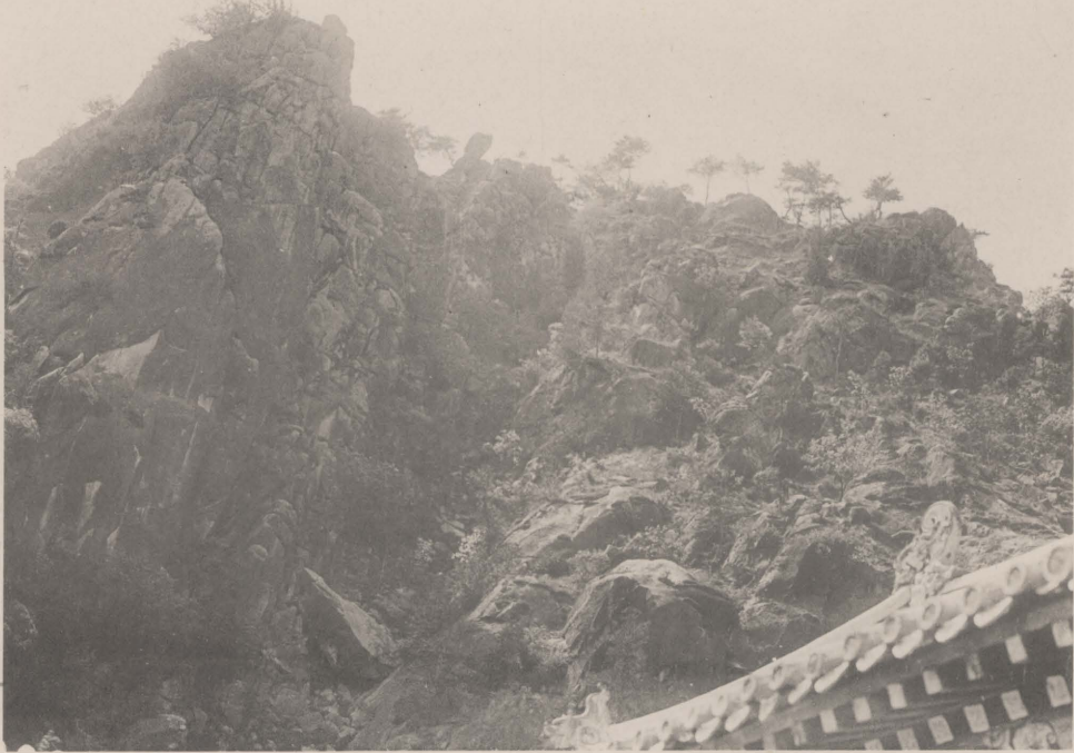
嶢礁望兒小名俗 石小有後峯 山主寺方上爲峯嶢礁