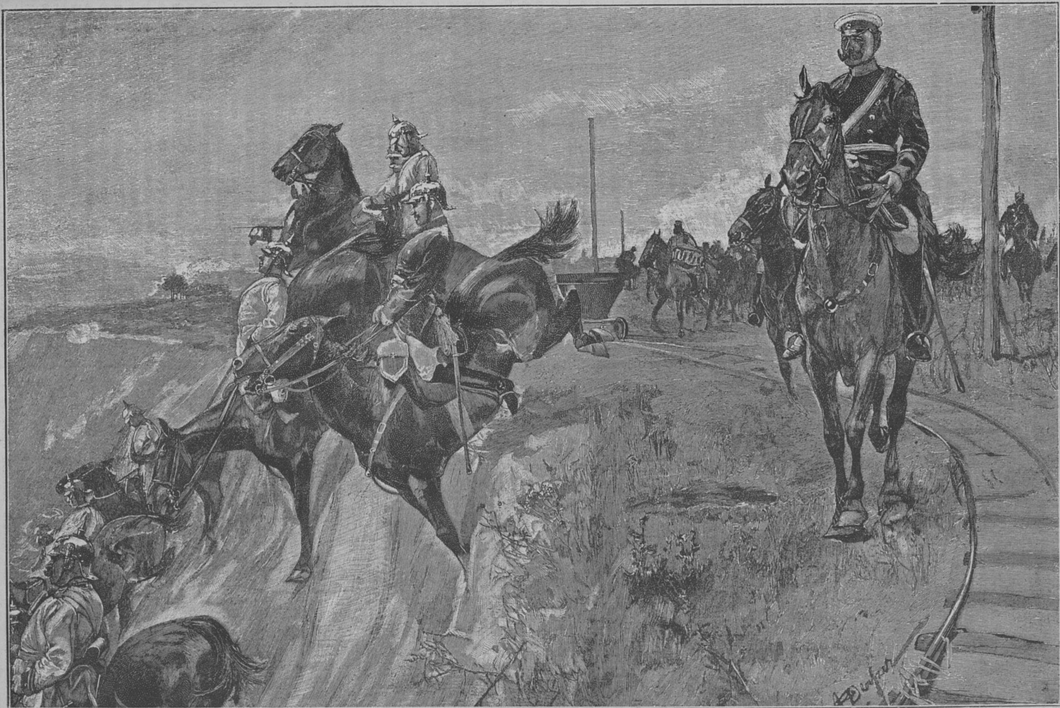
Спускъ рейнскихъ кирасиръ со ската въ 15 метровъ вышины (къ статьѣ «Верховая ѣзда германской кавалеріи на пересѣченной мѣстности»).