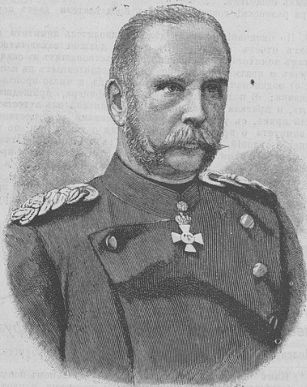
Генералъ-Лейтенантъ Генрихъ фонъ ГОСЛЕРЪ.