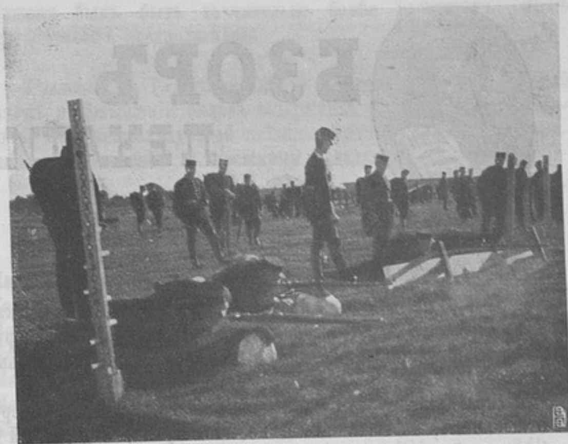
Шведская армія. Стрѣльба уменьшенными патронами въ боевой обстановкѣ. (Изъ полковыхъ сборовъ Королев. лейбъ-гренадерскаго п.).

серьезное вниманіе всѣ государства Европы, нашло твердую почву въ нашей арміи.