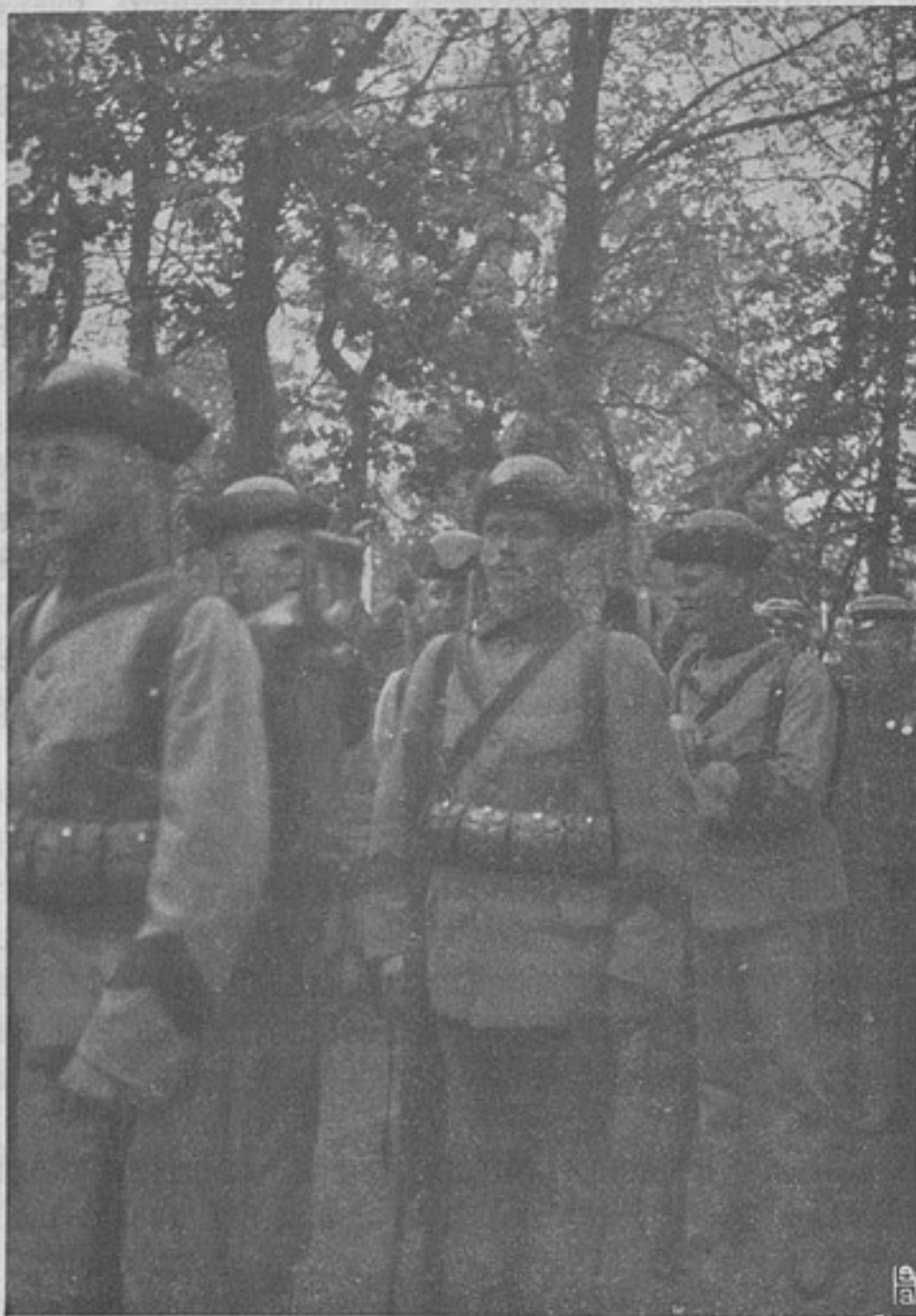
Шведская пѣхота въ новой походной формѣ.