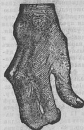
Исцѣленіе рукъ при хроническомъ суставномъ ревматизмѣ.

Высылаю каждому желающему пакетъ вѣрнаго средства противъ РЕВМАТИЗМА И ПОДАГРЫ.