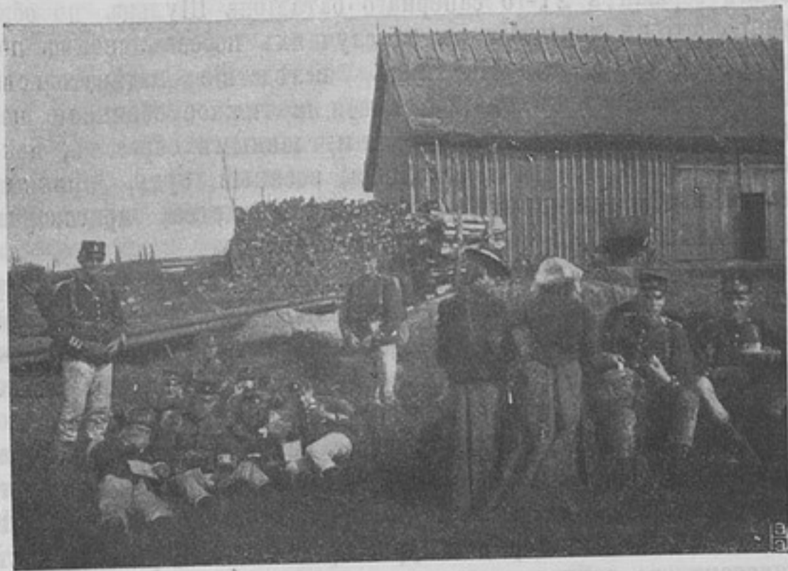
Шведская армія. Отдыхъ у стрѣльбища. Продавщицы кофе.

Такимъ образомъ этотъ рядъ мѣръ показываетъ, что физическое развитіе на которое въ настоящее время обратили