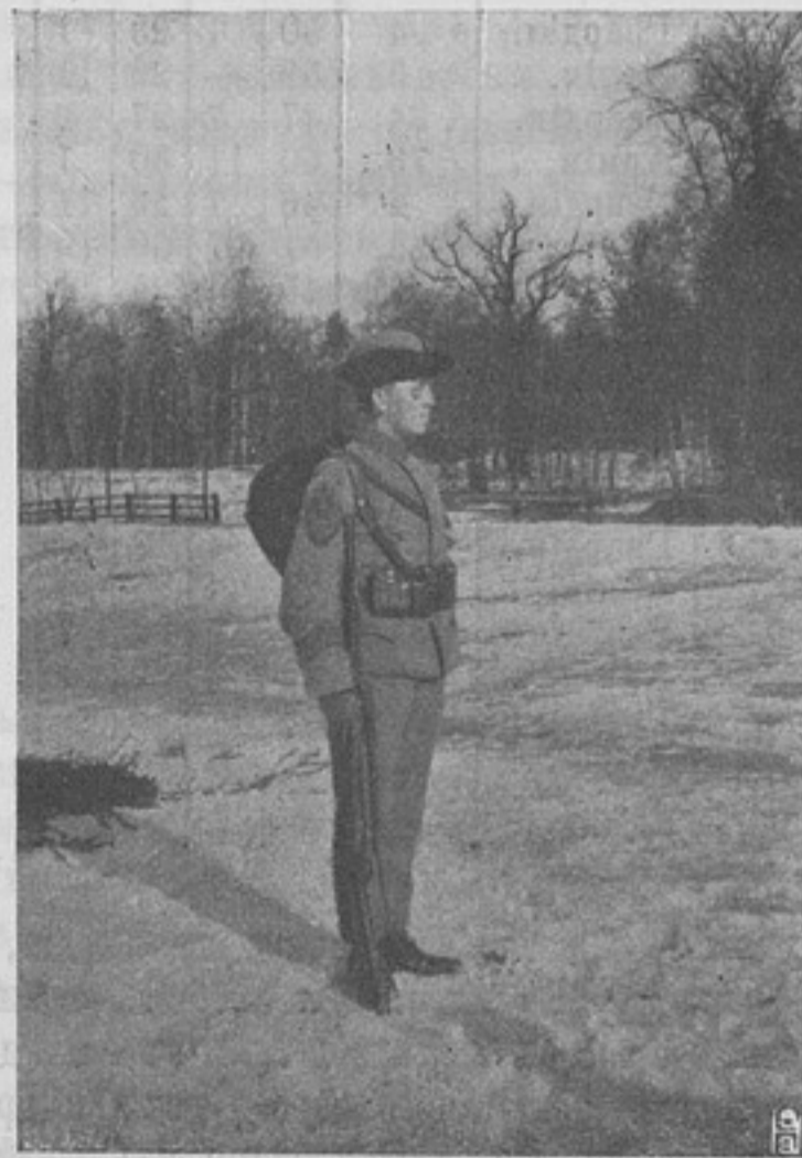
Шведскій вольноопредѣляющійся въ новой формѣ, съ нарукавнымъ знакомъ (знакъ этотъ, замѣнявшій погоны, въ послѣднее время отмѣненъ).

Вотъ, вкратцѣ, что могъ вынести изъ докладовъ. Конечно, есть еще болѣе важные вопросы и для другихъ темъ, такъ какъ военныя требованія громадны, горизонты ихъ безгра-