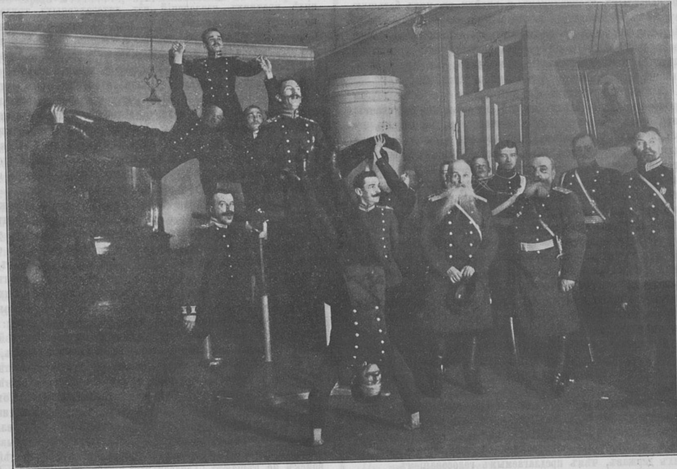
Смотръ Выборгскаго крѣпостнаго пѣхотнаго баталіона, произведенный 17-го и 18-го февраля 1910 г., помощникомъ Августѣйшаго Главнокомандующаго ген.-отъ-инф. Ашебергомъ. Гимнастическая пирамида г.г. офицеровъ на параллельныхъ брускахъ.

Г. Скугаревскій, ставя эти вопросы, однако упускаетъ изъ вида, что ни одна изъ пяти формулъ не исчерпываетъ въ полной мѣрѣ задачъ генеральнаго штаба: гдѣ, напимѣръ,