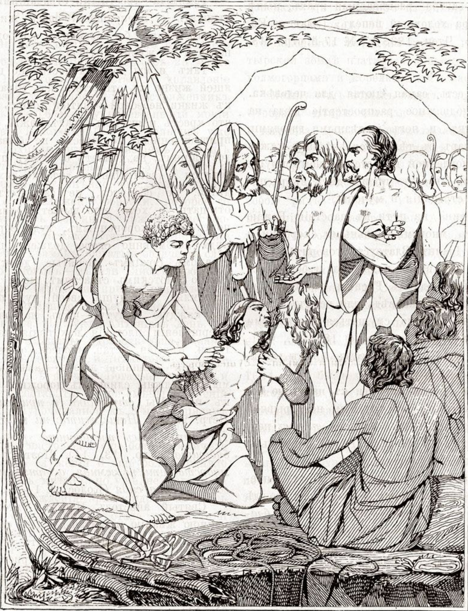
Братья продаютъ Іосифа.

богатство отнимается отъ насъ, мы должны благодушно и съ покорностію волѣ Божіей переносить это лишеніе, говоря вмѣстѣ съ праведнымъ Іовомъ: Господь даде, Господь отъятъ: яко Господеви изволися, тако бысть: буди имя Господне благословенно во вѣки (Іов. 1, 21). Хвалятъ-ли насъ и удостоиваютъ почестей, — намъ не должно самоуслаждаться, но принимать это со смиреніемъ, памятуя заповѣдь Спасителя: Болій въ васъ да будетъ яко мній, и старій, яко служай (Лк. 22, 26). О насъ разносятъ худую молву и осыпаютъ безчисленными злосло-