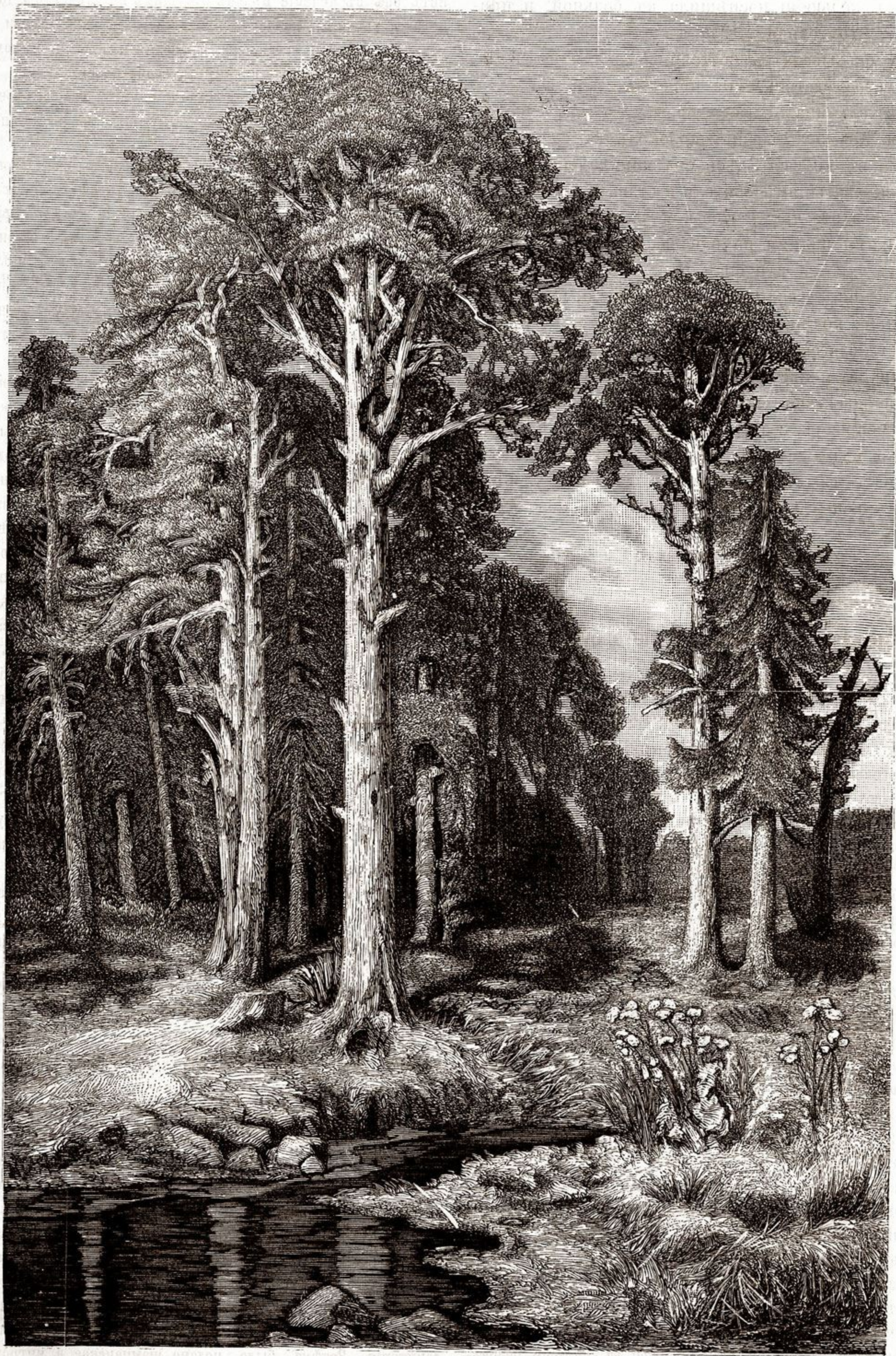
Въ монастырскомъ лѣсу