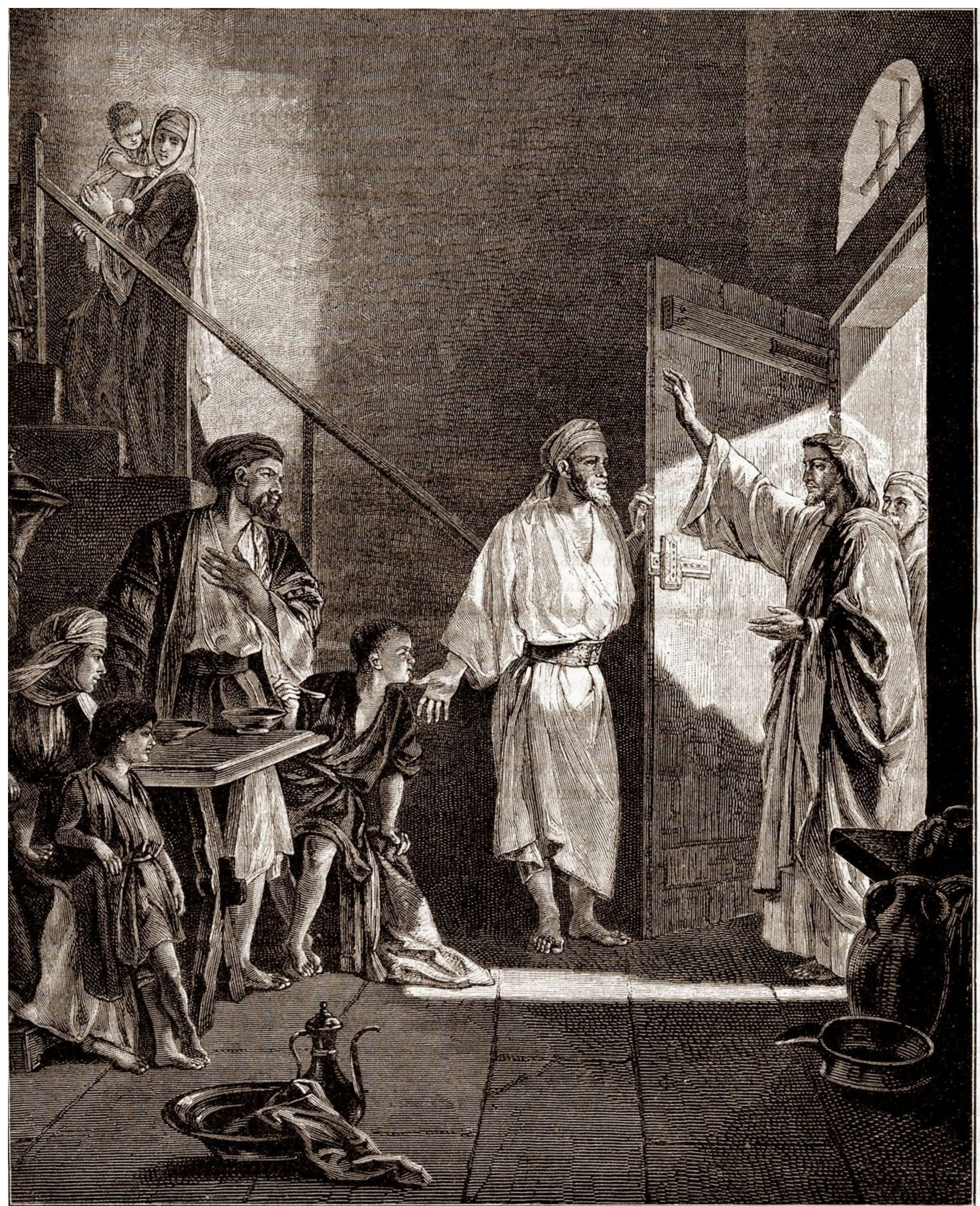
Христось приходитъ къ Симону.