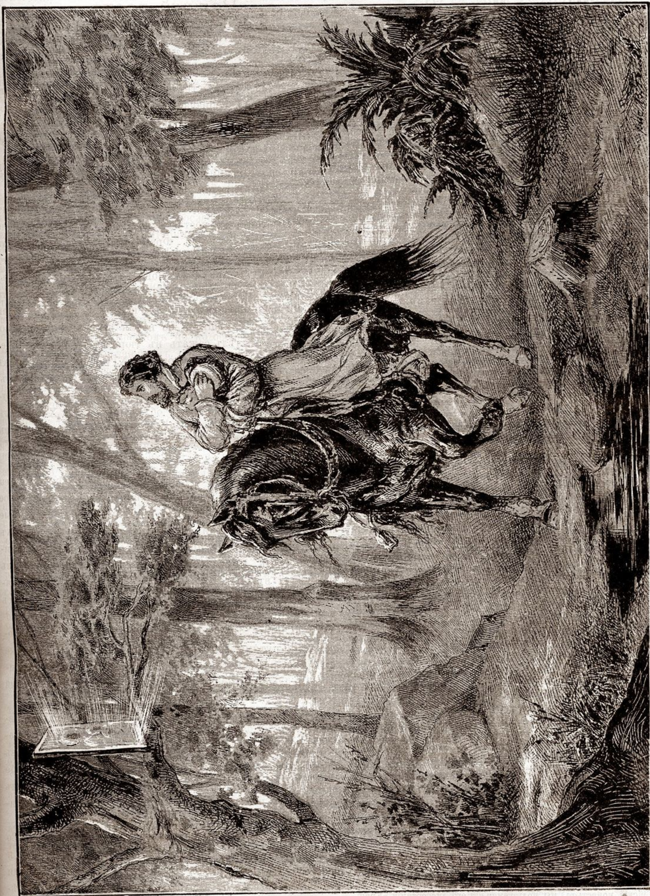
Обръщеніе Теодоровской иконы Божіей Матери. (Къ статьѣ на стран. 152—154).