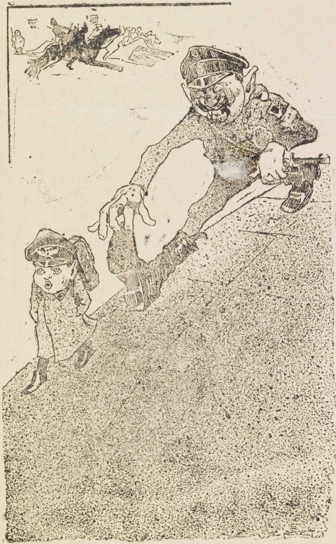
Предсѣдатель митинга выслѣженъ.