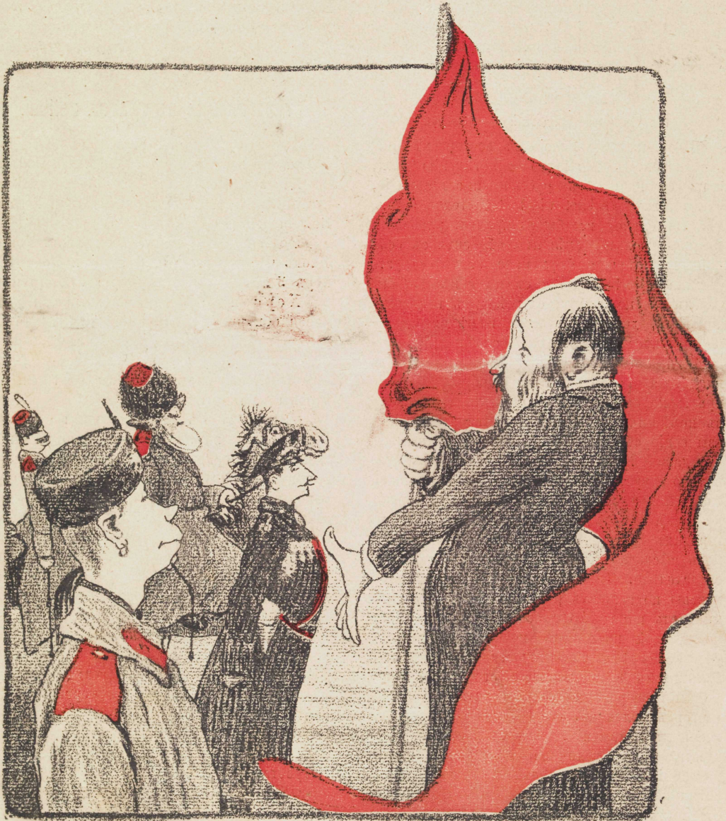
Рис. П. Троянского