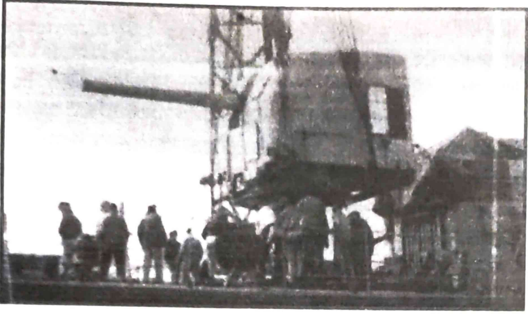
কলম্বিয়ান নৌ বাহিনীৰ ডেপুটীৰ কালডাছ : যাত্ৰাৰ আগমুহূৰ্তত

ছেৰো ডা লা পোপাৰ মূৰৰ ওপৰত আছে। মই কল্পনা কৰিলোঁ, হয়তো কাৰটাজেনাত কোনোবাই এতিয়া চাই আছে সপ্তৰ্ষিঁলে। মই চাই আছোঁ সমুদ্ৰৰ বুকুৰ পৰা। মই যেন এতিয়া আৰু নিসংগ নহয়। সমুদ্ৰৰ প্ৰথম ৰাতিটো আছিল বৰ দীঘলীয়া, কিয়নো সিদিনা একোৱেই নঘটিল। ঘটনাহীন সেই ৰাতিৰ বৰ্ণনা দিয়াটোও মোৰ সম্ভৱ নহয়। মোৰ ভয় হৈছিল কেৱল সাগৰীয় প্ৰাণীবোৰলৈ। হাতত কেৱল ঘড়ীৰ ডায়েলখন চিকমিক কৰিছে। প্ৰতি মিনিটৰ অন্তৰে অন্তৰে মই ঘড়ীটোলৈ চাইছোঁ। ফেব্ৰুৱাৰীৰ ২৮ তাৰিখ। সমুদ্ৰত মোৰ প্ৰথম ৰাতি। প্ৰতিজ্ঞা কৰিলোঁ আৰু ঘড়ী নাচাওঁ। ঘড়ীটো জেপত ভৰাই থ'ম— যাতে সময়ৰ ওপৰত অধিক নিৰ্ভৰশীল হ'বলগীয়া নহয়। ন বাজিবলৈ কুৰি মিনিট থকালৈ মই নিজক ধৈৰ্য ধৰি ৰাখিলোঁ, তেতিয়া মোৰ ভোক-পিয়াহৰ অনুভৱ অহা নাই। মই মনটো বান্ধি ল'লোঁ— পাৰিম, নিশ্চয় পাৰিম, পিছদিনা পুৱাই বিমান আহি পাব। কিন্তু ঘড়ীটোৱে যেন মোক পাগল কৰি দিব। বৰং এইটো সাগৰৰ পানীত দলিয়াই দিয়াই ভাল হ'ব। কিন্তু হঠাৎ ভয় হ'ল— ঘড়ীটো অবিহনে মই আৰু অধিক নিসংগ হৈ পৰিম। পুনৰ মণিবন্ধনত ঘড়ীটো পিন্ধি ল'লোঁ। পুনৰ মই চাবলৈ ধৰিলোঁ ঘড়ীৰ কাঁটালৈ, প্ৰতি মিনিটৰ অন্তৰে অন্তৰে। মাজে মাজে দিগন্তলৈ দৃষ্টি দিলোঁ বিমানৰ আশাত। মই চাই ব'লোঁ চকু নিবিষোৱাপৰ্যন্ত।