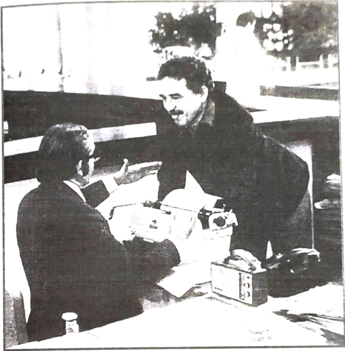
এল প্ৰছপেক্টাডৰ কাৰ্যালয়ত সম্পাদকৰ সৈতে সাংবাদিক মাৰ্কে'জ

ডাঙৰ চকু দুটাৰে ভয়াৰ্ত দৃষ্টিৰে মোলৈ কিছুপৰ চাই থাকিল।