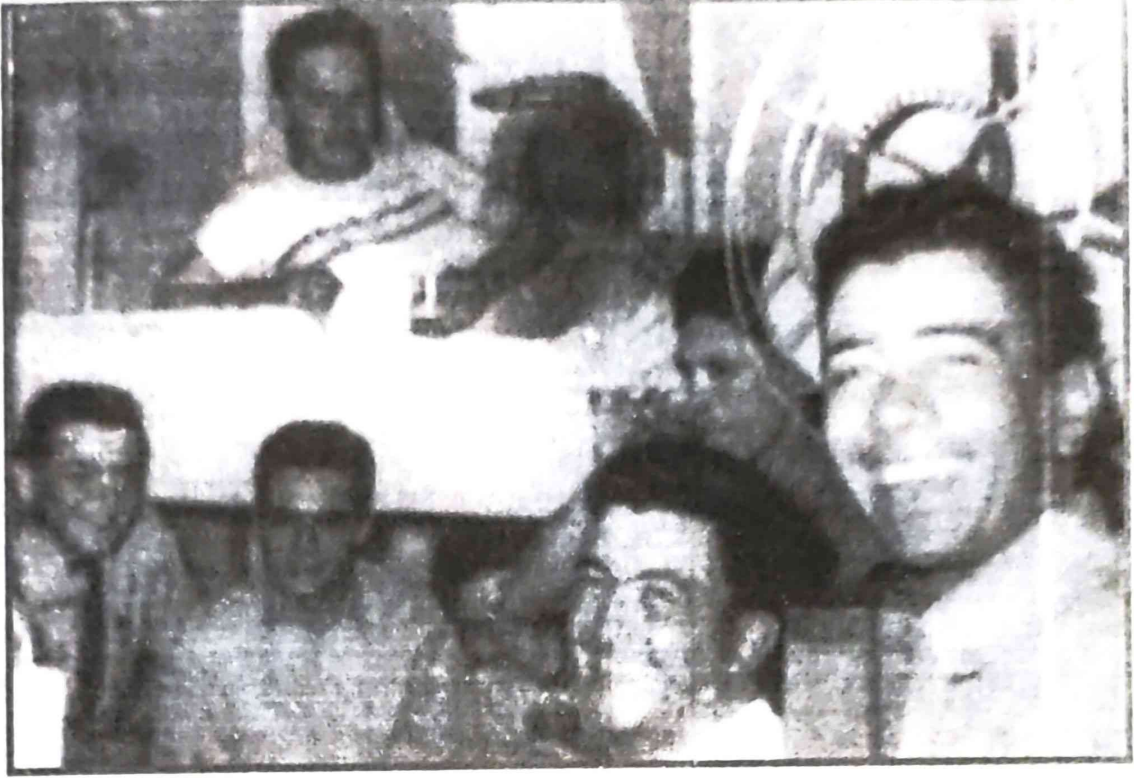
বাংকত অৱসৰৰ মুহূৰ্তত সতীৰ্থৰে সৈতে ভেলাস্কা