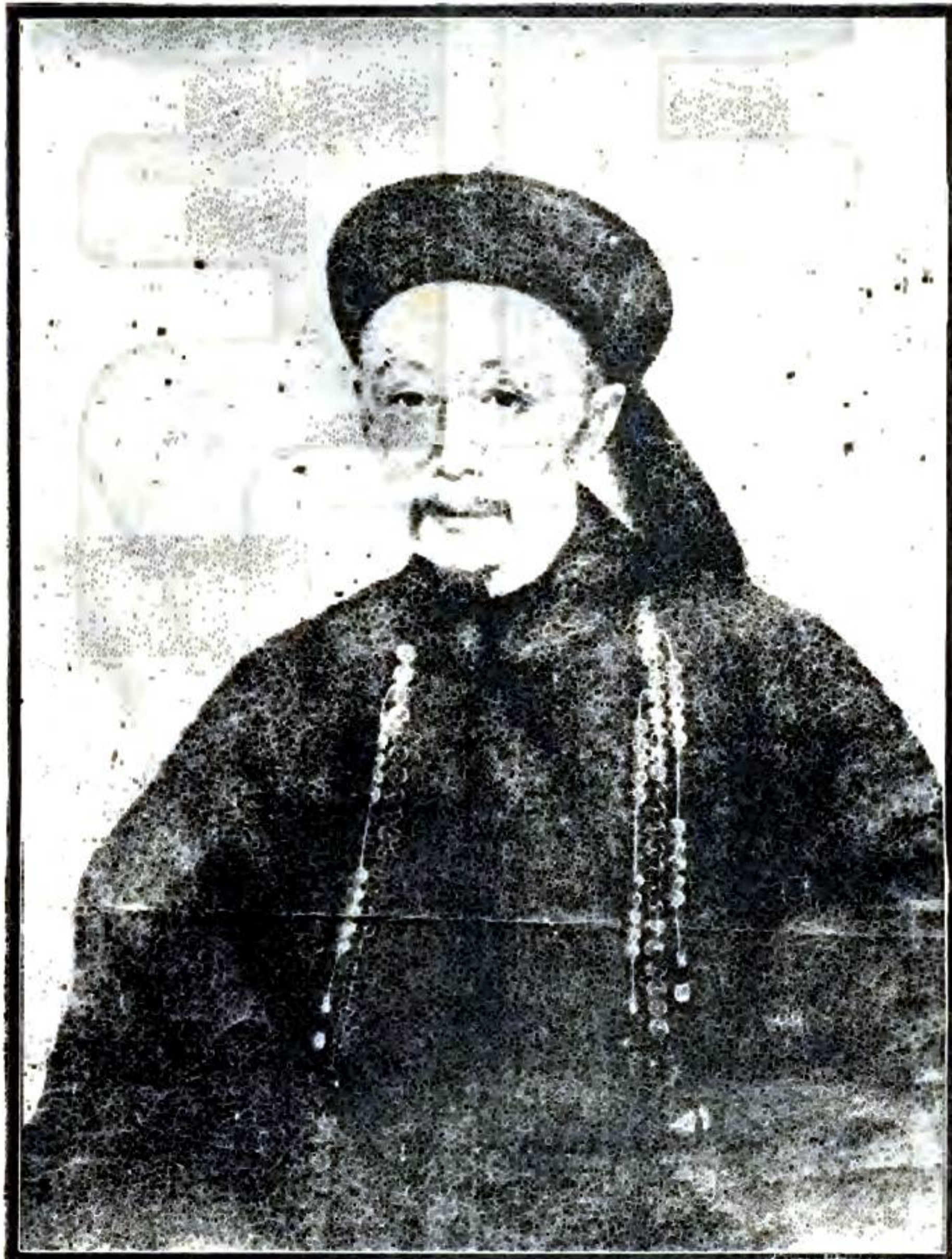
光緒丁未孫男鐸敬謹付印

清乃神定乃天 耶勞乃身禿乃 顛耶乃必鬍而 牽驚不驚耶乃 昔美而文骨則 堅耶乃若藪有 麟而螻弗仲耶 乃若齷有罇而 鐸則宣耶冠耶 紳耶貞不絕俗 之仙耶 光緒壬午因是 翁自題時年六 十有二