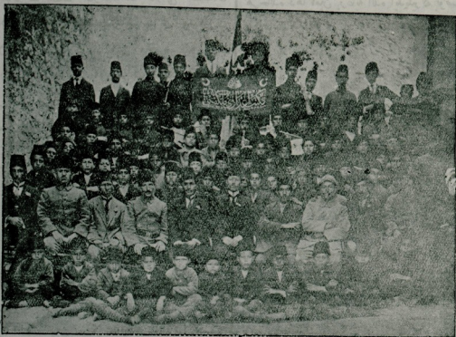
ماردیسه مکتب اعدادی هیئت اواره و تعلیمی سید کور بوزاری

صیجاق و صؤوقده و یورویش ائشانسده نصل حرکت ایدیله چیکی و یشلرک نه صورتله محافظه ایدلسی لازمکه چیکی حقتده و صایاده بولنلمشدر . کنجلا آره سنده دیشلرینک محافظه سی ایچون واسطه دن محروم اولانلره و یاخود ( خسته سندقلرنده ) حاضر و سائلطی بولنمایانلره لازم کلان معاونت پایله بیلمشدر . بواغورده ( مکتب دیش قلیققرنی ) بعض شرائط ایله امرمزه آماده قیلدق