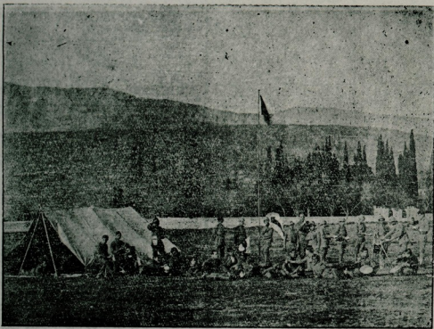
آیویه ولایتی رهبر عمومسی محمد نوری بك اداره سنده کنج درنگری تعلیم و تطبیقاندیری ( استراحت حالده ک کوردوزلردن برغروب )

بورویشلرده قاعده عمومه اوله رق آرقه ده طائینه جق اشیانك تقابلی وجوده متسادیاً تقسیم ایدیله آرقه چانطه سی اوموزك یا لکنز برنده قایشنرایله طائیشیق طوغری اولمایوب وجودك آکری طور مسنه وعمود فقرینك چاریلمسنه سبب اولور . بعض عسکری مسائلك حلنه ابراث مضرت ایتمدیکي تقدیرده روزکاره وفورطنه به قارش ی بورویش یایعقدن اجتناب ایدملی و بورویشلرده یاییله جق استراحت