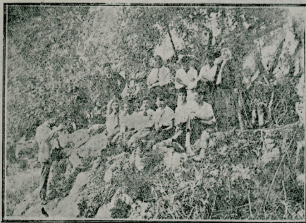
( انطالیه معارف مدبری عیاده کامل بک )

صورت اجراسی نقطه نظرندن تحلیل : ممارسات تحلیلیه لری بدی باشندن کوجوک چوجوقله یابدیرمق جائز دکدر . اونلرک عضلاتی تقلصات توازنیه وقوایی بی حصوله کنیره جک قدر قوی دکدر . اونلرده حرکتلر دوزلیتیجی * دوغرو لیتیجی اولمقدن زیاده ایشله تیجی * اکلندیریمیجی برماهیتده اولسی یعنی ترکیبی اولسی ده موافقدر . بناء علیه منقح اولمایان اساس وضعیتلردن محروم اولان حرکاتک بک کوجوک باشندن چوجوقله