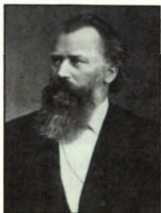
Johannes Brahms (1833-1846) Pianotrio nr 3 in C opus 101

Het werk voor kamermuziek van Brahms bevat 24 opusnummers. Dit is slechts één vierde van zijn totale produktie; uit zijn briefwisseling weten we immers dat hij zeer veel zelf vernietigd heeft omdat hij uiterst kritisch was.