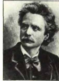
EDVARD GRIEG (1843-1907)