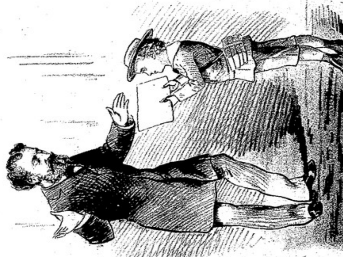
-Pape, ahora que hace su Zérame a la esquina de ES. MEGALOPOLY Y PIEDAD es la de SARRAILHE 122 se venden muy lindos Paños de invierno para niños.