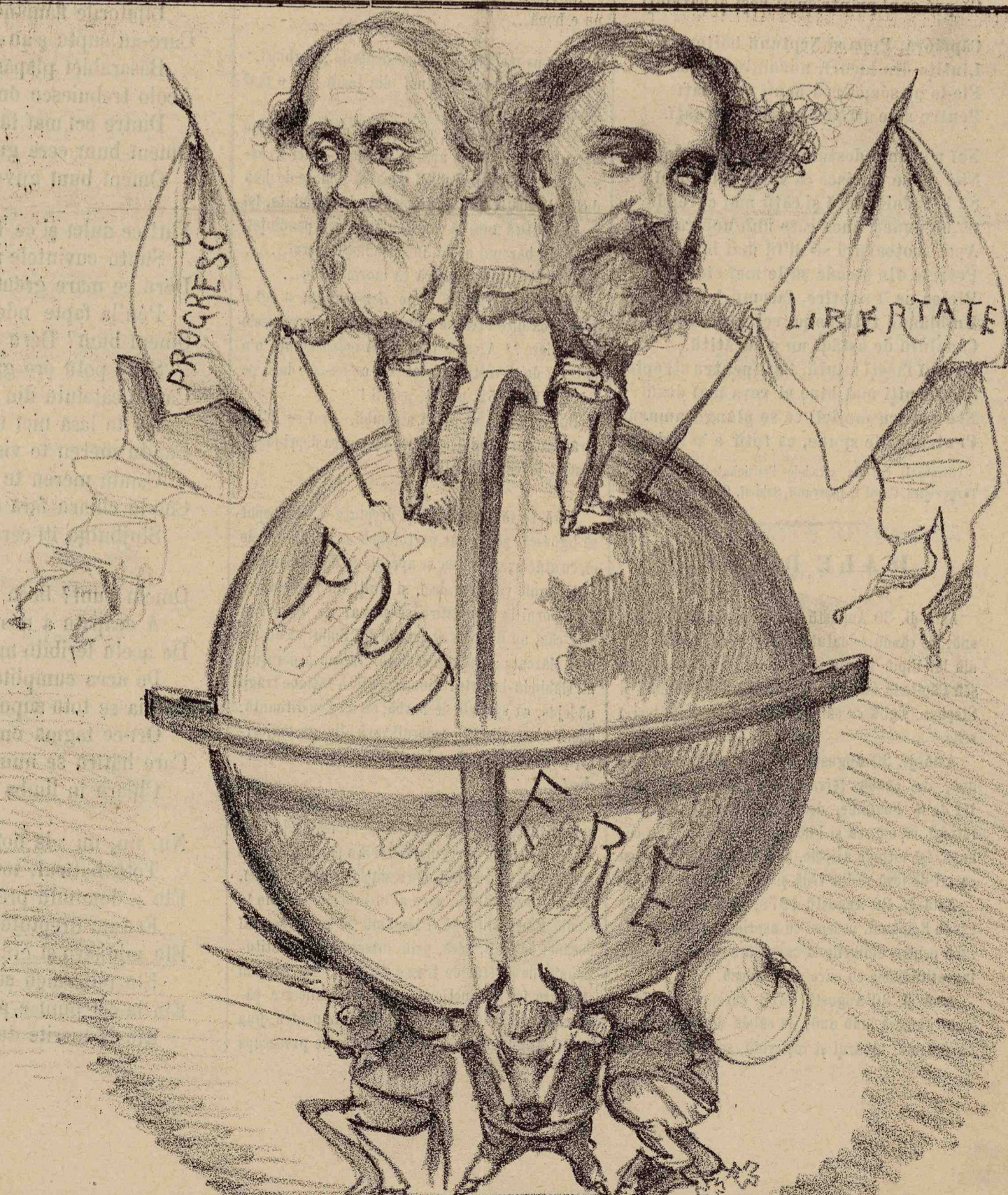
Cei setoși de putere suntū sdrobiți de ia, de și cată sē rāstorne pe cei ce stāū pē ia! Greutate mare nu e, de ōre ce e rotundă!...

— Diarulū apare de donē ori pe sēptāmānă. — Redactore, KIO-PEC. — Administratore, Constantin Petrescu-C. —