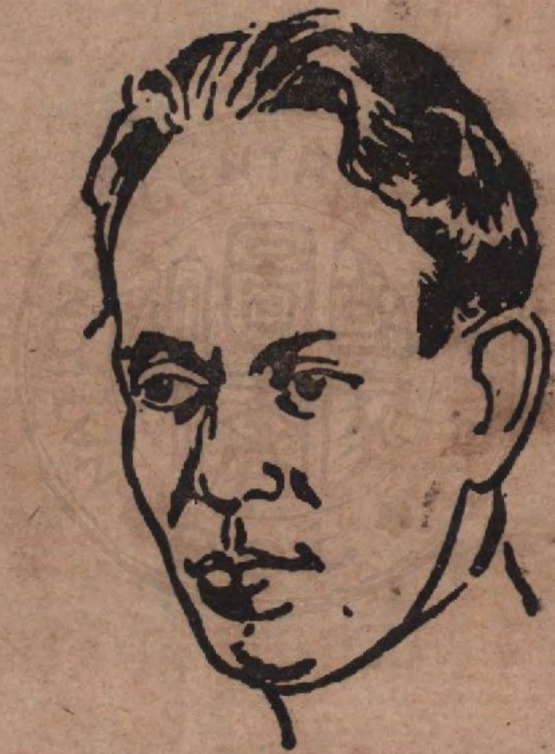
蕭 洛 霍 夫 畫 像