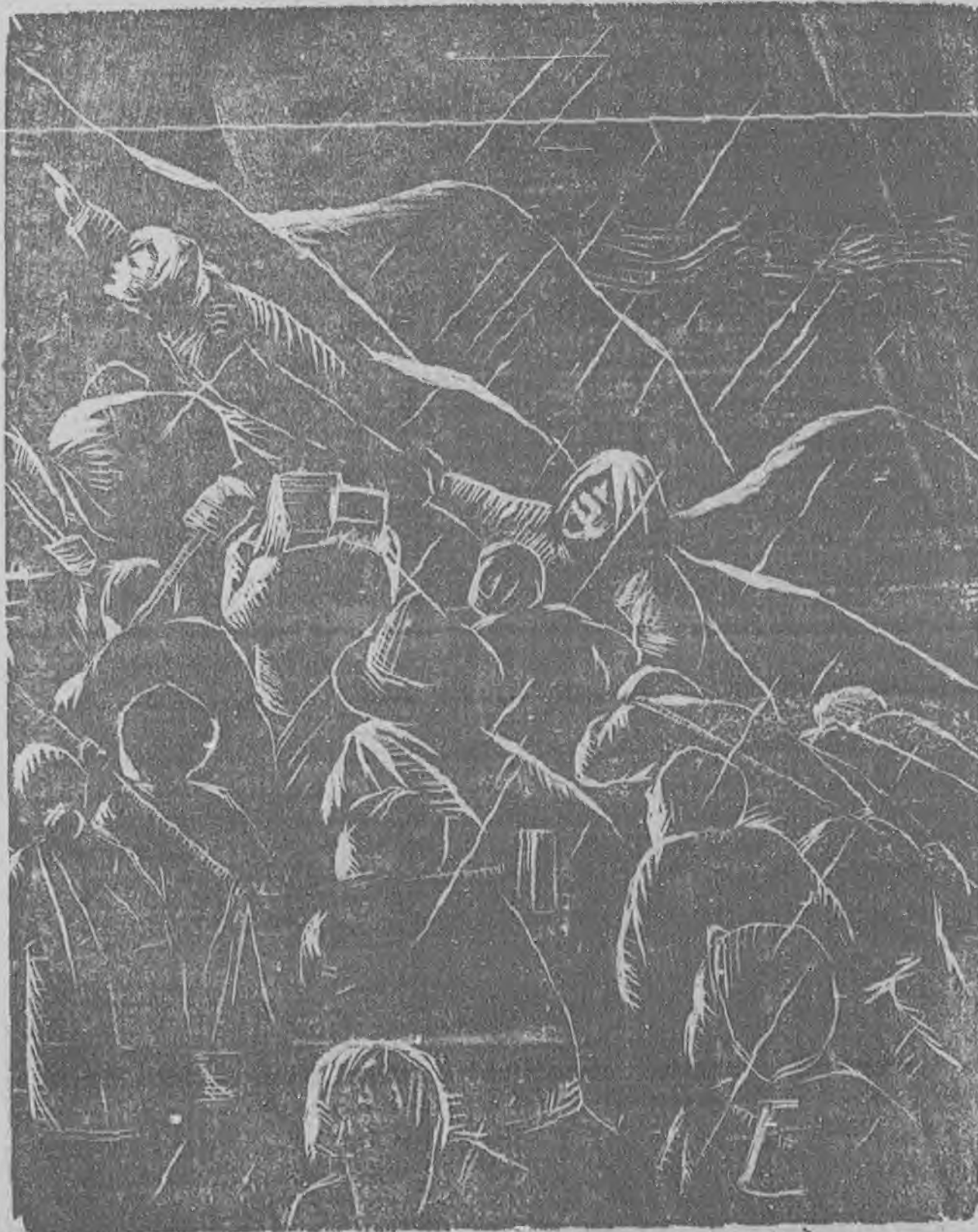
李思春作 歸 除 (刻本)

曲，從收藏我國古畫，而到歡迎我國到各國展覽藝術作品，而影響歐洲的畫脫了照像式的塗抹。說不定在若干年後，還會領略到我國字態的美，更說不定還要在西畫也要蓋一個中國式的圖章哩？