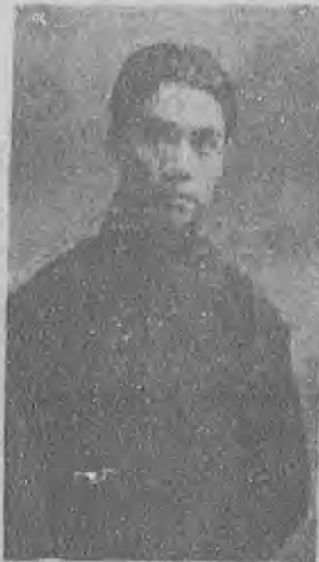
昆且馬祥麟之便裝

第二天居然還沒有足，這事兒，就透着邪怪，當然，出在大偉人家不算什麼，人家過半個月就可以酬朋友，不家，再說，又是冬天，難道大家宅那裏有那末些床被褥？不是嗎？