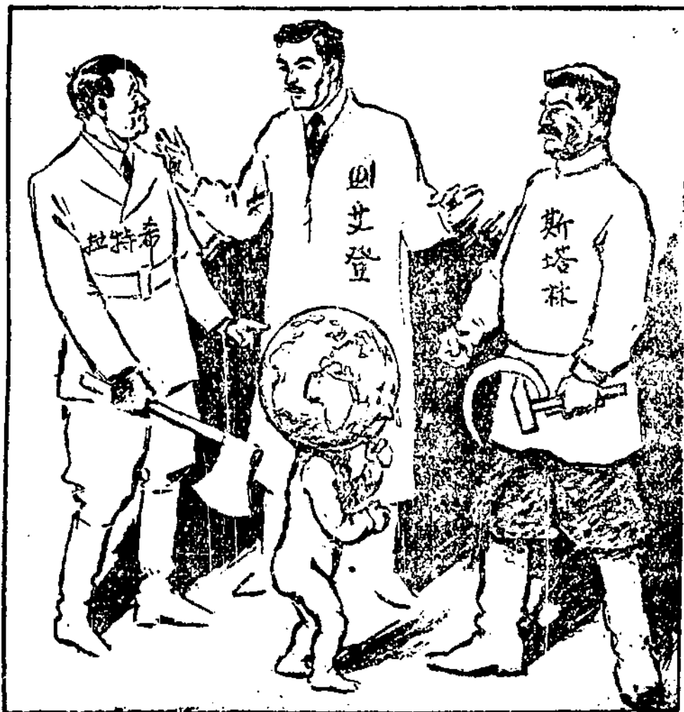
英國的 判決： 很抱歉 ，我不 能讓你 們將此 可憐的 孩子劈 分爲二