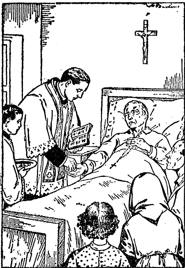
終 傅 聖 事