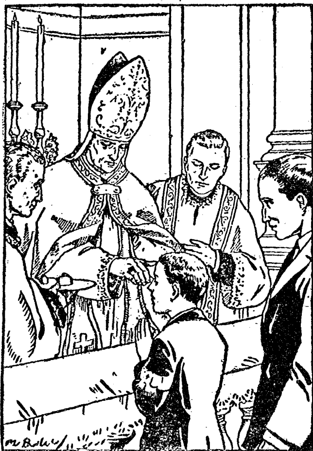
事 聖 振 堅