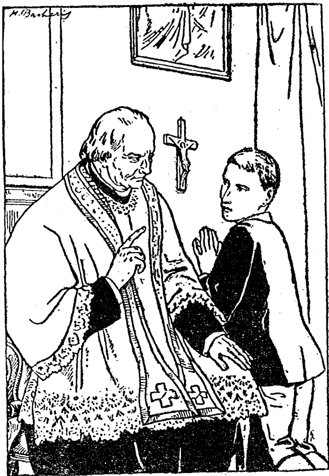
告 解 聖 事