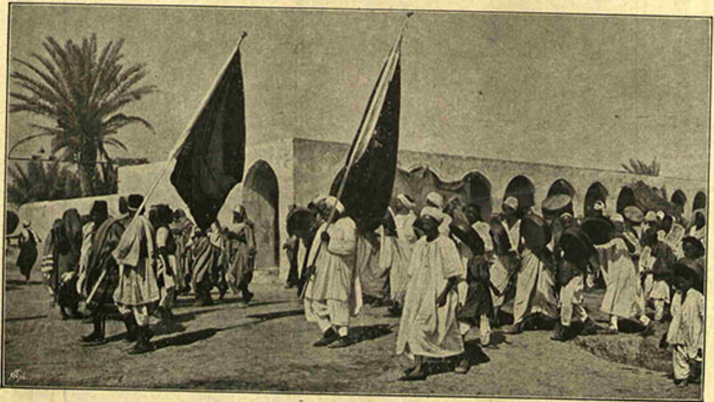
[ طرابلس غرب مناظرندن : اهالی مملکتک ایام مقدسه ده اعلان شادمانی ایلمسی ]