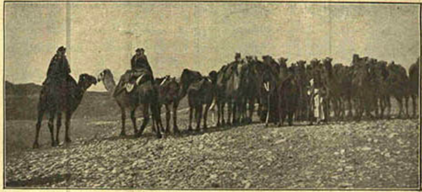
[ صحرای کبیر سیاحتی : چوله بر کاربان ]

ساعت اونده نقیه یوسفک دعوتنه اجابه مهماندار بولداشلمرمله او طرفه طوغری آغیر آغیر ایله مکّه باشلادق . مومی الیه بزی اوزاقدن کورنججه آرقه سنده حاکمک ایکی یاوردی و بونلرک آرقه زنده دیگر خدمه و کوله لر اولدینی حالدده استقبالمزه یورودی . ایکی طرف یولک اورتیه سنده تلاقی ایده رک مراسم و تعبیرات معناده صرف ایلدلکدن صکره هپ برلکده بزم ایچون تهیه ایلمش اولان چادره طوغرلقدق . چادریک درونی حالیلرله دوشنمش و محیط داخلی بیویجه مندر و یاصدقلر دیزلمش اولدقدن بشقه ققیه یوسف صباحلین بزه کلدیکی زمان بنم صندالیه اوزرنده اوطور . دیغنی کورمش ایکن صکره صندالیه بی کندیسنه اکرام ایلدیکمدن بوکا قارش بر جیلده بولتی آرزوسنه . یاخود بره اوطورر ایسه م راحت ایتم ملاحظه سنه ، حاصلی هرزه فکره منی ایسه برکوشه یاننده کی اشیا دن قانابه می برر حاضر لایتمش و اوزرنی ال کوزل حالیلرله اورتیه رک یوشاق و تمیز یاصدقلرله ده تزیین ایتمش . ایدی . بن یالکز باشمه بو صدر مفخرته کچوب اوطورمقدن استحیا واستنکافی ایله هرکس کی برده کی مندرلردن برینه چوکمک ایستدم ایسه ده حاضرین ممکن دکل قبول ایتمیه رک یینلرله ، آندلرله معالقا اوریاه اوطورمه می تکلیف ایستیلر و بو عاجزی آره لرند کوردکجه خلیفه اسلامک بر کواکمی دائمیا اوزرلرنده بوندینی حسن ایستکلرینی ، بوکواکمی اللرندن کلدیکی قدر حرمت و رعایت ایتمک کندیلرینه فرض اولدینی سویلدیلر . ناچار قانابه اوطوردم ؛