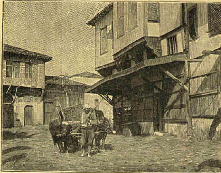
[ بالیکسر مناظرندن : بر سوقاق ]

Une rue de Balikessa, ville éprouvée par les derniers tremblements de terre.