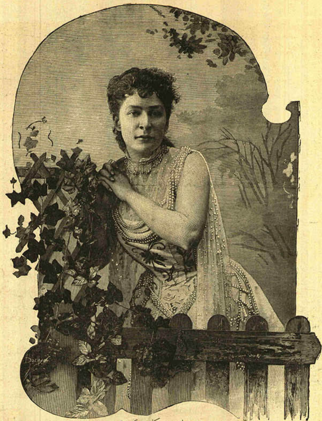
[ بر لوحه : بکھرکن ]

بزرگه نك اونده كي مسامره لره ، سلاجي فوسته قالدك دكاننده كي آو مجالسه ، جزايرده كنديسني تعقيب ايچون مسالط اولان دوهيه ؛ ايكنجيسنده ، ريگي طانغي مسافر خانه سنده جريان ايدن وقوعاته . اسويچره ضابطه سي طرفندن تارتارنك حبسيه نتيجه ياب اولان سهوه دائر حقيقه لري اشارتاه قناعت ايدلم .