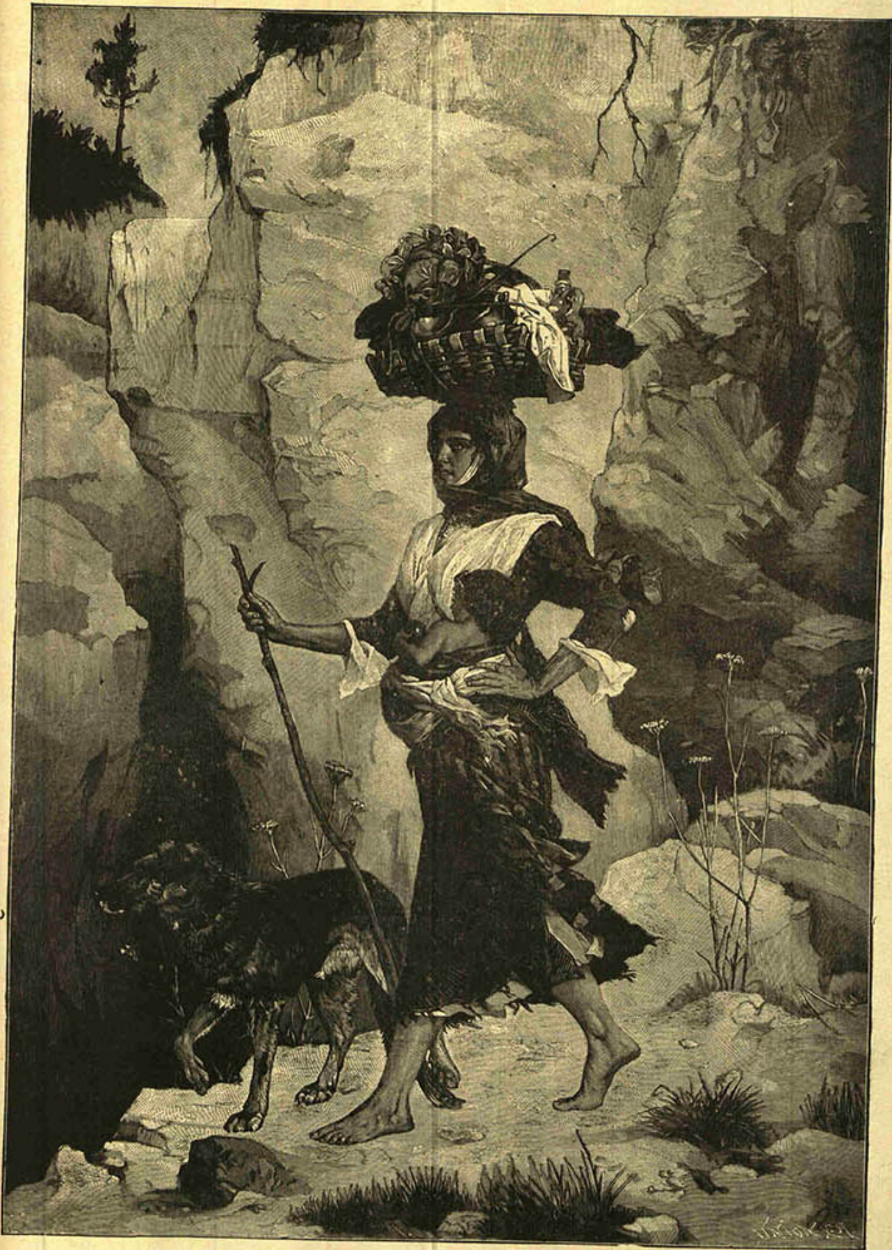
[ صنایع نفیسه‌دن تابلو : بدوی والده ]