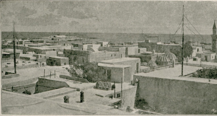
[ طرابلس غربك منظره عموميه می ]