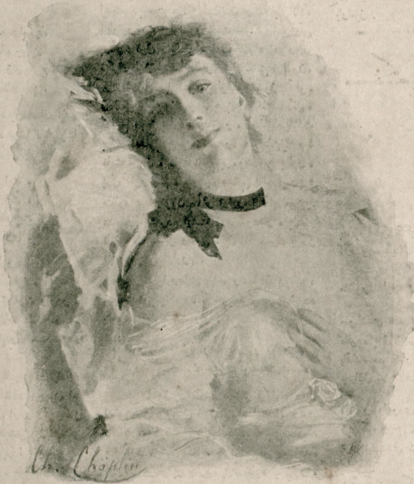
[ لوحه : بائین ]