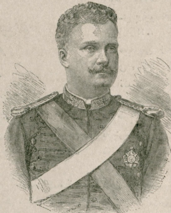
[ پورتکیز قرالی برنجی شارل حضرت تاری ]

ساعت اوانده حرکت ایدلی . ساعت التیده حرارت کولکده یکرمی بش ، کونشده اوتوزاییک درجه ایدی . یاربم ساعت ظرفنده اوکله طعمانی تناول ایتدکن صکره یوله دوام واون بش ساعتک مسافه قطع ایدرک اقسام ساعت بر یقده قوندق .