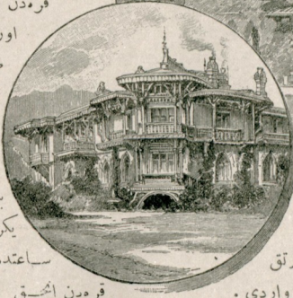
جاولجئنده [ قریمدیلوادیاده روسیه حکمدارانسه مخصوص دآرملر ]

جوللاری کیچی دوه ایله کیچی ماشیا قفیع وطی ایدرلر . حج ایتمدکن صکرده عینی صورته مملکتلرینه دوزلر . ازجه بوسنه طرابلس غریدن ایکی یوز حاجی قرمده بنغازی به کله رك اورادن ینسه چول طر یقیله حجاز مغفرت طرازه متوجه اولمشلر- دره طرابلسدن بنغازی به واپورله یکرمی بش او توز ساعتمده کلندیکی حاله