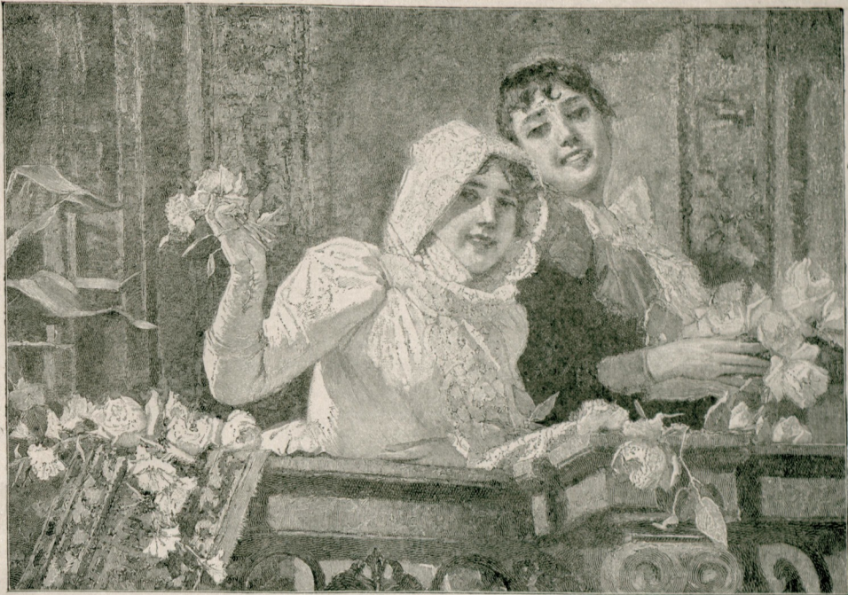
[ ۱۱۵ نجی صیغه منظومہ واردر ]