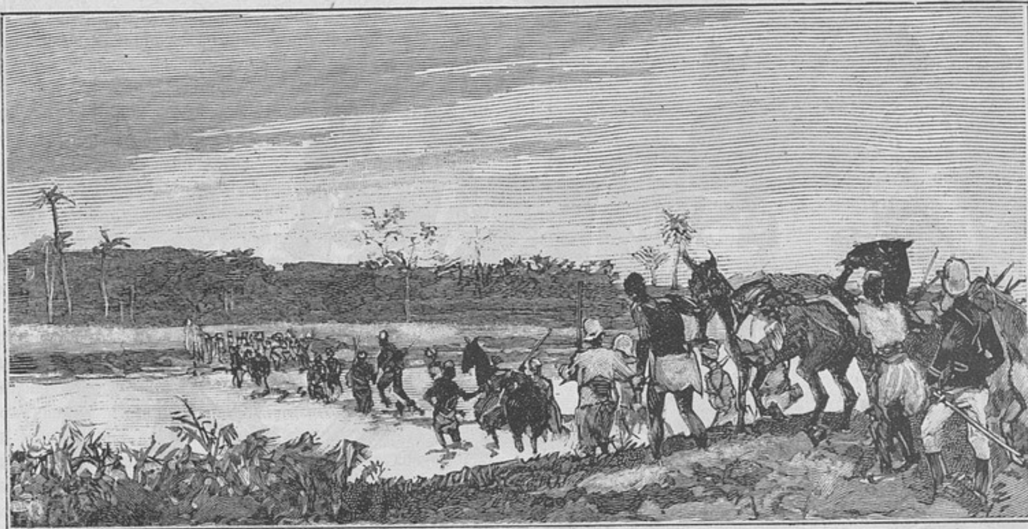
Переправа носильщиковъ и вьючныхъ муловъ черезъ р. Кото.

Съ паденіемъ Каны въ сущности можно считать экспедицію оконченной, такъ какъ этимъ нанесенъ смертельный