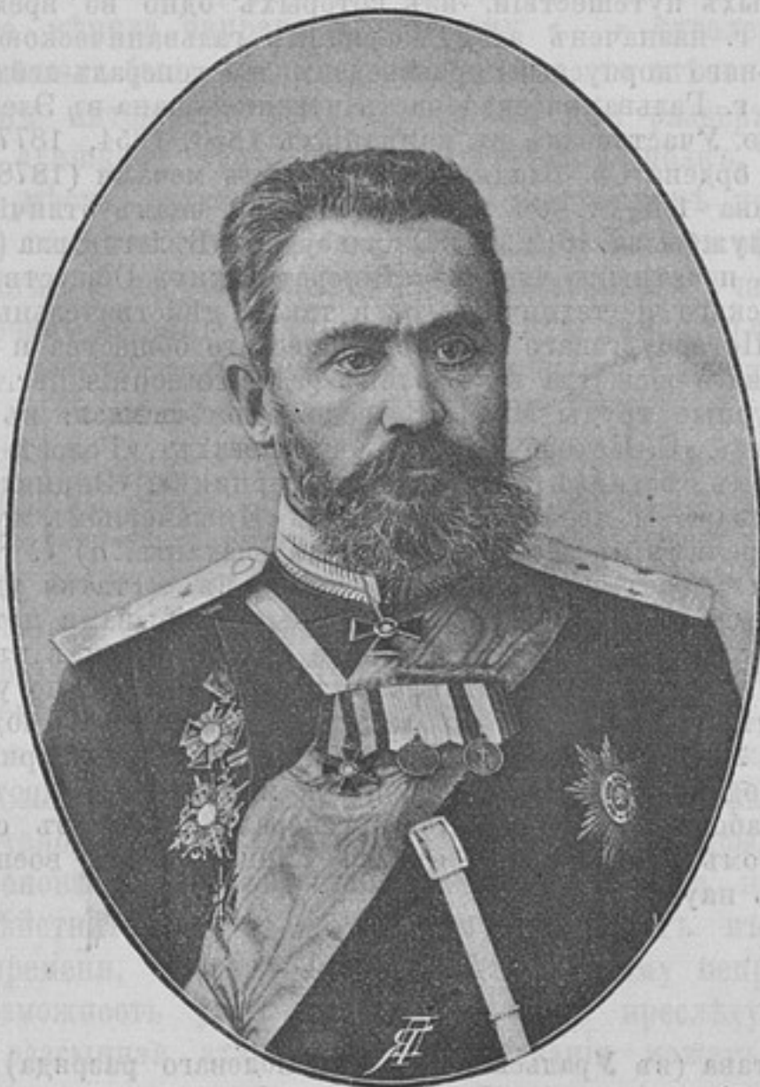
Начальникъ 30-й пѣхотной дивизіи, Генераль-Лейтенантъ Эдуардъ Эдуардовичъ ЗЕЗЕМАНЪ.

За границу на Годъ 8 р.; на 1/2 года 5 р. Деньги могутъ быть выслаемы почтовыми марками, каждая не дороже 50 к. Безденежная подписка не принимается. За перемѣну адреса 28 к. Отдѣльные №№ выслаются за 15 к. Объявленія принимаются по особой расцѣнкѣ, выслаемой по требованію.