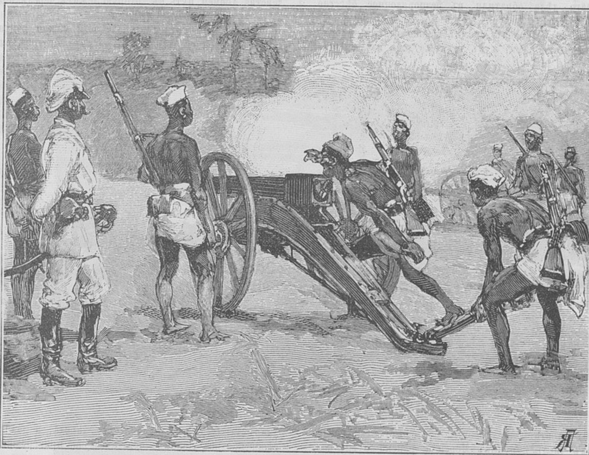
Нартзная батарея дагомейцевъ въ дѣйстви.

Никогда нельзя было ограничиваться въ военномъ дѣлѣ