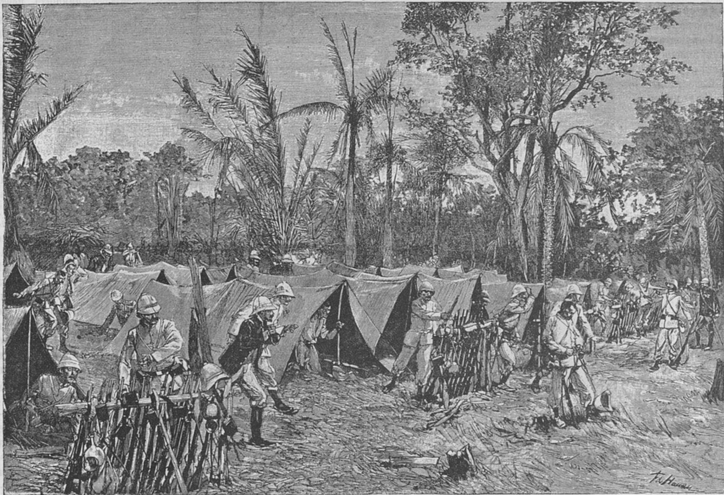
Бивакъ французскихъ войскъ у м. Догба въ минуту неожиданнаго нападенія дагомейцевъ.

могъ бы отбросить французовъ отъ пути отступленія (лѣвый берегъ) въ полосу лѣсовъ и болотъ, но если принять во вниманіе: а) что южнѣе Обоа мѣстность праваго берега покрыта дремучими лѣсами и болотами и потому очень трудна для движенія; б) что сѣвернѣе Обоа мѣстность менѣе лѣсиста и болѣе культурна и в) что дагомейцы деморализованы побѣдою французовъ при Догбѣ и потому врядъ ли рѣшились бы принять бой не за укрѣпленными линіями; то нельзя не согласиться, что полковникъ Додсъ дѣйствовалъ вполне сообразно съ обстановкой. Дальнѣйшее наступленіе Додса было задержано дождями и онъ 28 сентября (10 октяб.) занялъ безъ боя Сабови, сдѣлавъ въ 4 дня только 12 кил., благодаря размокшему грунту и необходимости прокладывать дорогу. Укрѣпленная позиція оказалась поспѣшно оставленною непріателемъ, о чемъ свидѣлствуютъ разбросанные по дорогѣ и въ лагерьѣ запасы. На пути 26 сентября (8 октября), дагомейцы сдѣлали попытку атаковать, но были отбиты. На