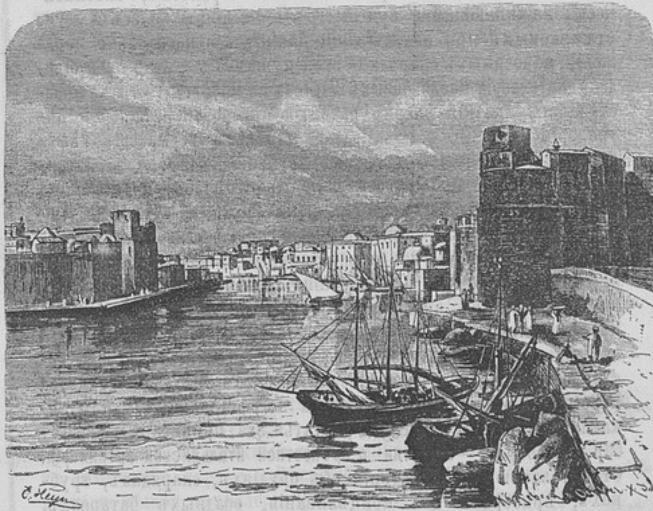
Видъ порта Бисерта въ Тунисѣ.

Illustrazione Militare Italiana. (Италія). — Ноябрь и декабрь 1892 г. — Какъ извѣстно, работы французовъ въ гавани Бисерта (франц. Bizerte, въ Африкѣ, у