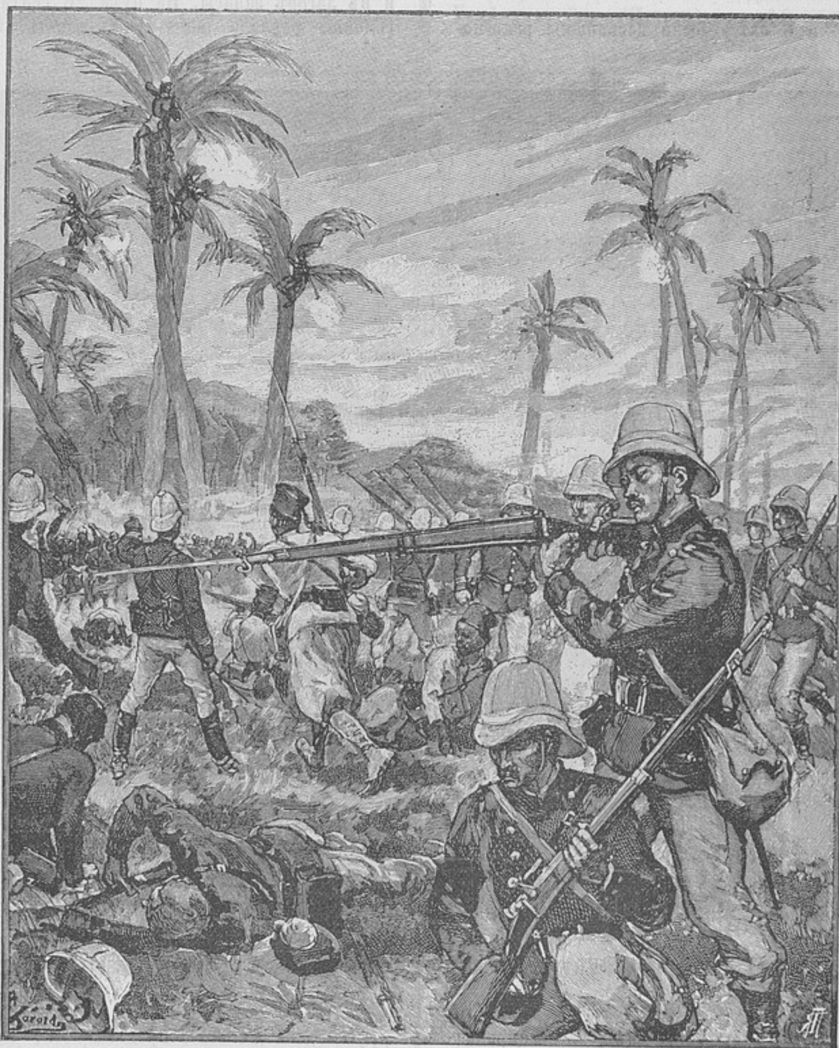
Сраженіе при м. Догба.

Во время наступленія Додса къ Канѣ, дагомейцы производили набѣги на коммуникаціонную линію не только мелкими партіями, но иногда и значительными. Такъ, 12 (24) сент. отрядъ изъ 600 дагомейцевъ, вооруженныхъ скорострѣльными