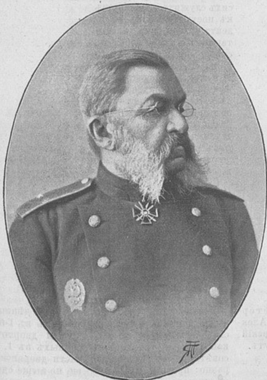
Генераль-маіоръ Михаилъ Никитичъ МАЗЮКЕВИЧЪ.

ПУСТОЙ ПРИЮТЪ для круглыхъ сиротъ офицерскаго званія (смотри «Развѣдчикъ» № 317, стр. 1000), всѣ вакансіи свободны.