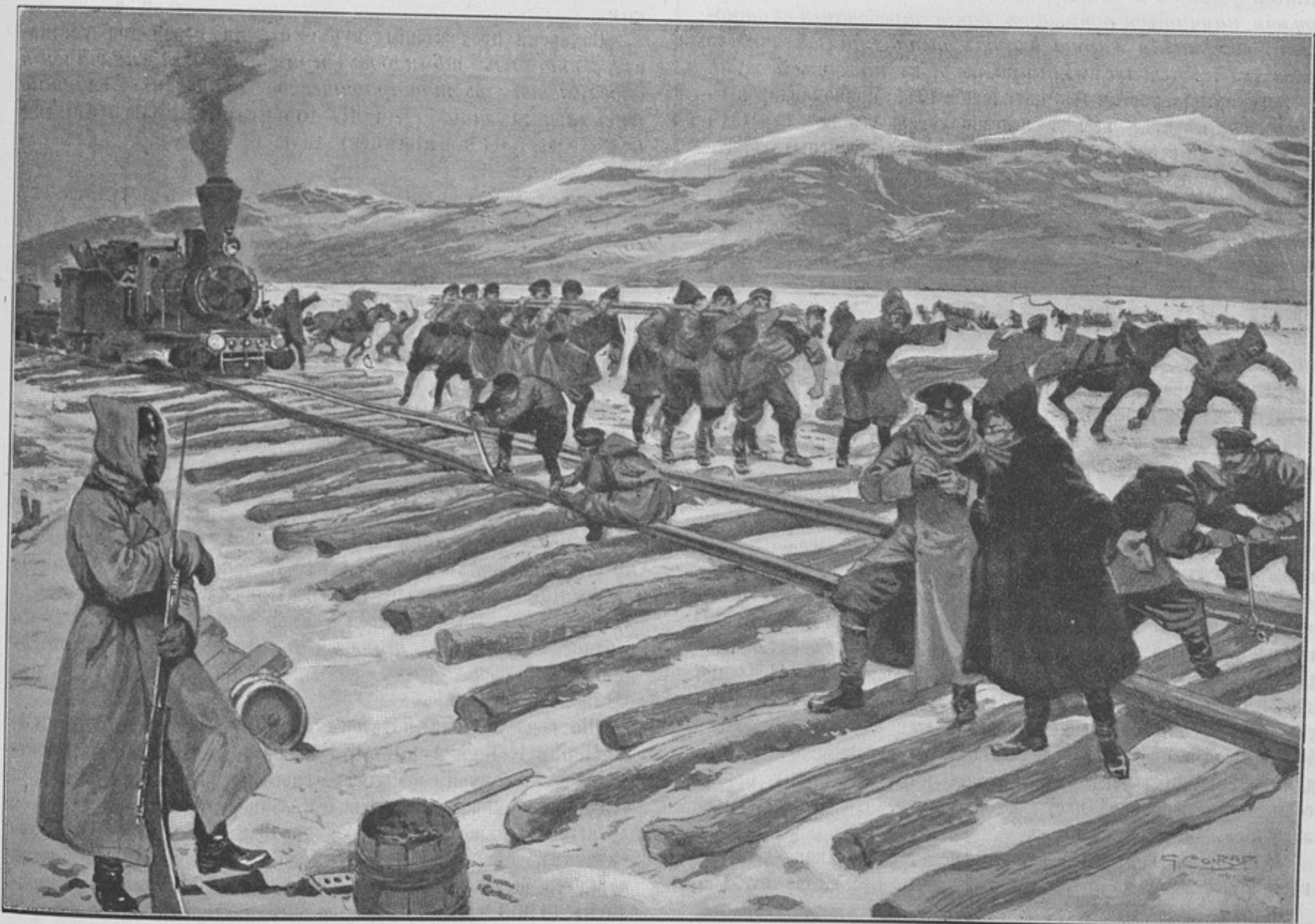
Переправа черезъ Байкаль (по рисунку «Illustration»).