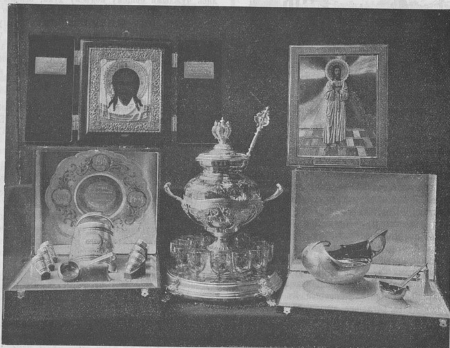
Юбилейные подарки Котельничскому рез. баталіону. (Къ корресп. «Вятка»).