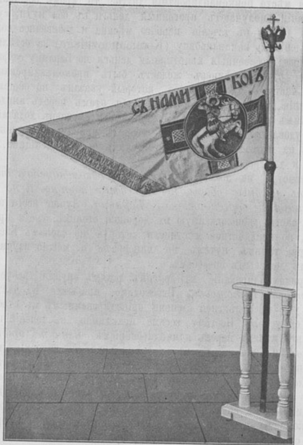
Стягъ поднесенный Москвой генераль-адъютанту Куропаткину (Живопись академика Васнецова).