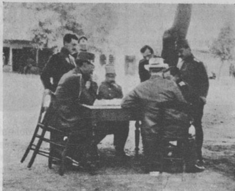
Изъ Балканской распри. Греческій военный совѣтъ. Слева на право: королевичъ Андрей, полковникъ Дусманисъ, начальникъ штаба арміи, капитанъ Метаксасъ и Венезелосъ.

4) «Офицеръ» пишетъ, что для того, чтобы удостойться полученія чести отъ нижняго чина, нужно получить извѣстную подготовку и общеобразовательную и специально-военную. На это можно сказать, что какъ между офицерами, такъ и между чиновниками одинаково встрѣчаются люди только по внѣшности военные, а по духу и воспитанію —