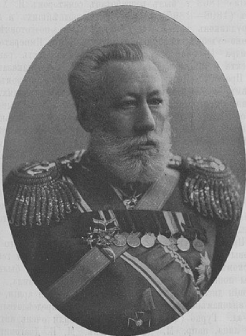
Завѣдывающій артиллерійскою частью Омскаго военного округа, генераль-лейтенантъ