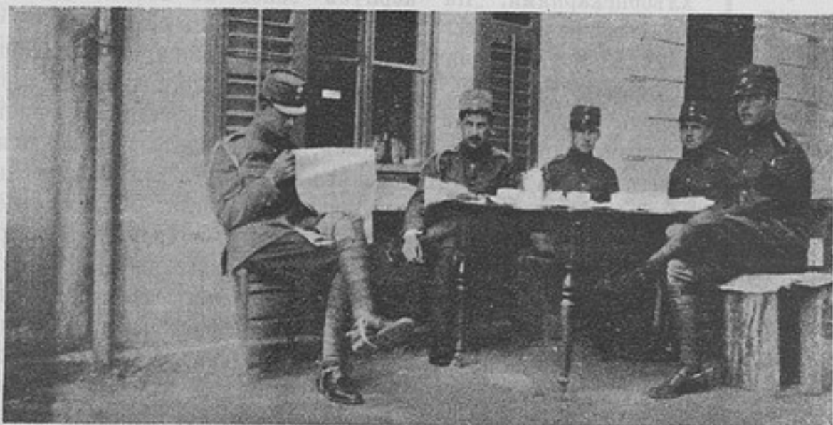
Изъ Балканской распри. Греческіе королевскіе принцы за завтракомъ на театрѣ военныхъ дѣйствій. Слева на право: королевичъ Андрей, Николай, наслѣдный принцъ Георгій, Христофоръ и Александръ.

такъ-себѣ, а потому не слѣдуетъ замѣчать въ чужомъ глазу соломенки, имѣя въ своемъ глазу бревно.