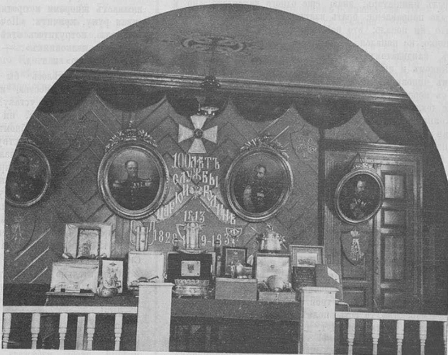
Подарки, поднесенные 110-му пѣх. Камскому полку по случаю столѣтняго юбилея. (Къ корресп. „Ковна“).

Прослуживъ большую часть своей службы въ штабахъ и канцеляріяхъ, я вынесъ убѣжденіе, что для того, чтобы имѣть на должности хорошо знающаго дѣло чиновника, необходима именно «Школа военныхъ чиновниковъ», ибо въ этой школѣ необходимо, кромѣ прохожденія курса писемоводства и счетоводства по вѣдомствамъ главнаго штаба, артиллерійскаго, инженернаго и интендантскаго и знакомства съ мобилизаціоннымъ дѣлопроизводствомъ, еще и обученіе чиновниковъ правиламъ военной дисциплины, умѣнью дѣлать докладъ по бумагамъ и перепискамъ со справками изъ законовъ и т. п., быстрому ориентированію въ законахъ (задавать для этого задачи и т. п.); обученіе чиновниковъ должно быть общее, т. е. такое же, какъ и для всѣхъ офицеровъ; этимъ я хочу сказать, что чиновникъ, окон-