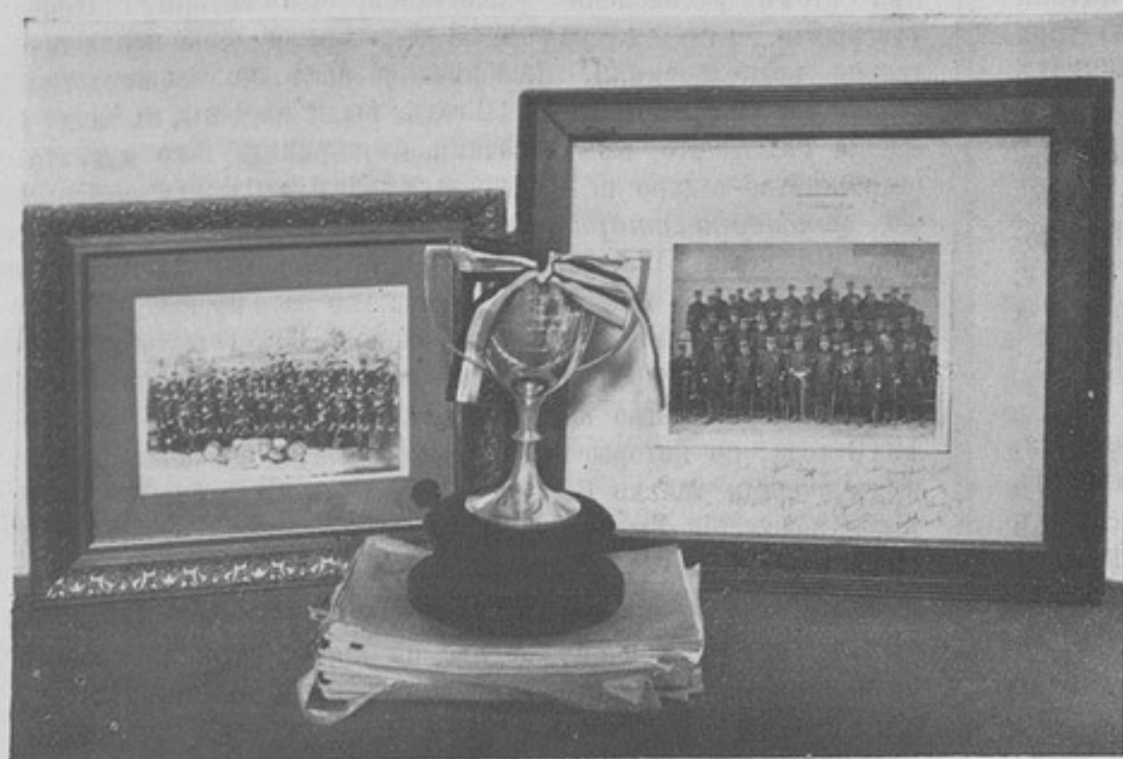
Подарокъ 110-му пѣх. Камскому полку въ день столѣтняго юбилея отъ 110-го пѣх. французскаго полка. (Къ корресп. „Ковна“).

ихъ каждый самъ знаетъ много, а коснусь того закона, который меня въ данный моментъ интересуетъ и разъясненія котораго имѣютъ принципиальное значеніе.