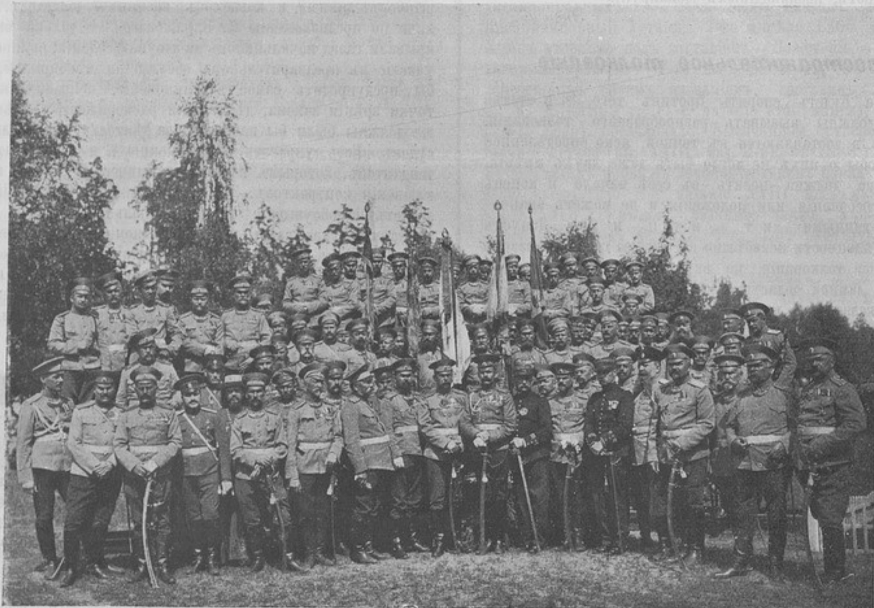
Подъ сѣнью знаменъ: Депутации 110-го пѣх. французскаго полка и 22-го пѣх. Нижегородскаго полка, среди камцевъ — служащихъ и служившихъ въ полку. (Къ корресп. „Ковна“).

Тамъ, гдѣ управляютъ въ рядѣ штабныхъ соотношеній