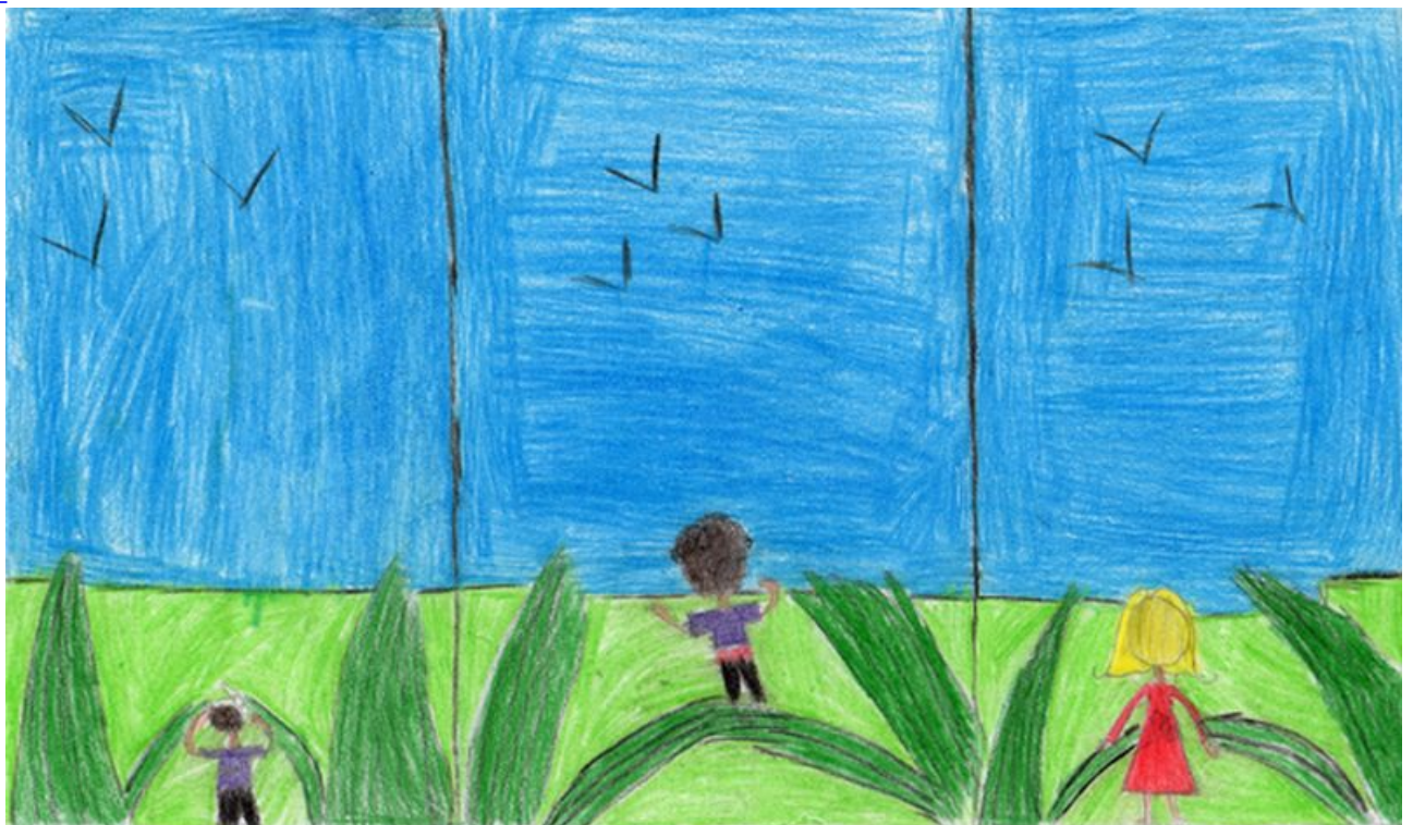
Na sua pré-adolescência, gostava de aprontar com as meninas. Amarrava o mato-relógio na beira da estrada e gritava "Olha a onça!"; as meninas saíam correndo, tropeçavam e caíam.