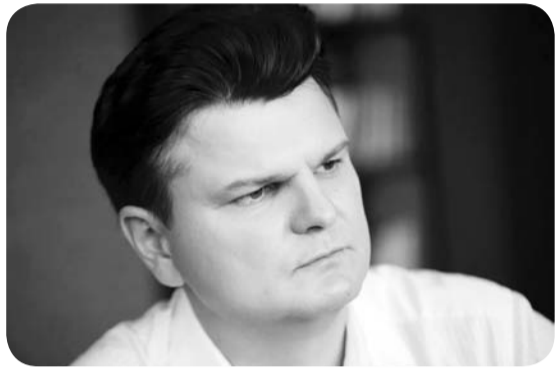
Руслан ГОРБЕНКО, народний депутат від партії «Слуга народу», 41 рік, Київ

Що означає стати одним з тих, хто сворий на COVID-19, як факт зараження змінює світогляд і відносини з навколишнім світом? Про церозповідають п'ять українців, які пройшли через коронавірус і одужали.