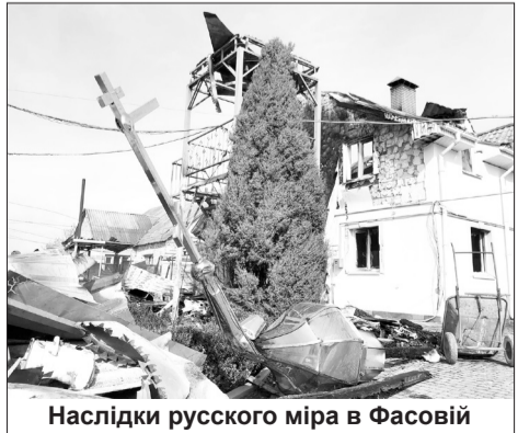
Наслідки русського міра в Фасовій