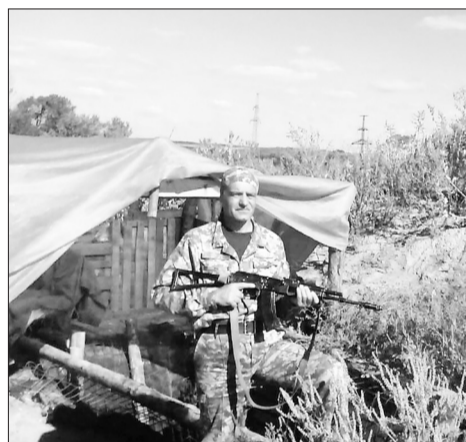
Старшина із позивним «Поет» брав участь в АТО з 2015-2016 роки

У Спільці учасників бойових дій у Макарові ми ще за 2 місяці до початку повномасштабного вторгнення говорили, що буде війна. І я був переконаний, що росіяни нападуть з Білорусі. Ми збиралися і обговорювали наші питання, наші дії. Люди, мої друзі закликали йти партизанити, але чим би ми воювали? З рушницями багато не навоюєш. Я вважав, що треба йти у ЗСУ. Говорили, що буде хаос, бо тероборона лише на папері існувала.