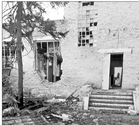
Після обстрілу 18-ого березня. Тоді загинуло шість людей, важкі поранення отримало троє

При обстрілі загинуло шість хлопців... Командир першого взводу. Капітан. Мій заступник старшина Ваня. І троє бійців.