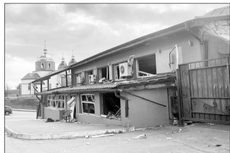
Бішів. Церква і кафе на початку квітня

Чи не в кожній промові московський патріарх кіріл гундяєв, як мантру, повторює свій улюблений слоган: «Україна, росія, беларусь – вместе мы святая Русь». Посилається при цьому на українського святого першої половини ХХ століття – преподобного Лаврентія Чернігівського. Проте Лаврентій Чернігівський цих слів ніколи не казав. Більше того, він ніколи не визнавав влади московського синоду і був одним з лідерів опозиційного по відношенню до московського патріархату церковного руху «Істинно-Православна Церква» (ІПЦ) на Чернігівщині.