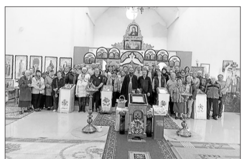
Парафія святого великомученика Георгія Побідоносця с. Мотихин після жахит, що наробили росіяни в селі, проголосувала за перехід до ПЦУ

У цьому російському (а не церковно-слов'янському) творі – типовому пропагандистському тексті «руського міра» є, зокрема, такі рядки: