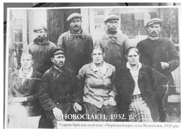
НОВОСІАКИ. 1932 р.

Ударна бригада колгоспу «Черна Іскра» села Новосілки, 1932 рік