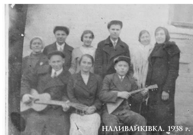
НАЛИВАЙКІВКА. 1938 р.