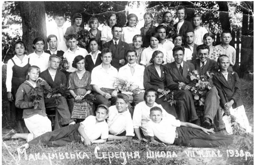
МАКАРІВСЬКА СЕРЕДНЯ ШКОЛА VII КЛАС 1938р.