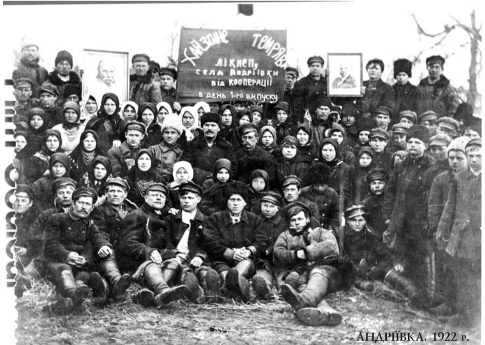
АНДРІЙКА. 1922 р.