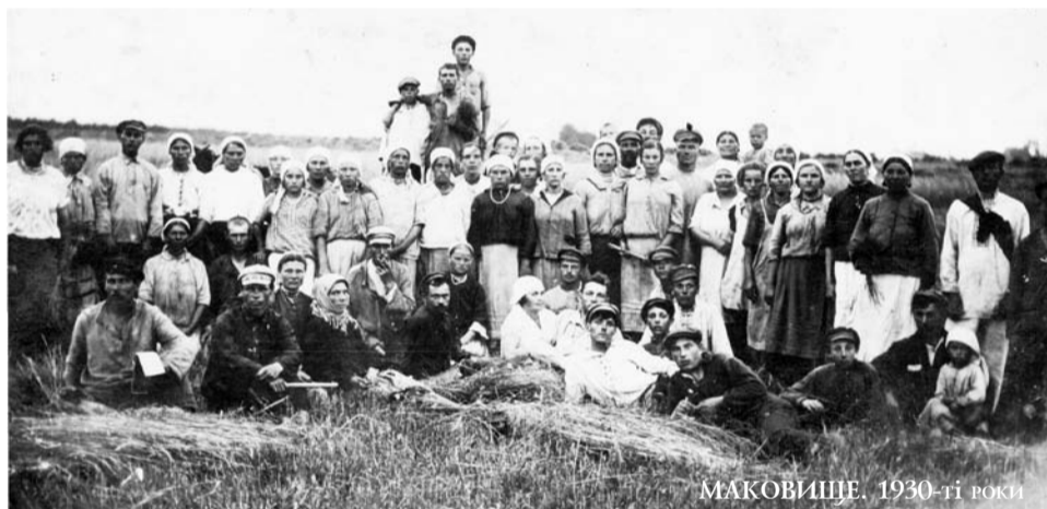
МАКОВИЩЕ. 1930-ті роки

Виставка створенна за активної участі Інституту історії України НАН України та кампанії «Пам'ять Нації» та за сприяння Макарівського районного Будинку культури.