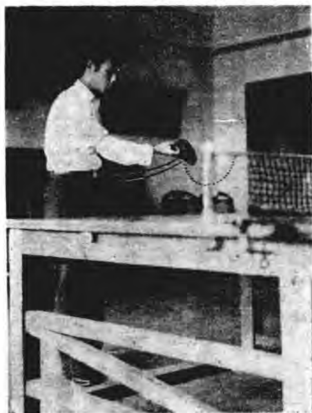
圖一 右手左邊抽球法

左邊抽球為最美觀，最尖急之一種法門，且易使敵不及回擊，而自己抵敵對方來球，亦較靈活。其用法：俟球落至左方檯邊時，執板右手，宜向左橫伸直，手身須向左後略側，右