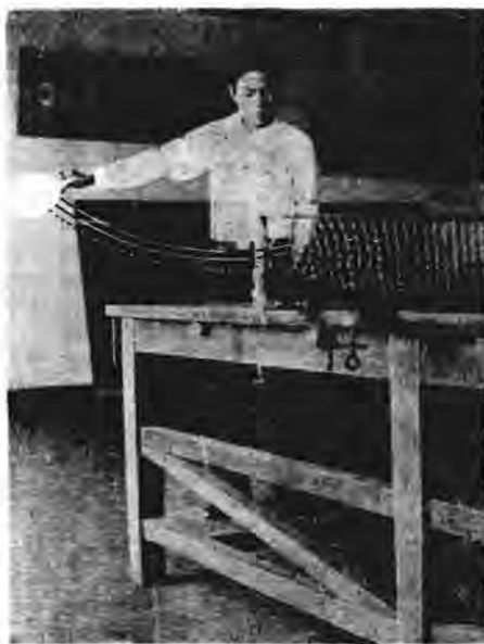
圖四 右手右邊抽球法