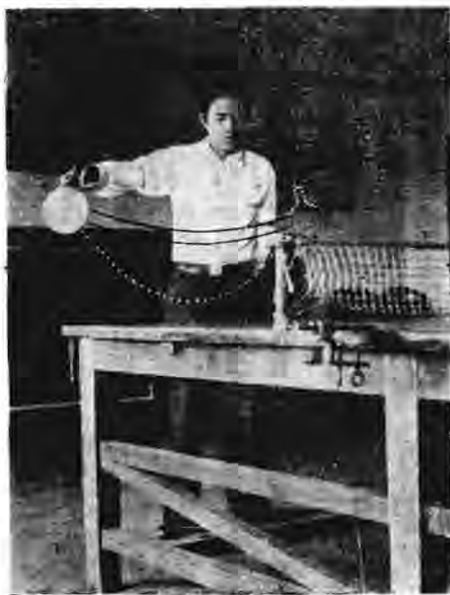
圖六 右手右邊擦球法

右邊之擦球，學者亦常能之，惜多不精！擦過之後，球常跳高，使對手易于射擊，如能擦至精美，即球每能迅速過網飛轉，有如抽球然，敵方則無法可以回擊。其法俟球至己方檯右，則執板右手，向右平衡伸直——略曲亦可——板亦須直立，超過右方離球二三呎，右足比左足退後一步，身與手略向右侧，球由板中直的平面擦之，球自至對方檯上向左侧動，如圖六。