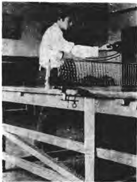
圖二 右手左邊壓球法

壓球，係由高用力向對方檯上壓下，使球一躍數呎，無法回擊。此法須俟對方球至己方檯上左邊離網不遠，躍有呎餘之高，即將執板右手，向左網角伸直，板亦橫直，右足仍進前一步，食指向下一擒，使板成橫立式，望球向對方左角直壓，遠近均可。此種壓球機會不易多得，每擊輒可得分，如圖二。