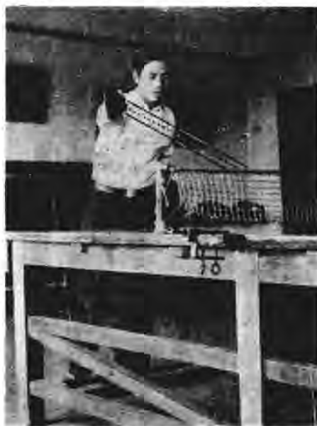
圖五 右手右邊壓球法

呎餘之高，即將執板右手，向右平衡伸直——略曲亦可——板亦橫直，右足仍比左足退後一步。