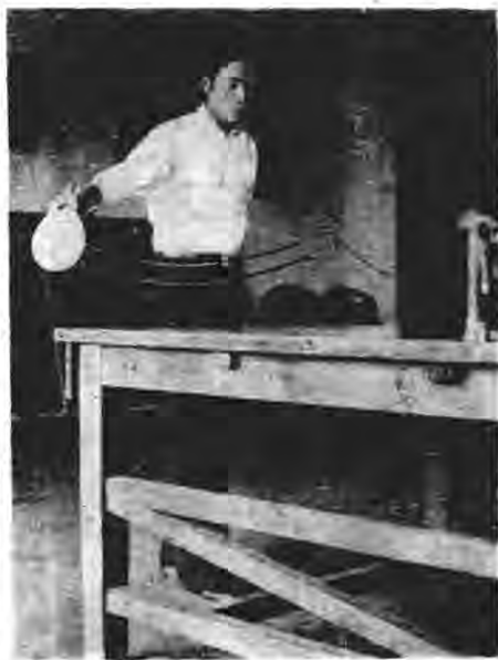
圖 三 右 手 左 邊 擦 球 法

左角極端，或跳離檯外時，足與身向後退，依法行之，方能收效，否則，若中途一抽，球自出對方檯外