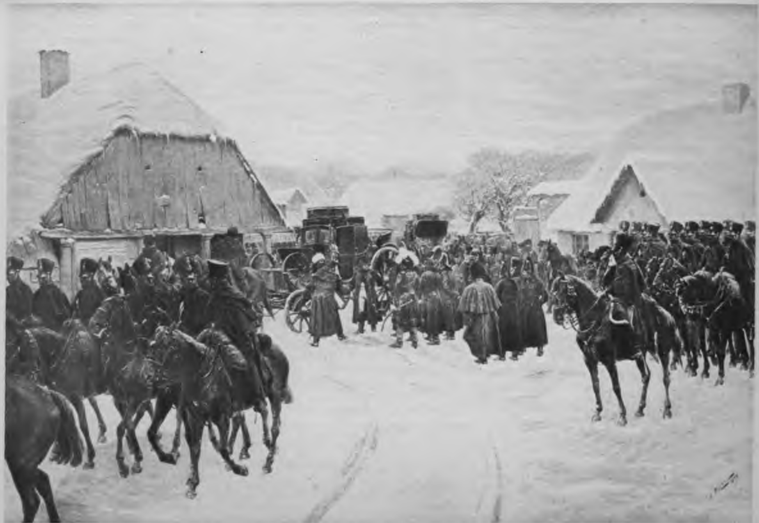
И. Розенъ.—Наполеонъ поглядываетъ остатки своей арміи 5-го декабря 1812 г.