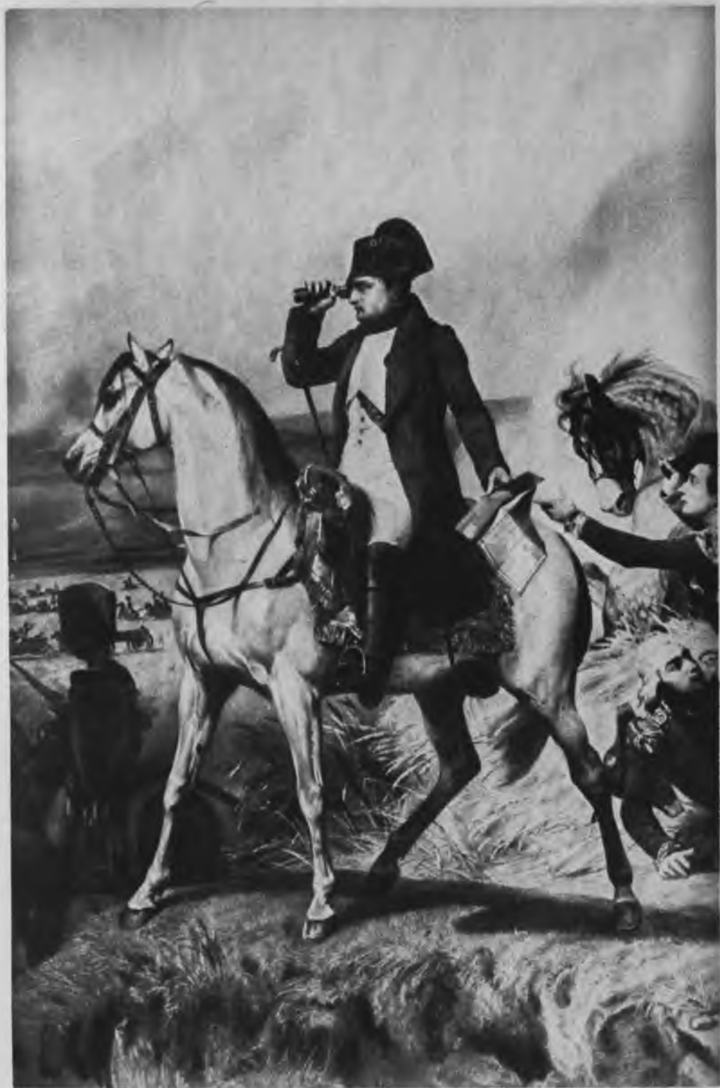
Наполеонъ при Ваграмъ.