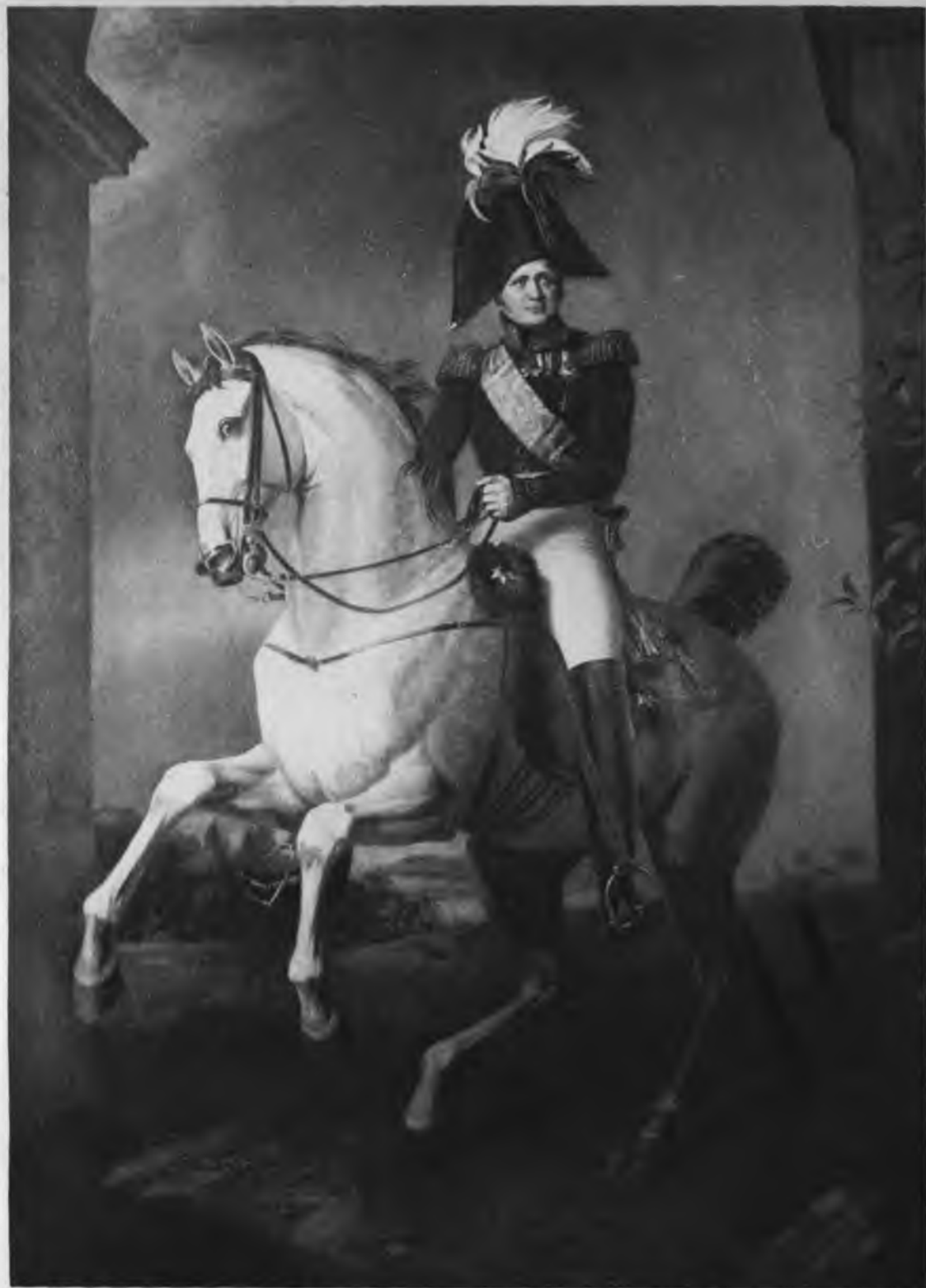
ИМПЕРАТОРЪ АЛЕКСАНДРЪ I.

Карг. Доу. — Находится въ Оружейной Палатѣ въ Москвѣ.