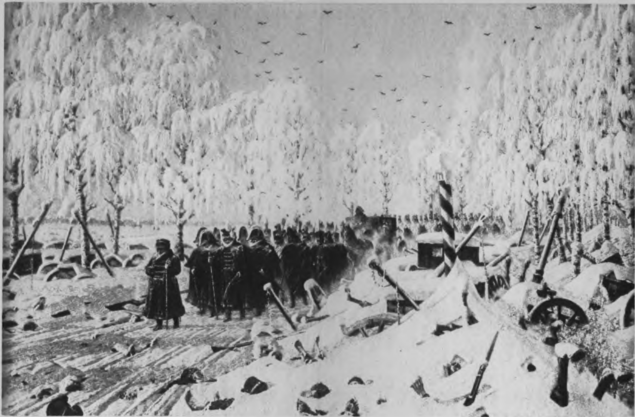
В. В. Верещагинъ.—Отступление Великой Арміи (Панолонъ и его Штабъ).