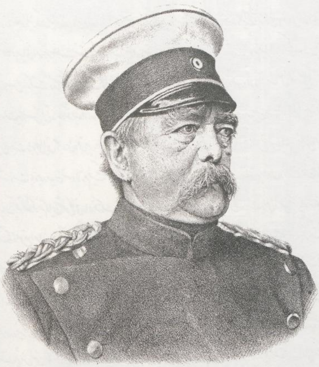
جناب پرنس بزمبارک