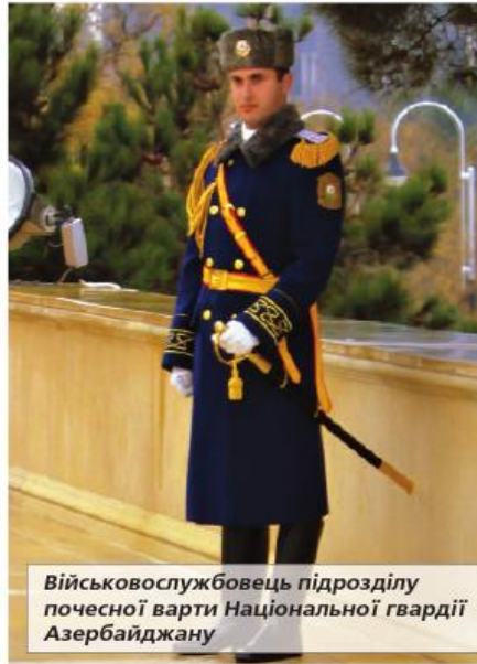
Військовослужбовець підрозділу почесної варті Національної гвардії Азербайджану

Зазначимо, що Французька Національна гвардія не має нічого спільного із жандармерією. Вона не була ані її попередницею, ані прообразом. Обидва формування були засновані майже одночасно (жандармерія – на два роки пізніше) і діяли паралельно, функціонально доповнюючи одне одного. Жандармерія, як відомо, існує і дотепер, причому, може похвалитися... власною гвардією. Жандармська частина, що має назву Республіканська гвардія, дислокована у Парижі, її чисельність складає 3,2 тис. правоохоронців. Гвардійці охороняють урядові будівлі, патрулюють (зокрема, верхи) центральні райони міста, беруть участь у церемоніальних заходах. Окрему увагу хотілося б приділити справі, дещо незвичній для нас, але від цього не менш важливій – серед завдань гвардійців окремим пунктом зазначено, що вони мають забезпечувати транспортування