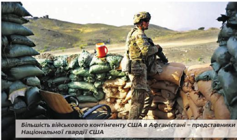
Більшість військового контингенту США в Афганістані – представники Національної гвардії США

Підготувала підполковник Валерія АГБАЛОВА