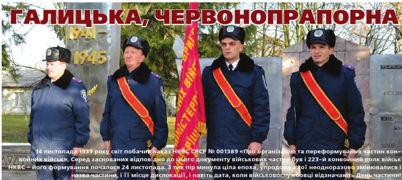
14 листопада 1939 року світ побачив наказ НКВС СРСР № 001389 «Про організацію та переформування частин конвойних військ». Серед заснованих відповідно до цього документу військових частин був і 223-й конвойний полк військ НКВС – його формування почалося 24 листопада. З тих пір минула ціла епоха, упродовж якої неодноразово змінювалися і назва частини, і її місце дислокації, і навіть дата, коли військовослужбовці відзначають День частини!

Так, 75-річний ювілей військового колективу, що нині іменується 2-ою окремою Галицькою ордена Червоного Прапора бригадою Національної гвардії України, було відзначено 10 вересня поточного року. Чому не в листопаді? Тому що у виключних випадках дату проведення щорічного свята у частині може бути змінено на честь певної пам'ятної події у її службовій біографії. Для галичан такою подією стала героїчна оборона Ромнів та згодом Вороніжа, що на Сумщині, яка тривала з 10 по 13 вересня 1941 року, тож у 1996 році відповідним Наказом міністра внутрішніх справ України дату початку цих кровопролитних боїв було встановлено Днем бригади. До речі, докладніше про оборону військовими правоохоронцями Ромнів та згодом Вороніжа, докладно розказано у №24 нашого часопису, що вийшов напередодні 70-річного ювілею Галицького з'єднання.