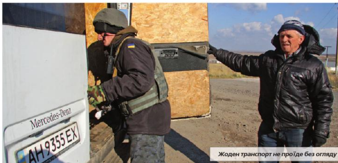
Жоден транспорт не проїде без огляду

Н астає час обіду, який бійцям привезли мариуполь-