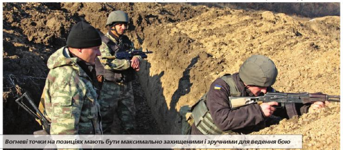
Вогневі точки на позиціях мають бути максимально захищеними і зручними для ведення бою

– Ну, тут начебто непогано – сектор ведення вогню достатній, можна стріляти в положеннях «сидячи» і «стоячи»,