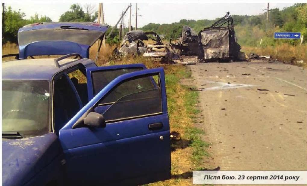
Після бою. 23 серпня 2014 року

Чому вони взяли до рук зброю, невже їх громадянські свободи дійсно утискала українська влада? Як не було їм шкода нівечити землю, котру вони нібито вважали рідною?