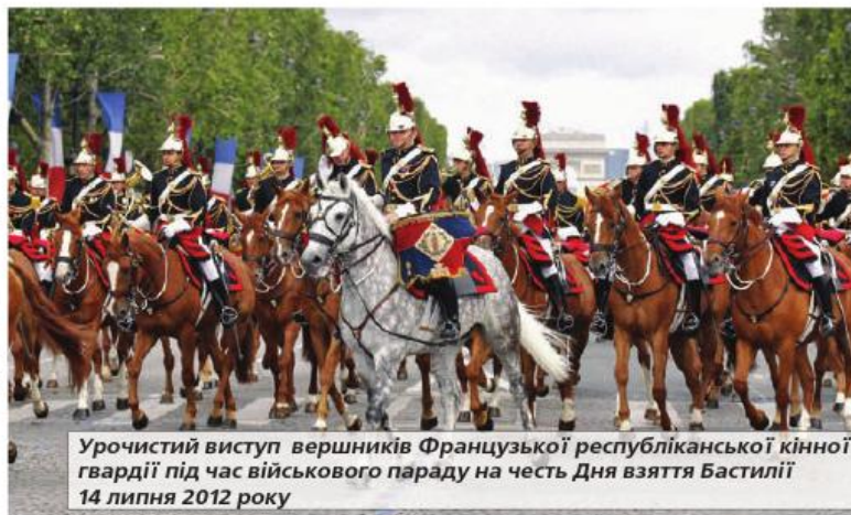
Урочистий виступ вершників Французької республіканської кінної гвардії під час військового параду на честь Дня взяття Бастилії 14 липня 2012 року

надзвичайних ситуацій природного, екологічного або техногенного характеру. Національну гвардію Грузії було сформовано 20 грудня 1990 року й укомплектовано, в основному, добровольцями та колишніми офіцерами Радянської Армії, уродженцями Грузії, що повернулися на батьківщину, аби продовжити службу в національних збройних силах. Саме гвардія стала основою місцевого регулярного війська. Її військовослужбовці брали участь у громадянській війні 1991–1993