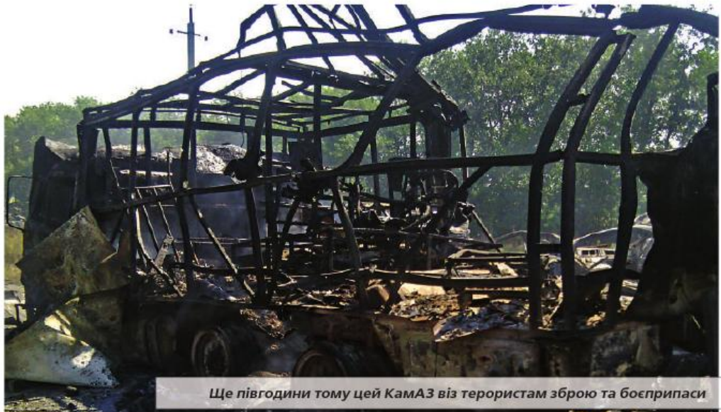
Ще півгодини тому цей КамАЗ віз терористам зброю та боєприпаси

Відходячи в Амвросіївку, гвардійці здогадувалися, що справи у сил АТО на даному напрямку не надто гарні. На околиці райцентру, неподалік птахофабрики, сепаратисти окопалися ще три дні тому – чи не їм на підмогу йшла чеченська колона? Тож коли миколаївський ВОРез прибув в Амвросіївку, там залишилося всього два блокпости, де спільно несли службу прикордонники та гвардійці, переважно з херсонської та запорізької частин. Проте щойно заступили на блокпост, надійшов наказ відходити, тепер уже в напрямку Маріуполя. Українські військові розділилися на дві колони, які попрямували різними тра-