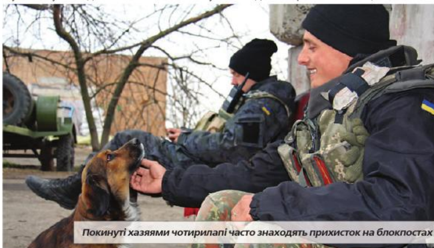
Покинуті хазяями чотирилапі часто знаходять прихисток на блокпостах

Біля бетонних блоків КПП несуть службу двоє бійців, які щойно заступили на чергування. До їхніх завдань входить зустрічати всіх, хто їде повз блокпост. Переважно – це працівники місцевих фермерських господарств, які щодня по кілька разів мотаються туди й назад, і хоча військовослужбовці вже знають усіх їх в обличчя, все одно ретельно перевіряють кожен транспортний засіб. Особливо посилили пильність після трагічного випадку 2 листопада, коли біля одного з блокпостів вибух за-