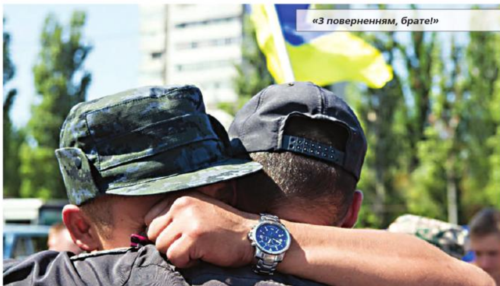
«З поверненням, брате!»

Гвардійці тягнули час. Вони розуміли, що приречені – з тих пір, як вони відступили з Амвросіївки, терористи добряче просунулися вглиб української території. 63 військові право-