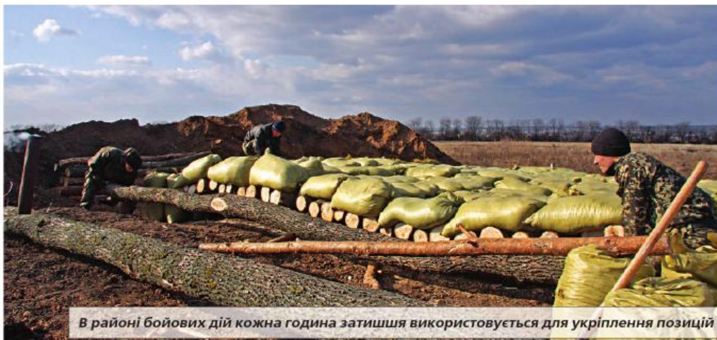
В районі бойових дій кожна година затишшя використовується для укріплення позицій

Дорога в таксі від автовокзалу Маріуполя до аеропорту, де дислоковане об'єднане угруповання НГУ сектору «М» району проведення антитерористичної операції, займає