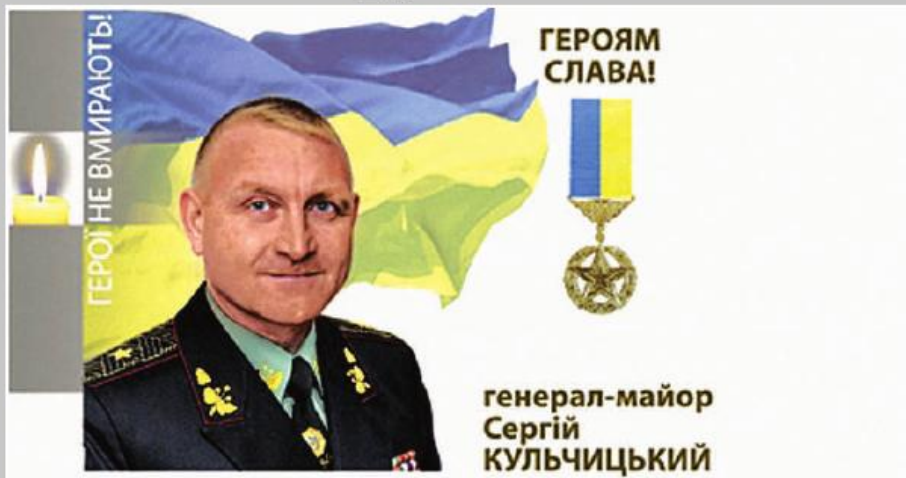
генерал-майор Сергій КУЛЬЧИЦЬКИЙ

З 2005 по 2010 рік посаду командира Галицького з'єднання обіймав Сергій Кульчицький. В житті нечасто так буває, коли підлеглі готові йти у вогонь і в воду за своїм начальником, але у цьому випадку все так і було. Коли полковник Кульчицький пішов на підвищення до Головного управління і одягнув генеральські погони, в бригаді продовжували пильно слідкувати за його успіхами і щиро ним радіти. Трагічна загибель Сергія Петровича стала непоправною втратою для всього особового складу з'єднання.