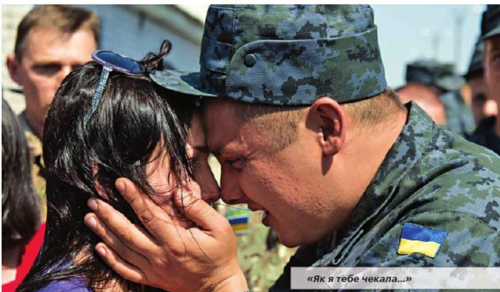
«Як я тебе чекала...»

Підполковник Валерія АГІБАЛОВА, фото солдата Андрія ГРИНГАУЗА та з особистих архівів військовослужбовців