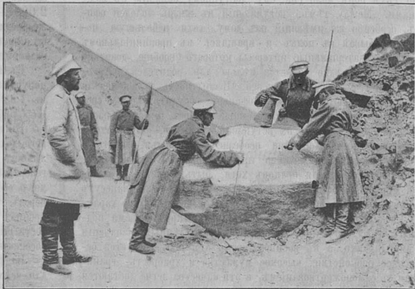
Заряжаніе цилиндровъ порохомъ (къ статьѣ «Туркестанскіе саперы на разработкѣ Памирской дороги»).

Вмѣстѣ съ этимъ возбуждался также вопросъ о томъ, оста-