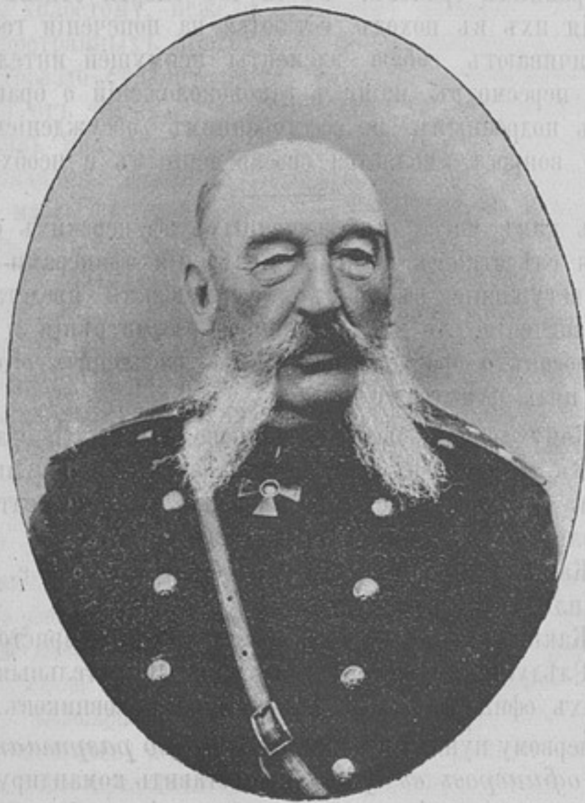
Красносельскій комендантъ и начальникъ Красносельскаго военнаго госпиталя, генералъ-лейтенантъ