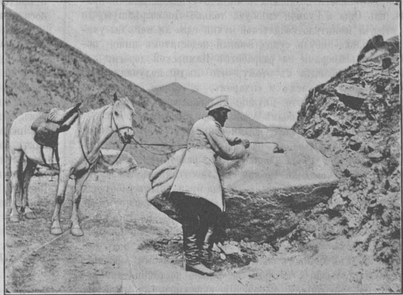
Воспламененіе зарядовъ (къ статьѣ «Туркестанскіе саперы на разработкѣ Памирской дороги»).

Съ перваго же дня на мѣстѣ, гдѣ проводилась дорога