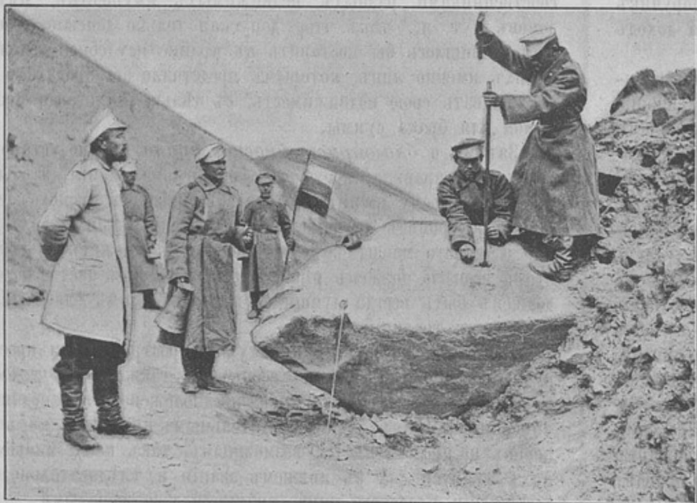
Забивка зарядовъ (къ статьѣ «Туркестанскіе саперы на разработкѣ Памирской дороги»).

Въ настоящее время существуетъ три типа офицерской одежды: мундиръ, сюртукъ и тужурка (не считая кителя), что весьма обременительно для офицера, такъ какъ для поддержанія въ должномъ порядкѣ и чистотѣ всего этого обмундированія требуются значительныя средства, вслѣдствіе чего представляется желательнымъ установить для офицера или два типа одежды, или же выработать такой покрой мундира и сюртука, чтобы, при незначительной передѣлкѣ, какъ мундиръ могъ бы быть обращаемъ въ сюртукъ для повседневнаго употребленія, такъ и, наоборотъ, свѣжій сюртукъ могъ бы дешево передѣланъ въ мундиръ. При этомъ указывалось, какъ на болѣе удобный типъ одежды, на сюртукъ нынѣшняго покроя, съ тѣмъ, чтобы имѣющееся шитье на воротникахъ мундира замѣнить особымъ нагруднымъ знакомъ, или же установить для парадной формы какія-либо дополнительные пристегивающіяся петлицы. Противъ этого предположенія высказано было однако много заявленій, такъ какъ сюртукъ нынѣшняго по-