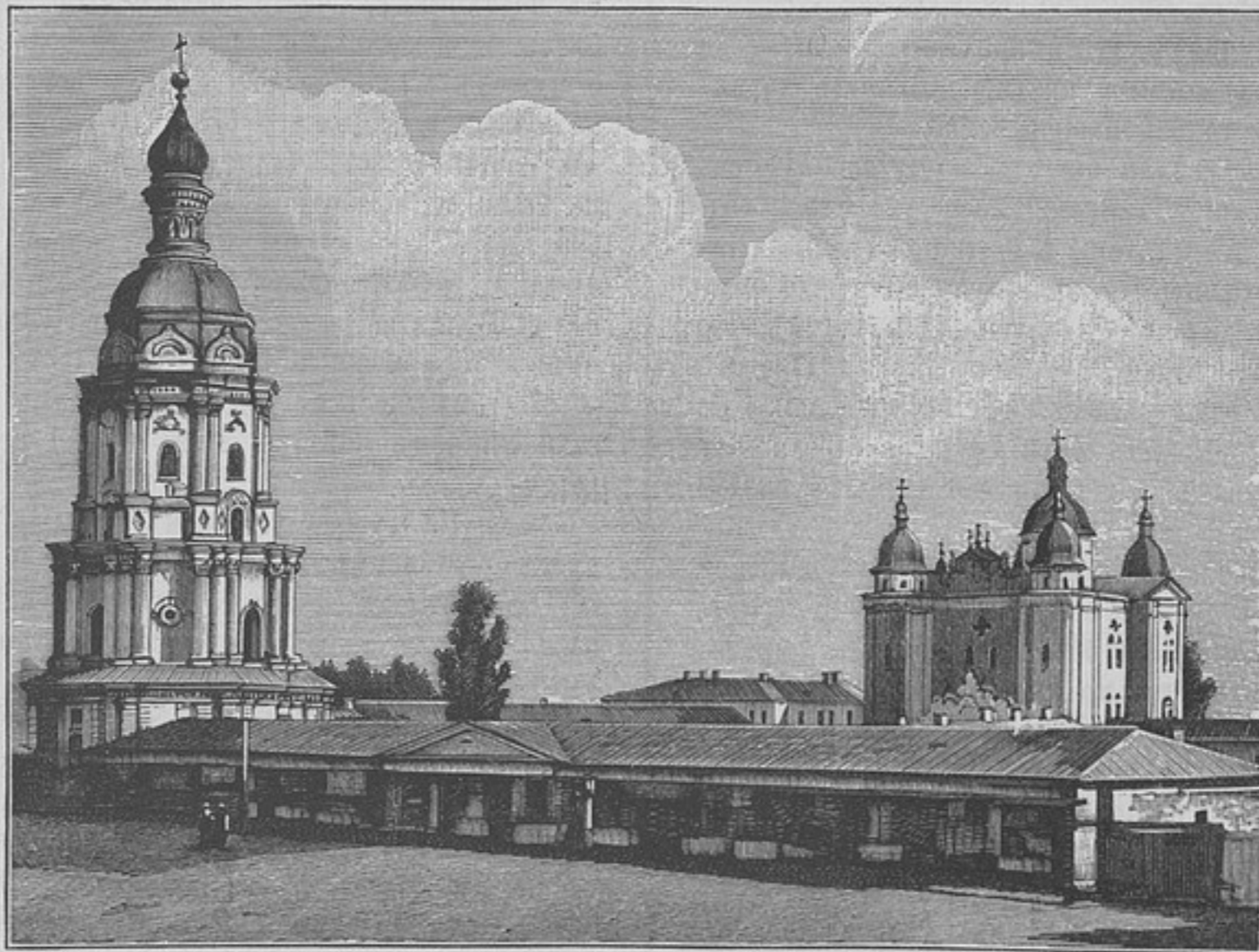
Кіевскій Николаевскій военный соборъ, на Печерскѣ (къ корреспонденціи «Кіевъ»).

*) Призыва 1874 года. Дѣло происходитъ въ 1880 году.