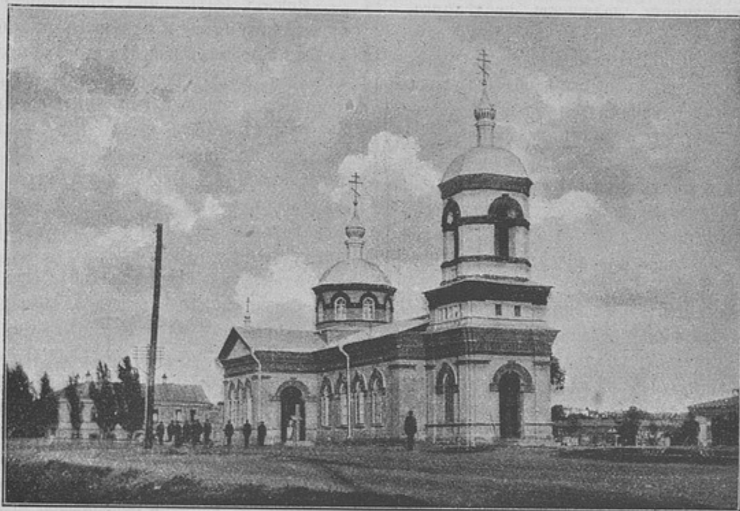
Храмъ Черниговскаго драгунскаго полка.

Всякая командировка, какъ бы тамъ ни было, не обходится для офицера безъ извѣстныхъ расходовъ, которые въ большинствѣ случаевъ оплачиваются отпускомъ изъ казны въ видѣ прогоновъ и суточныхъ денегъ. Но есть одна командировка, которая кромѣ убытковъ и по своему существу для строевого офицера никакой пользы не приноситъ какъ въ матеріальномъ отношеніи, такъ и въ отношеніи строя, потому что она только отвлекаетъ отъ послѣдняго. Это — командированіе офицера для исправленія должности дѣлопроизводителя уѣзднаго воинскаго начальника. Нежданно-негаданно даютъ тебѣ предписаніе въ руки, предложеніе на проѣздъ по желѣзной дорогѣ; если нужно лошадьми ѣхать, по 6 копѣекъ съ версты и суточныхъ по числу дней въ дорогѣ, которыя все пойдутъ на извозчиковъ, носильщиковъ и другую прислугу, а самъ поѣзжай, какъ знаешь. Хорошо еще случится лѣтомъ, а зимой-то?