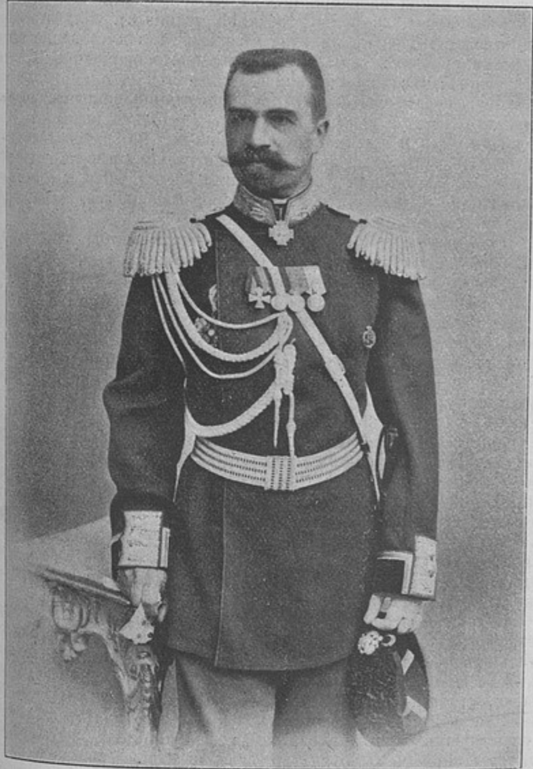
Начальникъ штаба отдѣльнаго корпуса пограничной стражи, генеральнаго штаба генераль-маіоръ