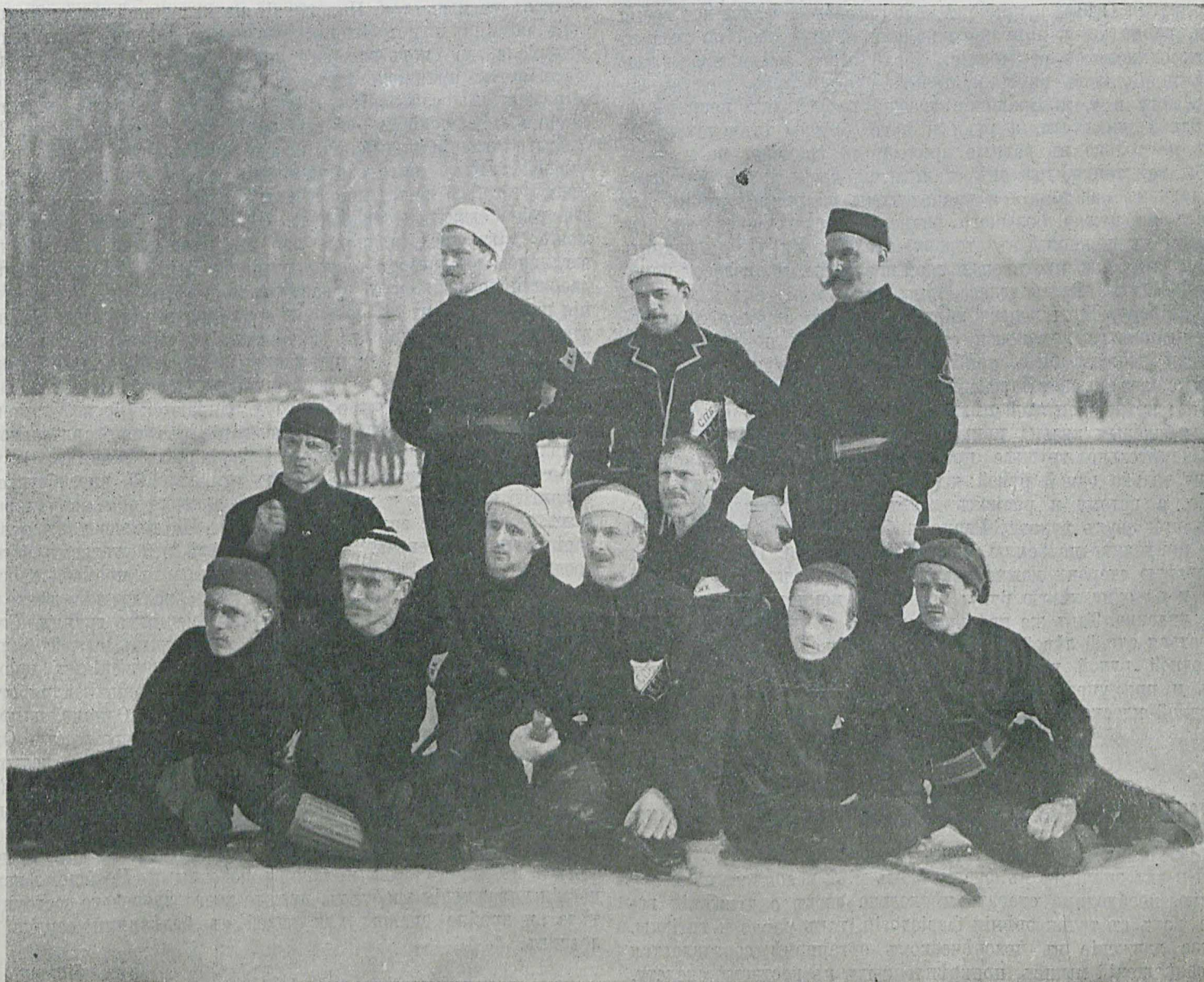
Сборная хоккейная команда „Петербургъ“, выигравшая матчъ въ хоккей у команды „Москва“ 27 февраля 1911 года.

Продолжается подписка на журналъ „Русскій Спортъ“: годъ—12 р., 1/2 года—6 р., 3 м.—3 р. съ доставкой и пересылкой.