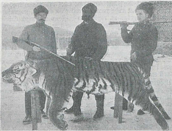
Тигръ, убитый на развѣздѣ „Казанцевъ“. (Подробности см. въ № 2 „Русской Охоты“ за 1911 годъ). ❏

свероссийскихъ первенствъ рѣшено въ этомъ году организовать въ Петербургѣ въ началѣ июля. Для привлеченія къ участию въ большихъ состязаніяхъ по возможности большаго числа провинціальныхъ гребцовъ рѣшено, въ цѣляхъ сокращенія расходовъ мѣстныхъ клубовъ, принять на счетъ союза заготовленіе гоночныхъ лодокъ. Организацию розыгрыша первенствъ отдѣльныхъ городовъ, а также ряда другихъ открытыхъ гонокъ, рѣшено поручить мѣстнымъ обществамъ. Собраніе рѣшило присоединиться къ международному гребному союзу и въ дальнѣйшемъ устраивать гонки исключительно по правиламъ, принятымъ послѣднимъ. Въ составъ всероссийскаго союза принято второе московское гребное общество. Въ заключеніе собраніе рѣшило командировать лучшихъ русскихъ гребцовъ на рядъ большихъ международныхъ гонокъ, въ частности на розыгрышъ первенства Нидерландовъ.