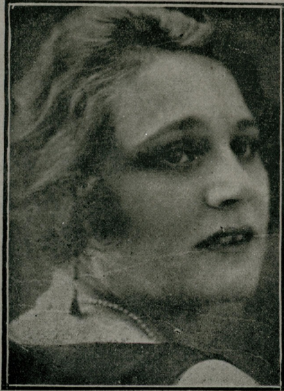
میلوویچ اک صرک جبقار بیغی رسمی

(۳۰) نومرولی نسخه. مزه میلوویچک مملکتدن دفع اولاسنی کچیرلیش بر تهلکه عد ایشدیکیزی یازمشفق . بعض قائلریز کوندر دکاری ، کتوبرده علی الماده بر آقترسی نه سببه تهلکه کی کوردیکیزی صور- ییورلر . بویوک حادملر ایچنده غالبایقین خاطرلمری چابوق اونویوز . عموی حرکت صوک بیلارنده او ایم انزمامک یاشلادی زمانلرده مملکتک بیکارجه اولادی بربریشه آیلرجه اوزاق جهلملرده خسران ایله چارپیشیرکن اوج بش سقبه اونلرک قائلری