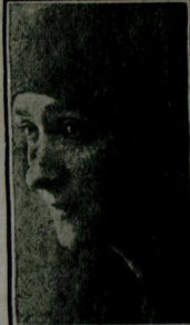
بريه موحد خانم ايديله ممشدر . ايلك تورك مئشه ييدر .

تطبيقات مكني اولاجدي . فقط داراليدايه ياتايه يارك ايجون مكنيتب صنعتني اماله مجبور اولش و بوكون كورولديني وجهه بالكنز تيارودن عبارت قالمشدر . حاقمرك و اونك مئيل بولنان شهرامنيك بو قيتدار مؤسسبه داهما واسع بر نشكل و تكل امكاني بخش ايجسي صيبيله شاين تميدر . مملكتمزده آراضه قومده ، اورپرت ، هيئلري كايور . حالو كه اقتضار ايله ادا اولنه يلكه كرك داراليدايه م كرك اورپرت هيئتنز استانبوله كلن قومبايهرلر بك جوغه قائم و كور يادني امثالندن برقي سته م مادلدر . بر جوق خصوصارده اولديني كي بزم صحت بخشوده كنديمز بك اعهاد ايجمز . تيارولر ع مقدمه بدبين اولانلر ع ، حق بوئوزق داراليدايي ، اورپرتي كورمك زوم حسن ايجمش متولر بزم يله واردر . اولر بومئنا