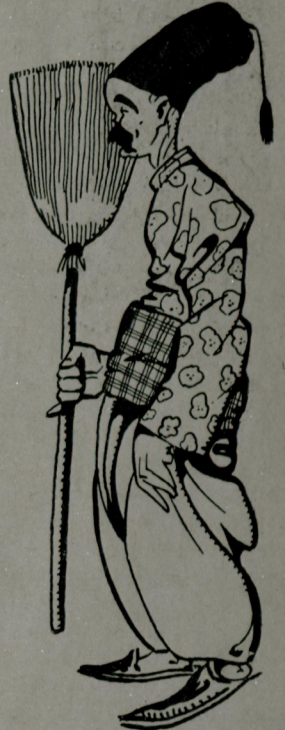
قريبه مئسي افندي حسن افندي كند هر ياك كورور بو قومقدر . تورك مئشه سرك . انا صحتكارلري هر دوره كندني ايتيلا . ممشدر

اولق اوق شرطيله مملكتمزده آئي ، ايتش سنه دن بري تيارو وار . فقط ريق ياشارك ، نامق كالرك ، حال بكرك لورمق ايسته دكلري صنعت بنالري زمان يشاماشدي . داراليدايه تأسس ايديه يه قادارده بزده تيارو تاليفسي ايلان ياكش ياشايه بيلن مناقب افندي ايله اركاداشلري اولدي . داراليدايك قورويشي صنايه قيسه تاريخمرده بركال مرسله سي اولقه قالاز . حقيقي تيارو ايجون بر باشلانغدر ديه بيليرز .