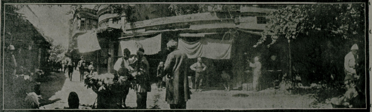
مضانده چارشى ، بازار ✦ اوروج ، اشها علاجى كى هر كى چارشى ، بازاره قوشد ريبور . ديشه دوفومان اشيا ايله دولو دكانك ايجى آلانله ، جامكانلى ده بوتقونانله دولودر .