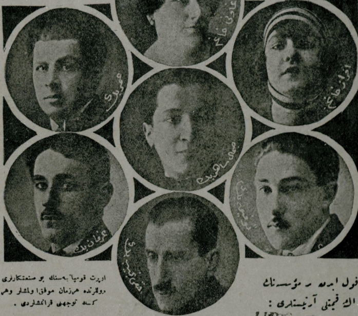
ايزت قومبايهرلر بو صنعتكارلري اورلر نه مرزبان موفقا و لشار وهم كسه توجهي فرماشدر .

داراليدايه اساساً صنعت مكني اولق اورده ايجلدي . حق بو مقصدله مشهور فرانسز ( انطواس ) داراليدايه مدير اولارق انتخاب و جل ايدلمشدي . اوراده تيارو صنعتك محتاج اولديني مختلف درس لر نظري و عملي اولارق اوكره تيله ك و بوكوني تيارو عادتا برنوع